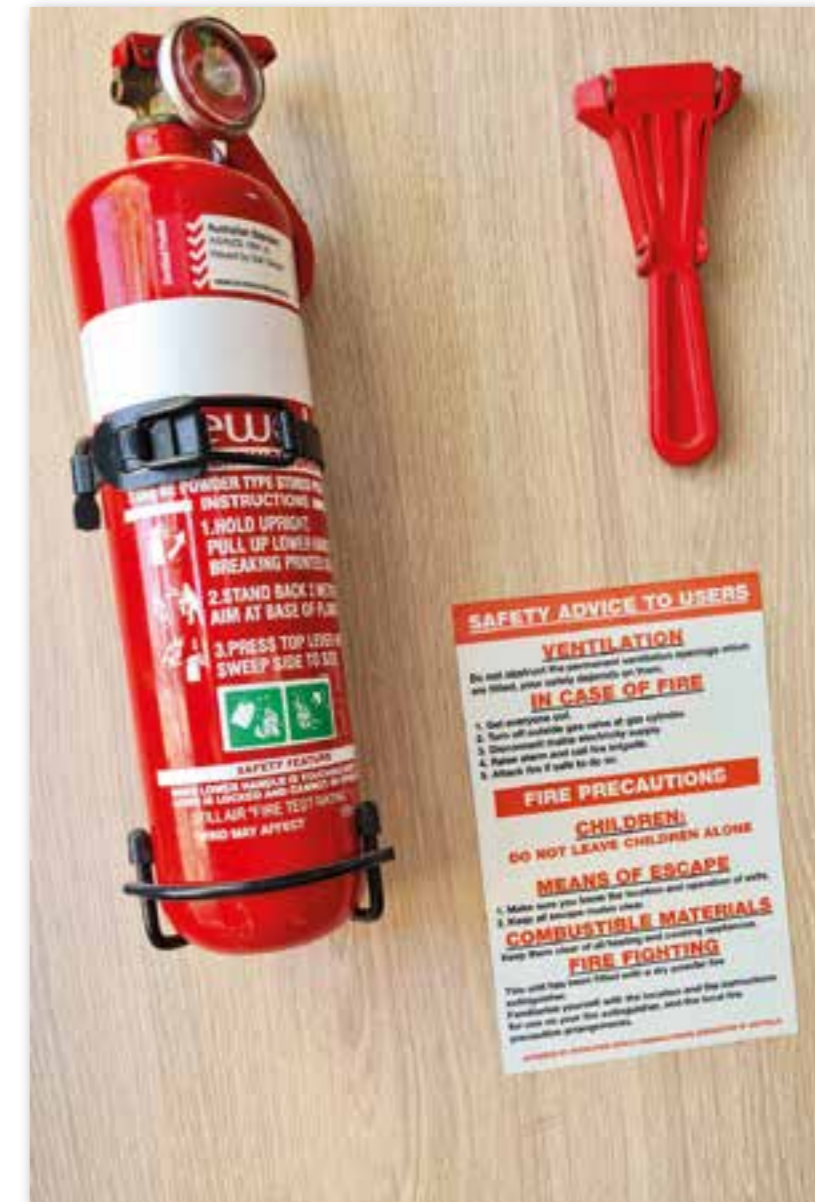
Tor H 114

Jeg vet at noen verksteder har godtatt kundekontrollert brannslukningsapparat.