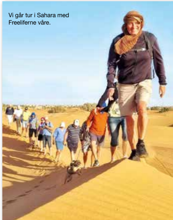
Vi går tur i Sahara med Freeliferne våre.