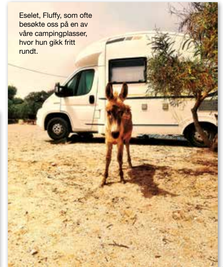
Eselet, Fluffy, som ofte besøkte oss på en av våre campingplasser, hvor hun gikk fritt rundt.