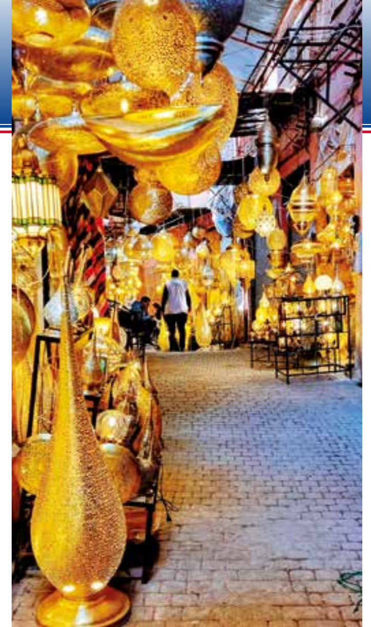
Vi opplever mange inntrykk i medinaer i flere byer.

autoritet i stram uniform står ved vinduet vårt og ber om papirene våre. Han går bort med dem uten å kommunisere mye. For ham er det hverdagen, for oss er det helt nytt. Vi vet ikke hvor han skal med passet og billettene våre, eller hvor lenge vi må vente i bobilen – eller om vi faktisk må vente akkurat her, der vi har trukket inn til siden.