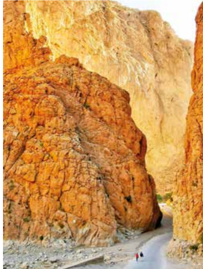
En av de mange flotte kløfte-rutene i Marokko.