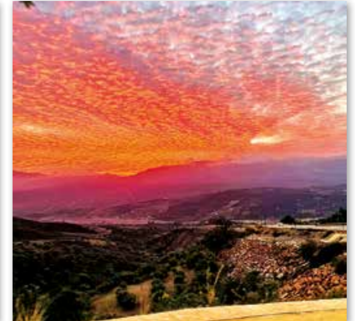
En aften man ikke glemmer!

Mange tanker har gått gjennom hodet vårt på forhånd. Ikke bare vårt eget. I det øyeblikket vi nevnte Marokko som et reisemål for venner og familie, fikk vi en del bekymringer tilbake. Bekymringer som nå sakte begynner å smitte av på våre egne tanker.