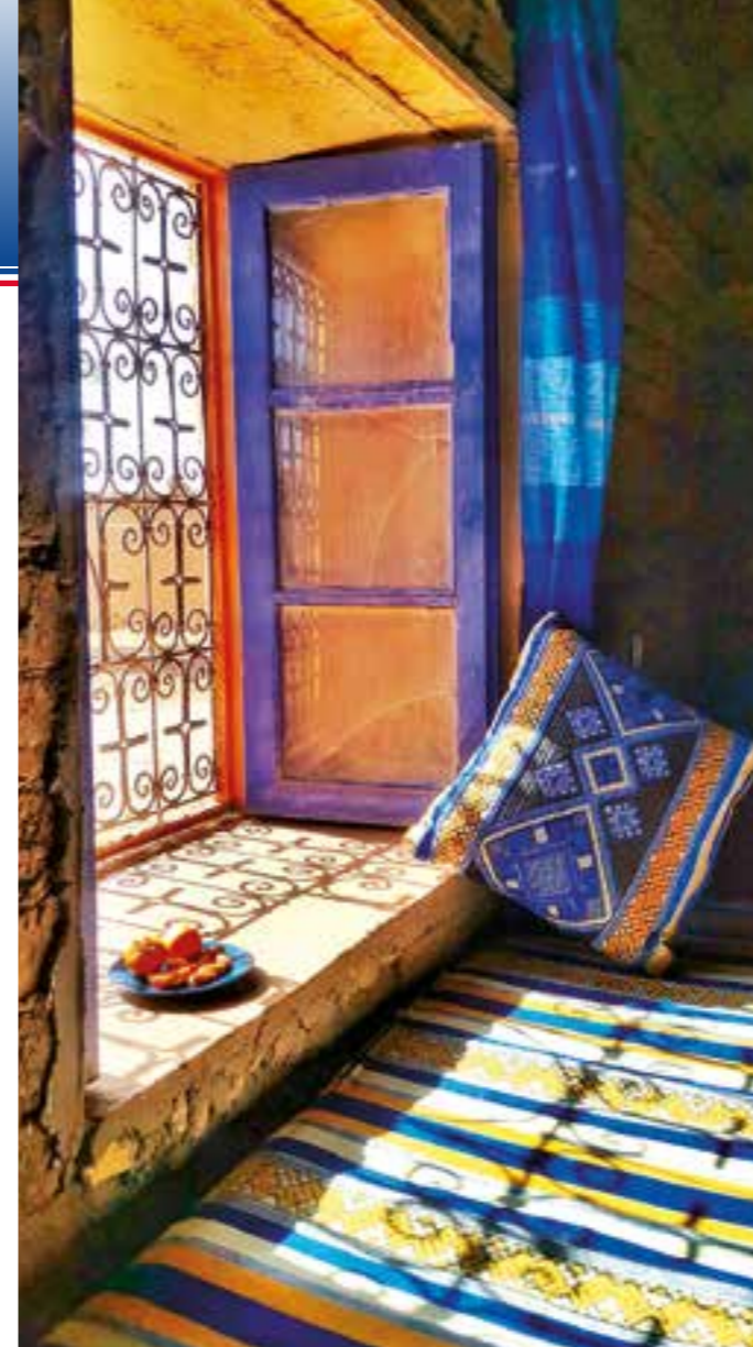
Et stille øyeblikk kan finnes så mange fine steder i dette gamle landet.