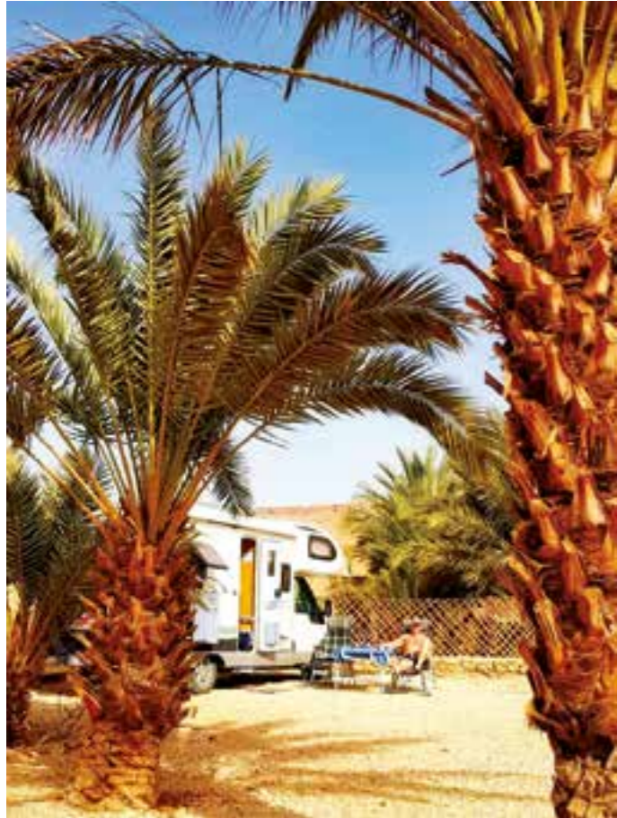
Freelifer ankommet til campingplass i solen i Marokko.