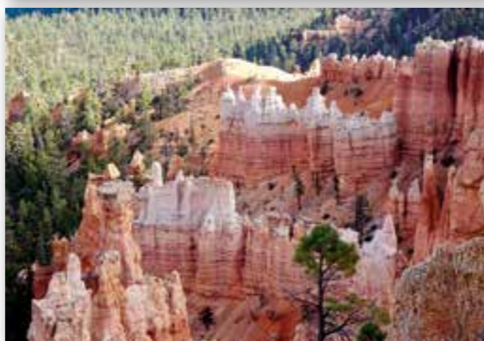
Bryce Canyon National Park.

Det har aldri vært i mine tanker å dra dit, men nå var vi her i Redwood Forest. Trærne var så store at vi ble svimmel av å se til toppen. Vi kjørte en del på småveier i skogen, og campet der det passet oss.