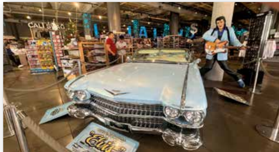
I Hollywood møtte vi selvsagt Elvis.