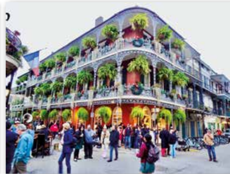
Burbon Street i New Orelans.