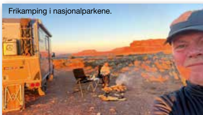
Frikamping i nasjonalparkene.