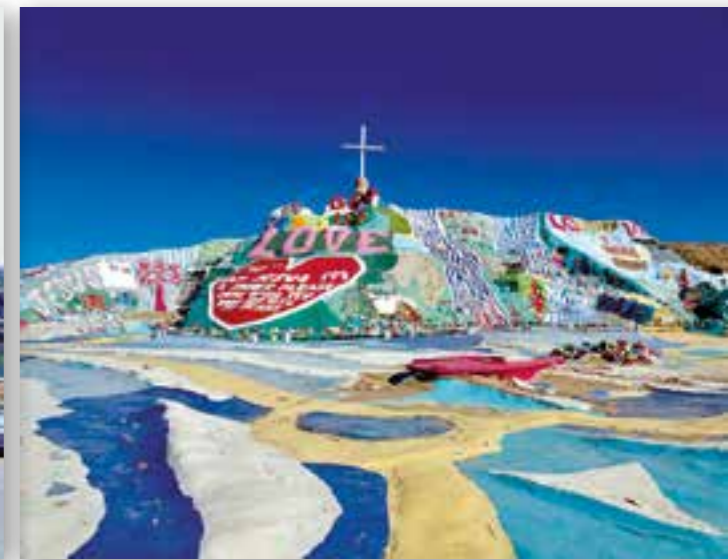
Salvation Mountain i Slab City. Bygget på siden 1948.