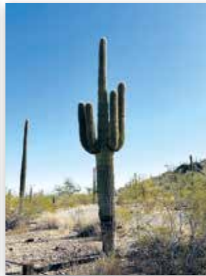
Arizona, typisk i landskapet.