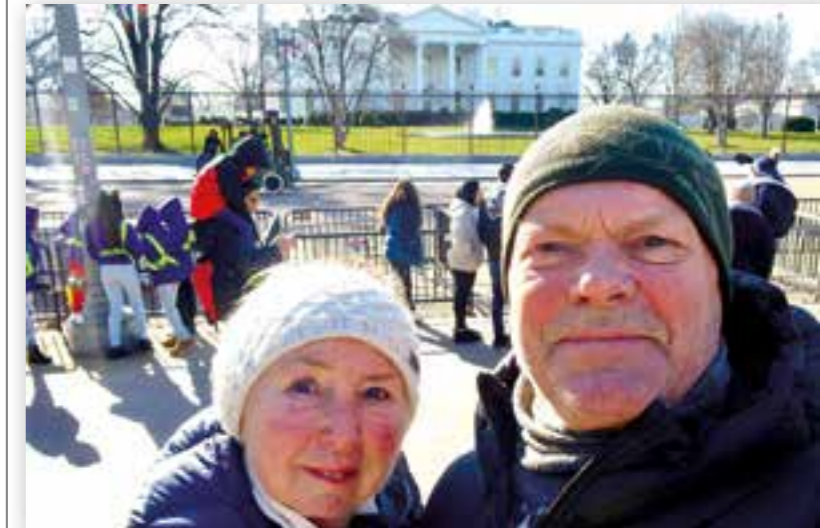
Kjørte med egen bil til Det Hvite Hus. Ingen hjemme.