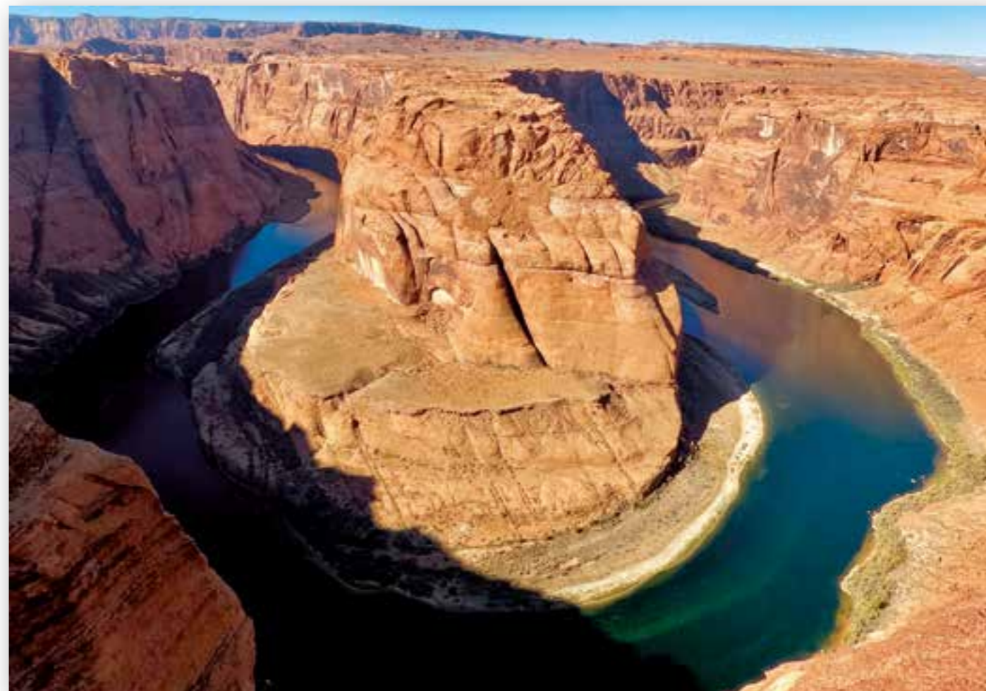
Horseshoe bend. Inngangen til Grand Canyon.

Like nord for San Fransisco tok vi inn i landet. Her kjørte vi gjennom vinmarkene i Falcon Crest. Nå fikk vi anledning til å overnatte på en av disse farmene. De hadde ikke lov til å selge vin, men vi kunne få en og gi noen donasjoner. Den lokale «Angela Channing» var kinesisk og de drev en vakker vingård.