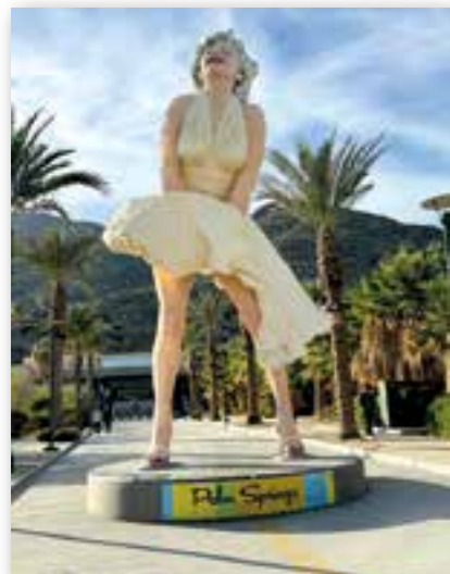
Palm Springs og Marilyn Monroe.