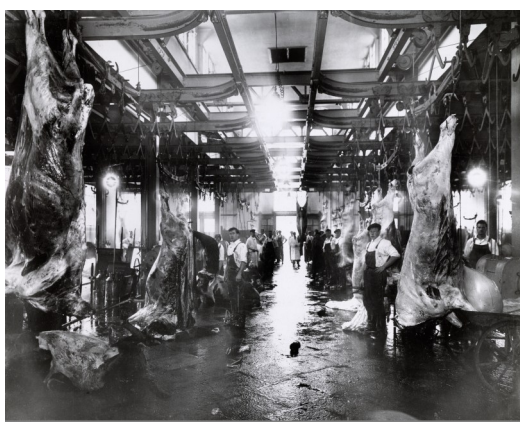
Oslo Slaktehus ca. 1937.

Det sto ferdig i 1914 og var tegnet av arkitekt Einar Smith. Anlegget ved bredden av Akerselva skulle erstatte de mange private slaktehusene rundt om i Kristiania, og ble bygd ved siden av Gartnerhallen. Mot Grønlands torg hadde det torghall og kjølehus. Opprinnelig lå den offentlige kjøttkontrollen på Ankertorget, men ble overført hit da slaktehuset sto ferdig.