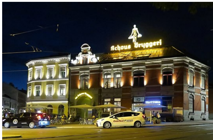
Ruth Reeses plass en sommerkveld.

Ved å omtale en plass i dette området så er vi helt i ytterkant av det vi har definert som EGT-området. Vi ber gjerne om tilgivelse i stedet for tillatelse denne gangen. Plassen foran