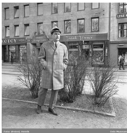
Frank Varner, elegant kledd.

Frank Varner var en norsk forretningsmann, som blant annet er kjent som grunnlegger av kleskjeden Dressmann. Han spilte en pionerrolle i moderniseringen av klesomsetningen i Norge. Åpnet sin første butikk på Grünerløkka i 1965. Butikken het Frank Varner og det var kapital fra morens dagligvarebutikk i Schübelers gate som la grunnlaget for etableringen.