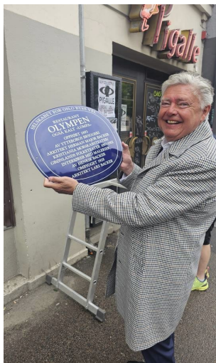
Montering av Blått skilt på «Lompa».

Det kommer stadig nye «Blått skilt fra Oslo Byes Vel. Den oppdaterte listen for hele Oslo by finnes på : https://www.oslobyesvel.no/blaa-skilt-i-oslo . Oppdatert liste for hele EGT-området finnes på historielaget web-sider: https://egt-historielag.no/BlåskiltNY/ . Totalt inneholder listen for EGT-området 29 skilt. Ta en runde og oppsøk alle skiltene i vårt område