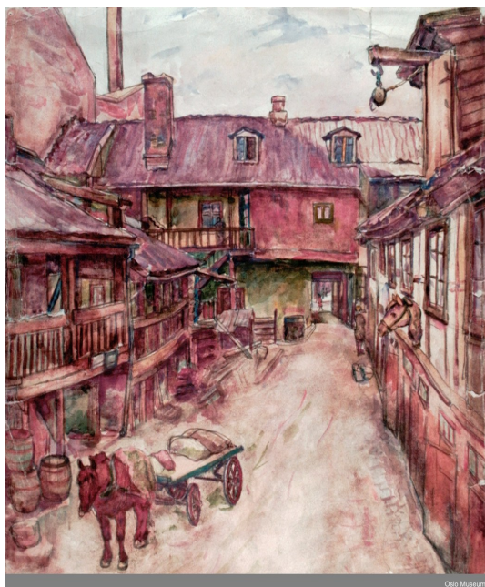
Vaterland Brugata 6 (akvarell) Birger Eugen Harm.