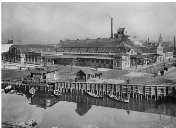
Oslo slaktehus med Kjøttshallen på Grønland ca. 1915.

Kristiania slaktehus med Kjøttshallen lå i Schweigaards gate 2, og ble bygd i begynnelsen av forrige århundre som et flott jugendanlegg der Galleri Oslo står i dag.