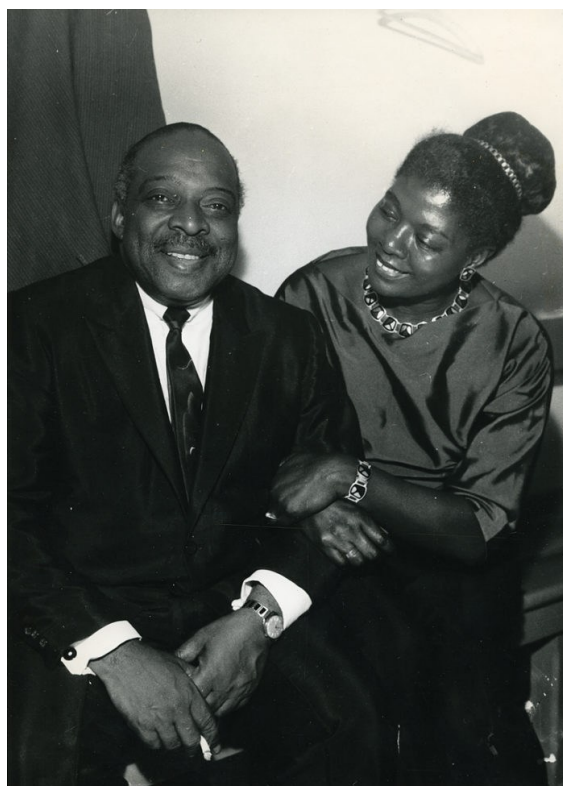
Ruth Reese sammen med Count Basie i Oslo.

Kilder: Store norske Leksikon , Wikipedia , Ruth Reese: «Min vei» .