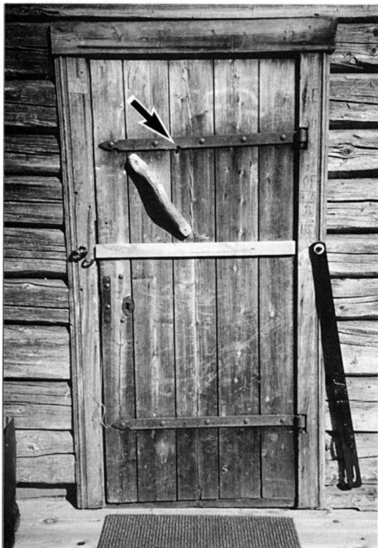
Budøra med kulehullet.

Sommeren 1943 var min far og jeg på tur i Brungmarka.