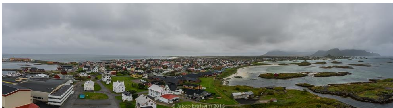
Panorama over Andenes fra toppen av fyret. Tatt under foreningens tur i september 2015.