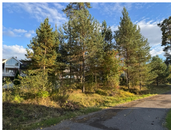
Bilde 3 og 4, gangveien til skolen, vest for Skogmorabben.