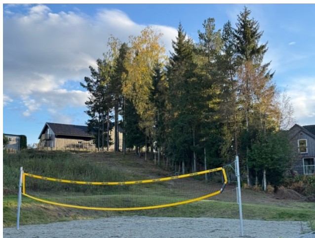
Bilde 1 og 2: Fra gangveien ved fotballbanen opp mot Skogmotoppen 4-16.