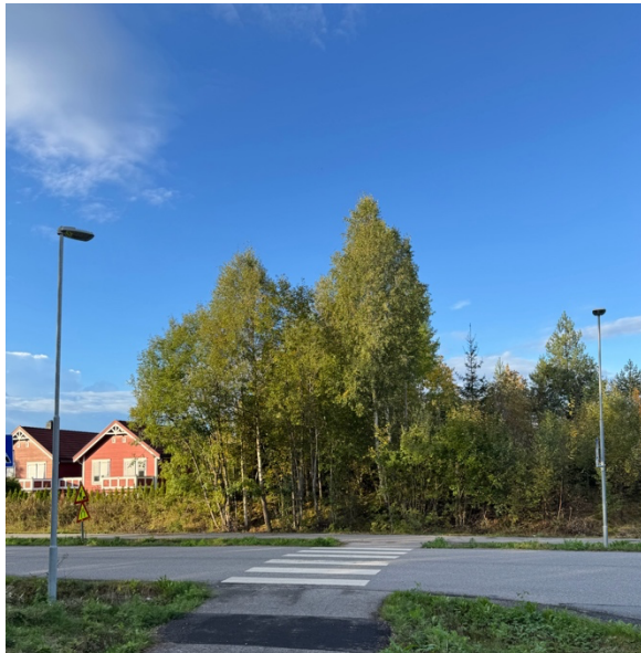
Prioritet D – Nissetoppen ved innkjøring til Kongletoppen

Knausen med skog ved innkjøringen til Kongletoppen. Her er det helt gjengrodd ned mot gangveien. Det skal tynnes skog og fjernes kratt.