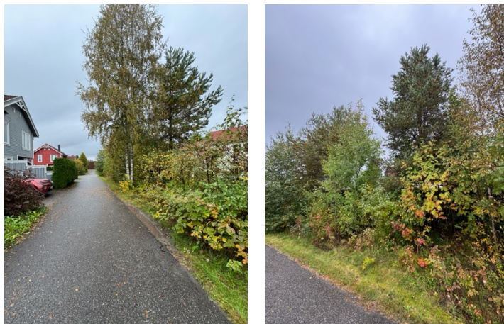
Prioritet E – Nissetoppen / Blåbærtråkket

Gjengrodd skogsområde med mye tynn småvekst. Må ryddes i busker og kratt samt tynne ut noen større trær.