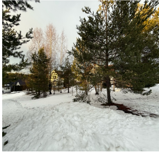
Bilde 5 og 6, Skogmotoppen.