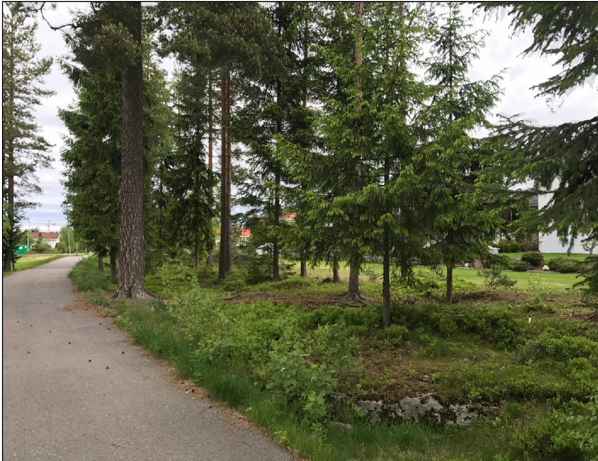
Eksempel på “pleid skog” fra grøntområdet ved gangveien mellom Tyttebærlia og Skogmorabben

Vi ønsker at skogholtene skal være av type “pleid skog” og eksempel kan sees i grøntområdet ved gangveien lengst sør mellom Tyttebærlia og Skogmorabben. Her er det luftig og trærne har forskjellig størrelse og skogbunnen kommer frem.