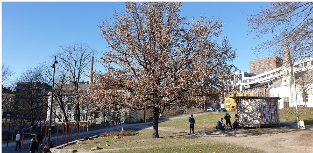
Kongeeika i vinterdrakt. Ved Elgsletta/Elgparken mellom Nybrua og Hausmanns bru.