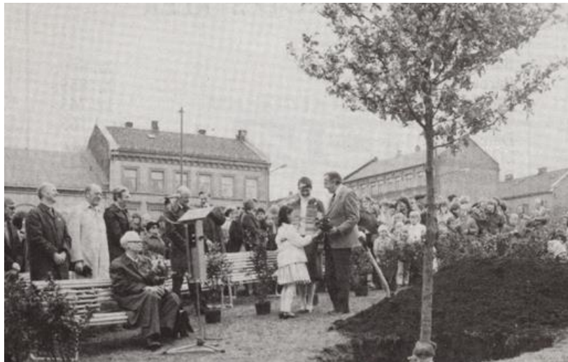
Planting av Kongeeika. 19. april 1983 på Elgsletta.

plantet en eik de kalte Kongeeika i et område ved Hausmanns bru. Ingen av oss hadde hørt eller sett noe om dette. Intens googling og søk på nettsidene til Nasjonalbiblioteket etter mannen ga ikke noe resultat. Det skulle vise seg at Grønlandsposten hadde brukt feil etternavn. Men når man ingen ting finner på nettet oppsøker man simpelthen stedet som vi fant ut måtte være i nærheten av Elgsletta eller Elgparken som den også kalles. Og der fant jeg den, godt synlig om du rusler gangveien sydover langs Akerselva. Vakker og frodig sto eiketreet der alene 40 år senere, men uten noen henvisning til