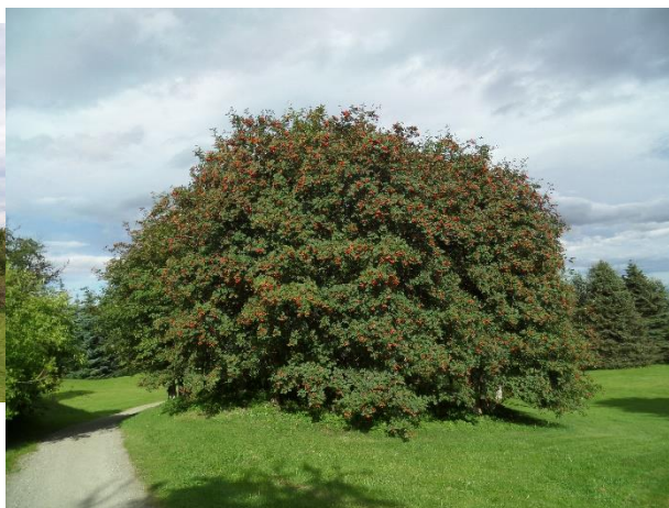
Over fagerrogn i vårblostring (mai 2019) og til høyre i høstskrud med frukter (september 2017), begge på Kongehaugen i Ringve botaniske hage.

I årsmeldingen for 1984 for NTNU/Ringve botaniske hage fortelles det om ytterligere donasjoner til arboretet. I heftet Årsmeldinger 1987-1992 for Botanisk avdeling ved Ringve botaniske hage står det for 1988: «Kongelunden: 1982 fikk Ringve botaniske hage en pengegave på kr 4.000 fra Harald Bardahl med ønske om at det skulle plantes en "Kongelund" på Ringve. I 1983 ble det skaffet tilveie frø av Sorbus meinichii (fagerrogn) fra Leka og fra Bergens botaniske hage, av et eksemplar opprinnelig hentet på Bømlø. Våren 1988 ble den gamle låvebrua på Ringve omformet til "Kongehaug" og ca. 70 trær av fagerrogn utplantet.». Kongelunden eksisterer den dag i dag, fagerrognen er blitt kjempestor og Harald Bardahl har fått en plakett satt opp etter seg som takk.