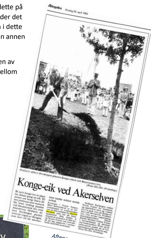
Aftenposten 20/4 1983.