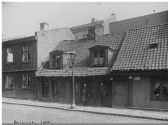
Venstre bilde: Urtegata nr. 16, til venstre og nr. 18 til høyre. Trolig 1920-tallet. Høyre bilde: Norbygata 22, 24 og 26 (fra venstre), ca. 1908.