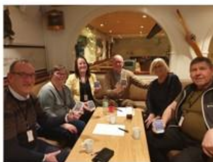
Fjorårets glade vinnere!