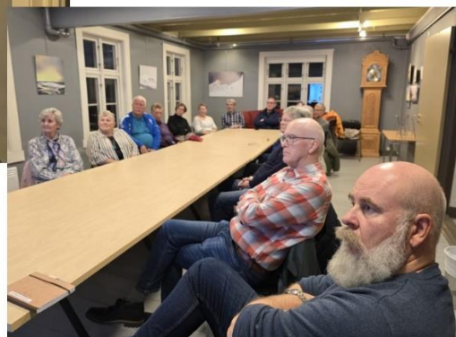
Engasjert forsamling