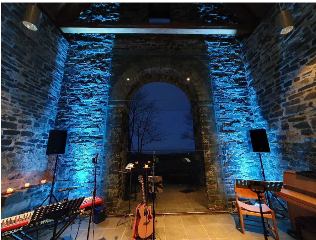
Sola ruinkirke

Luftforsvarets base Sola ønsker oss velkommen til å delta på adventsstunden i Sola Ruinkirke onsdag 11. desember kl. 0815 – 0090.