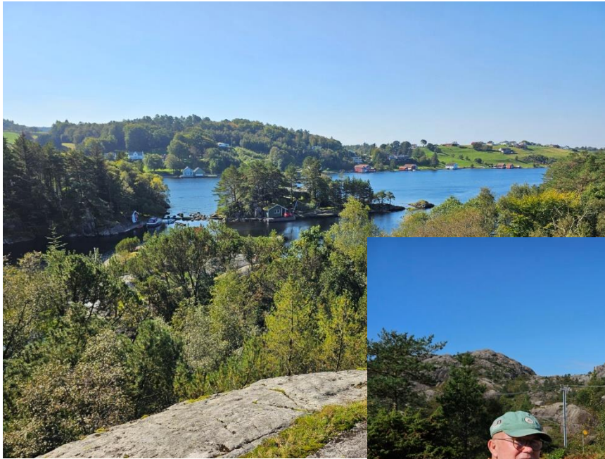
Flotte omgivelser