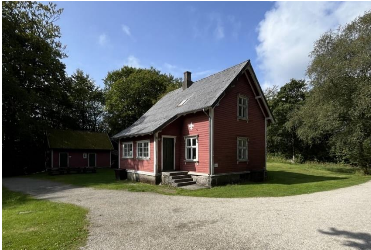
Maurholen stasjon

Fortsatt i sommertøy, gikk en liten glad gjeng på en avslappende tur langs den gamle jernbanen til Egersund.