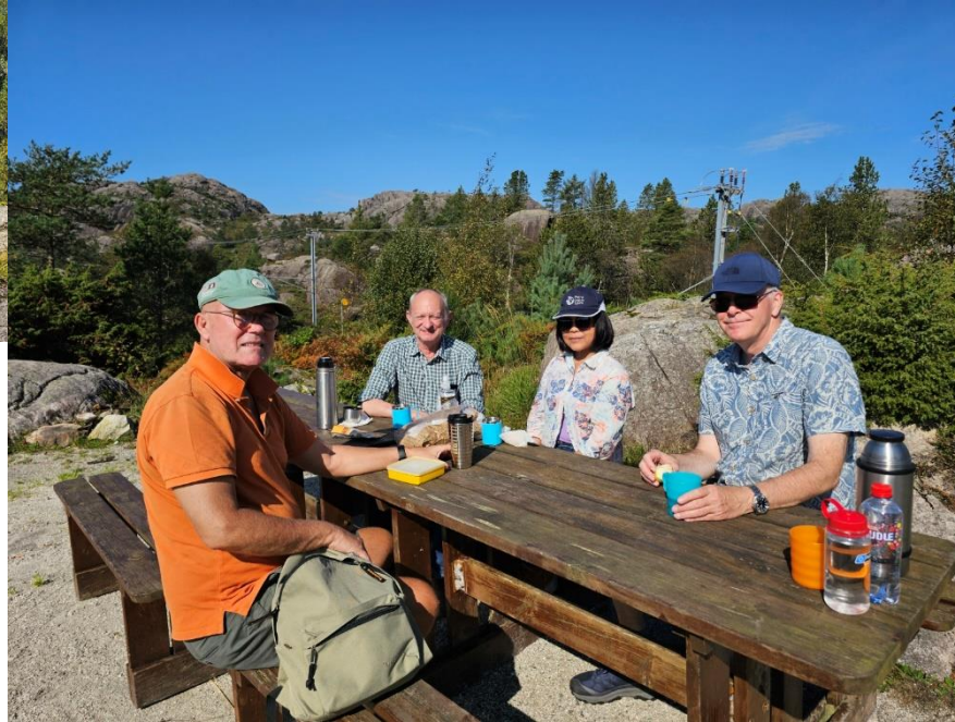
Dags med lunsj før returen