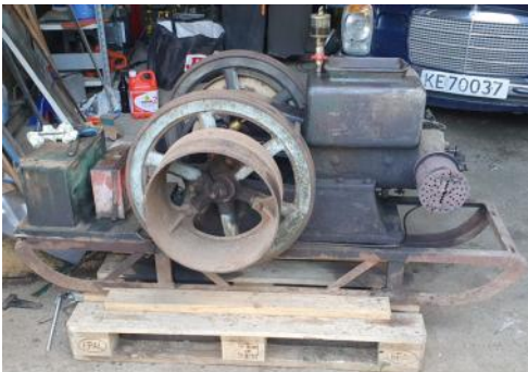
Øveråsen-motoren sto på verksted, stille og innesluttet