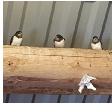
Låvesvalene fulgte oppmerksomt med