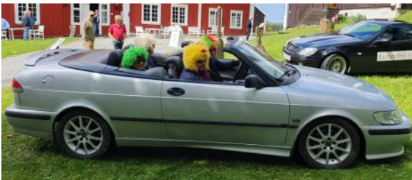
Noen hadde pyntet seg litt ekstra

Løypa fortsatte ned Soknedalsveien, over Bybrua og tok en sving innom Asbjørnsens gate der vi skulle finne ut hvilke bilmerker som forhandles der. Det er ganske mange, viste det seg. Turen fortsatte til NAFs øvingsbane på Eggemoen. Det var ikke kjøring på banen i år, men vi skulle konkurrere om å kaste en snor med en kule i hver ende og få den til å tvinne seg rundt en stang. Dette var ganske vanskelig, men mange var svært treffsikre. Andre del av konkurransen gikk ut på å få tre sandposer til å treffe noen ganske små hull. Ikke så enkelt det heller.