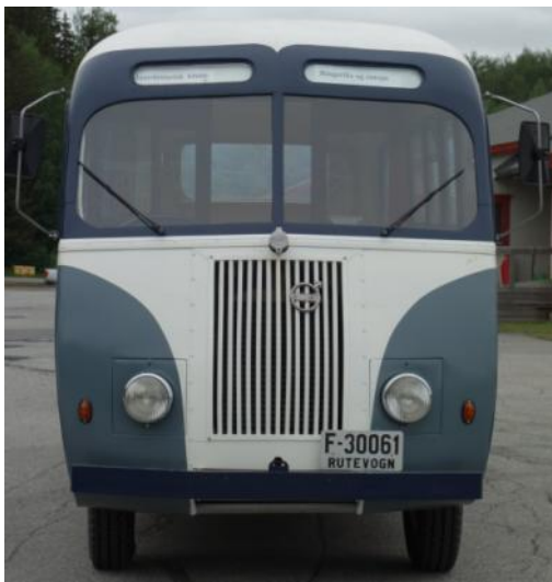
Klar for neste sesong