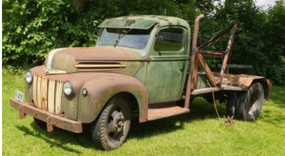
Museets favoritt: Dag Rasmussens patinerte Ford kranbil

Der var grillen fyrt opp, og flere benyttet anledningen til å grille medbragt mat. Etter en regnskur før start hadde det vært bra vær under hele løpet, men samtidig med premieutdelingen kom det en ny regnskur, så folk søkte tilflukt under trær og paraplyer.