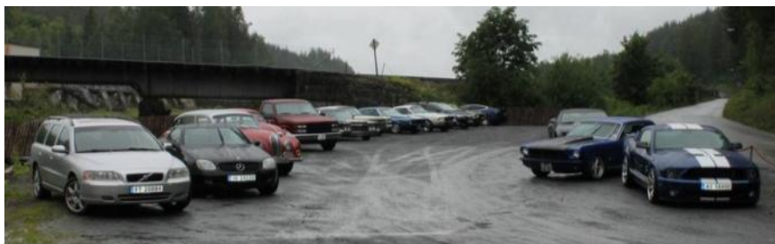
Etter målgang ved Hen mølle

Ferden gikk videre på Gamle Ådalsvei, og de som hadde glemt eller ikke hadde opplevd hvordan veien oppover mot Nes så ut i gamle dager, trodde nok de hadde kjørt seg bort på en gjengrodd sti, før de med et lettelsens sukk kunne svinge ut på E16 igjen. Derfra var det «straka vægen» forbi metropolen Pålebyen og sentrum Hen og til Mølla, som var endepunktet.