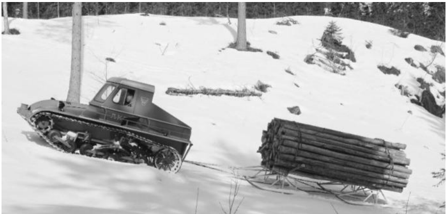
Snow-Trac i skogbruket.

I Norge ble Snow-Trac forhandlet av Alfa-laval som markedsførte den som "ødemarkens folkevogn" fra slutten på 1950-tallet. Den første ble solgt til vertskapet på lungsdalen Turisthytte i 1957 til en pris av kr 32 000, mer enn to nye VW-bobler. De norske kundene var de samme som andre steder: Kraft- og teleselskaper, fjellstuer, skisentere, rutebilselskaper og sikkert noen eiere av fjellgårder og andre som drev næringsvirksomhet i snørike områder. Flere vogner ble solgt til Svalbard, og en Snow-Trac ble kjørt til toppen av Galdhøpiggen i 20. april 1962. Det finnes en film fra denne turen på Youtube. Den store andelen standarddele er en av årsakene til at forholdsvis mange Snow-Trac fortsatt er i drift.