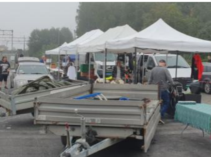
Selgerne rigger til i morgentåka