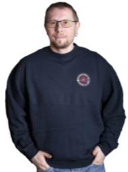
Genser 250,- Mørk blå eller grå