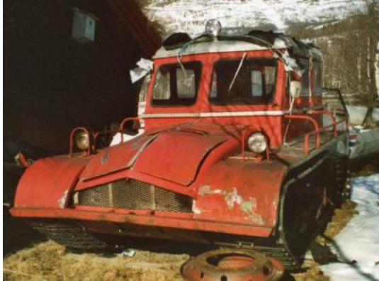
Februar 2003

I 2003 kjøpte han en Snow-Trac ST4 1959-modell i Vang i Valdres. Beltevogna var hel og komplett, men det var behov for full restaurering. Vogna ble fraktet på henger til Oslo der han og samboer Sigrun bodde på den tiden, og