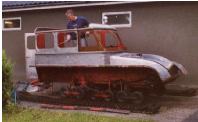
Malingsfjerning sommeren 2003