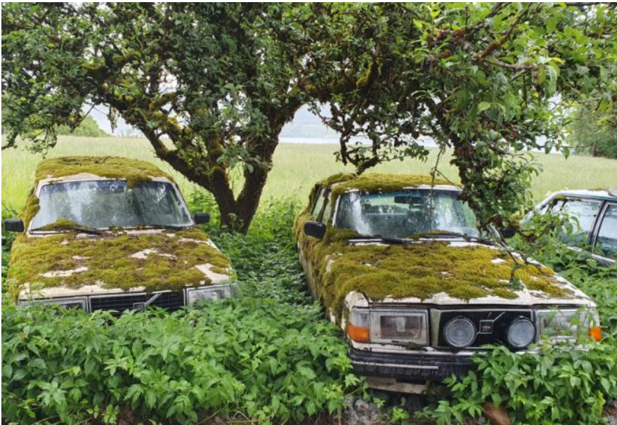
Langtidsparkerte Volvo 240

Motorhistorisk klubb Ringerike og omegn Postboks 1019 3503 Hønefoss