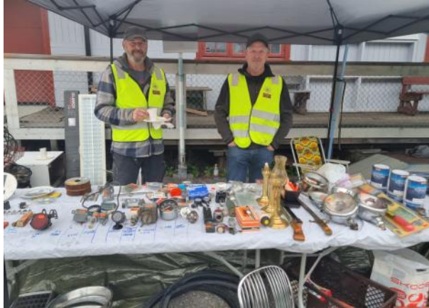
Brødrene Rasmussen på Senterets salgsstand

Årets marked ble arrangert lørdag 7. september. De første selgerne var på plass allerede fredag kveld, og flere sto klare da vi åpnet portene tidlig lørdag morgen. De ivrigste kundene var også tidlig på plass. Værmeldingen lovet bra, men et lavt skydekke gjorde at det var litt småkaldt fra morgenen, noe som kanskje gjorde at det