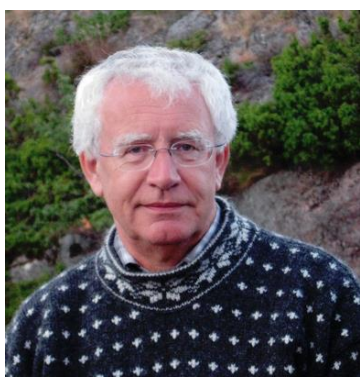
Ketichover - Gvildendal Norsk Forlag

I 1825 startet masseutvandringen til Amerika. Over 800 000 forlot Norge. En del kom tilbake, men de fleste ble i USA.