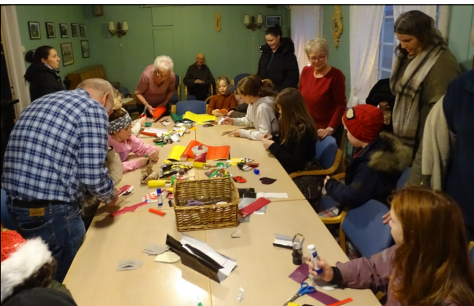
Å lage julekurv trenger tålmodighet, men barna synes det var moro å prøve, godt hjulpet av HGV!

Lokalbidraget. Takk til alle som støttet oss i forbindelse med årets Lokalbidraget. Vi fikk inn kr 31 933,-. Dette skal brukes til innkjøp av to benker som kan stå ute hele året.