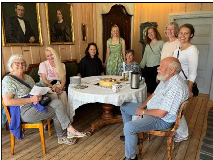
Siste DKS-dag ble som før om årene avsluttet med marsipan-kake.

Den kulturelle skolesekken, trinn 2 I løpet av åtte dager rett etter skolestart kom nesten 700 elever til Huseby for å oppleve en dag på Fattiggården Huseby. I alt 12 frivillige fra Huseby gårds venner og Skedsmo historielag bidro i år som formidlere. Dette er blitt et populært kulturarvtilbud der elevene får oppleve hvordan det var å bo og arbeide på gården for ca 100 år siden.