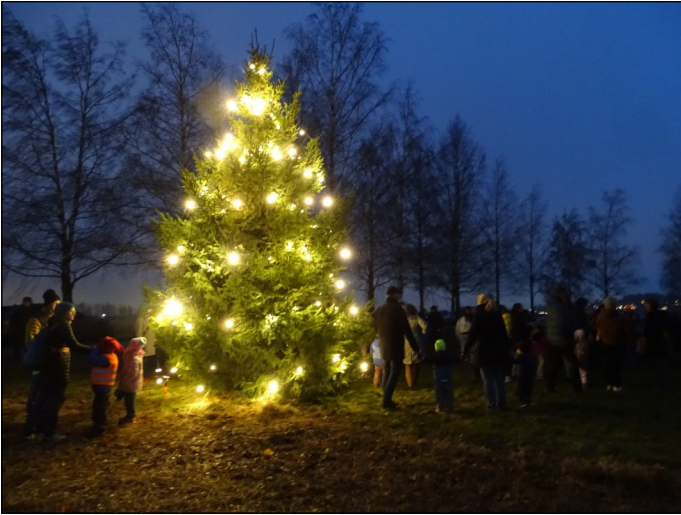
Gang rundt juletre etter tenningen var populært.