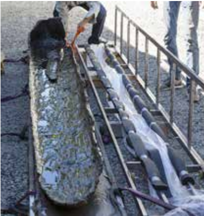
Klar for å løftes på den polstrede støtte-jigggen.

En plastfolie ble forsiktig trukket under båten og rullet opp sånn at alle fikk tak. Deretter ble stokkbåten forsiktig løftet over til jigggen som på forhånd var polstret med myk-gummi. Da båten var på plass fikk jigggen påsatt sin andre side og diverse tverrstag. Stokkbåten ble så støttet opp rundt det hele med isoporstykker og gjort klar for bæring inn i den ventende frysecontaineren, som på forhånd var kald. Her ble jigg og båt ytterligere preparert, før ekvipasjen ble surret inn i plastfolie.