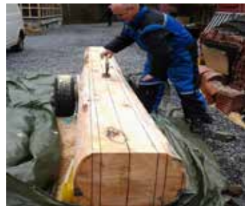
Horgen har fått av barken og er i gang.