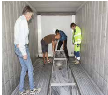
Støtte-jigggen med plastret stokkbåt på plass i frysecontaineren.26.6.14

Torsdag den 26 juni hadde båten ligget dypfrost i 2 døgn og var mulig å håndtere for måltaking m.m.. For at det skulle vær mulig å lage en tro kopi, tok vi da en papplate, og klipte til en innvendig profil av båten på angitt sted. Vi tok ellers bekreftende mål. Før båten hele ble svøpt inn i plastfolie og jigggen stemplet av for å tåle transporten til SVK. Under emballeringen, var en så uheldig å miste det store avrevne båtside-stykket i gulvet så det gikk i 3 deler. Vi håper å få dette på plass igjen før visningen i Kolben.