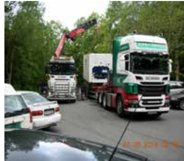
Frysecontaineren lastes over på fraktvogna for videre transport.

Denne prosessen var tidkrevende. Da frysecontaineren etter om lag en time endelig var på plass på fraktbilen, viste det seg at det diesel-aggregatet som skulle mate frysecontaineren med strøm, ikke lot seg kople til. Enda en time gikk med til leting og telefonkommunikasjon før en riktig kontakt som passet den medfølgende kabel ble funnet og diesel-aggregatet kunne starte opp. Det gjorde det, men ga fra seg utrolig med støy og eksos.