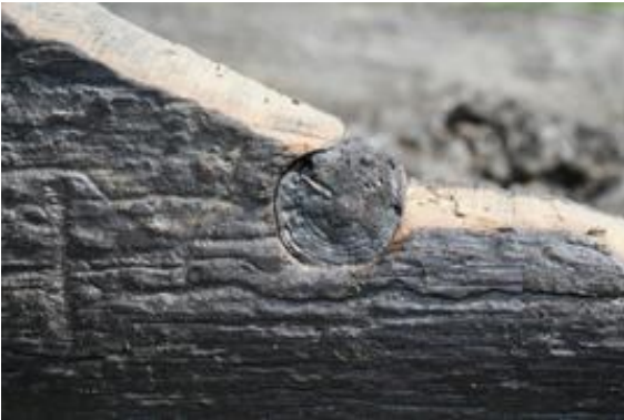
Foto til venstre: Detalj av stokkbåtsiden umiddelbart etter opptak med daværende innsatte tre plugg med omkringværende treverk

Flytting til annet lokale og den videre vaske- og konserverings-prosess. Stokkbåtens opphold og skylleprosess på brannstasjonen skulle vare i 1,5 år. Da brannstasjonen skulle selges måtte stokkbåten flyttes. Den ble hentet ut i sitt kar med kranbil 03.11.2010.