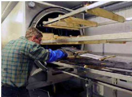
Bilde. NMMs frysetørkingsanlegg beregnet på deler fra Barkode-Båtene i Bjørvika.