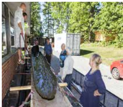
Alle klare til innsats da stige med båt skal bæres videre.