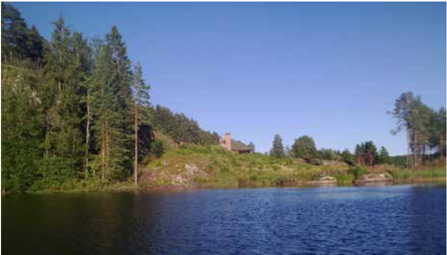
Bilde: Flåtestadvika.

Turen med stopp ned til Flåtestad-området ved Julekvelden beregnes til en time.