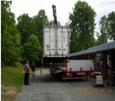
Frysecontaineren hentes av kranbil på FM.

forhold og trær, måtte fraktingen av frysecontaineren skje i 2 etapper. Først måtte en kranbil hente containeren som var plassert på plassen utenfor administrasjonsbygget. Så buksere denne forsiktig opp på en flat henger til parkeringsplassen der den store trekkvognen med tilhenger ventet. Deretter ble containeren løftet over på transportbilens tilhenger. (Se tre bilder under av Bjørn G. Lunder).