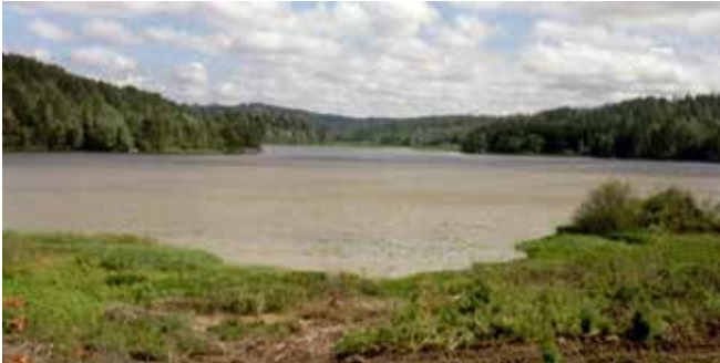
Skysstrassen sett fra Kurudsiden. Foto: BGL.

Etappe 3. Kl.11.30 -11.45. Skyss av deltakerne over til Kurud. (ca. 320 m) i en større båt med påhengsmotor og sjåfør. Egnet ferge for ca. 12-15 personer. Regner med 2 eller 3 turer avhengig av deltakerantall og hva vi ellers får tak i av egnede båt-materiell. Vi bør ha med oss speiderne og/eller brannvesenet, for å ta vare på sikkerheten å stille med vester under overfarten. Går det som vi håper, for vi også ordnet med en Sundflåte til beskuelse.