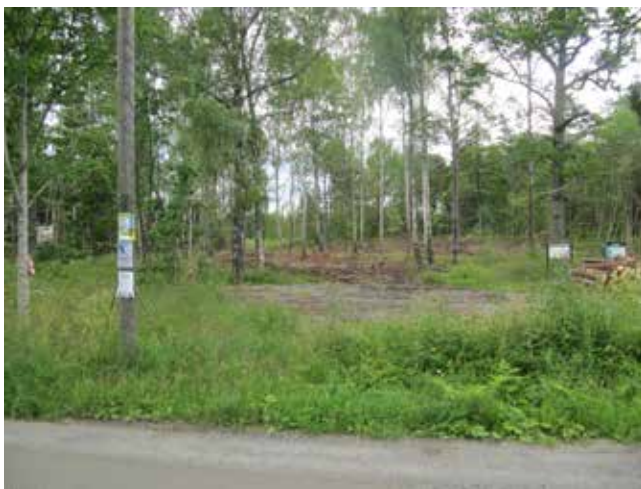
Hogst ved Solheim. Bildet tatt nordover fra Bekkenstenveien.

Et par saker av litt annerledes art har vi nettopp hatt på Svartskog. Vi ble kjent med at det foregikk hogst i skogen nord for Solheim, og lenger nord rundt Oldtidsveien (mellom Torbjørnsrud og Bjørnsrud), uten at vi visste om det på forhånd. Her har vi jo kulturminneinteresser i forhold til bevaring av Oldtidsveitraseen. Vi var altså ikke formelt varslet, eller invitert til de befaringsene som hadde