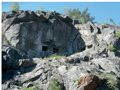
Brogalleriet ved Fossum bro