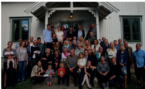
Deltakerne på slektsstevnet på Solheim 24.6.17.