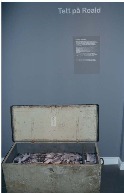
Kisten fra Uranienborg