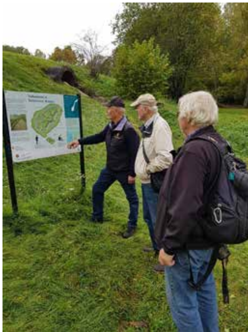
Informasjonstavlen ved Seiersten festning.

Informasjonen om anleggene er hentet fra: Forsvarsbygg.no.