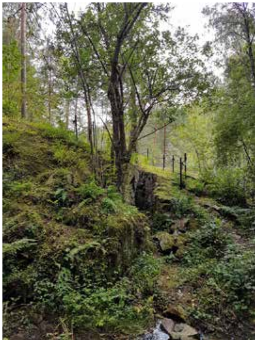
Utsprengt tilførselsgrøft til Skytestillingen.

Det er ikke spor etter noen form for innkvartering av vaktmannskaper ved minnet. Det sies at det har stått en liten vakthytte noen 10-metere ovenfor, men den har ikke vært stor nok for et helt vaktmannskap. Imidlertid – tyskerne tok som kjent kontroll over bebyggelsen på Gjersjøen sommercamp en kilometer lenger øst, i nærheten av sletta for Ingierkollen slalåmbakke. Dette området hadde tidligere vært innmark for gården Vassbonn. Her kunne mannskapene hvile mellom øktene.