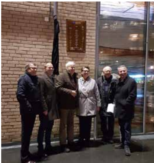
Bumerket er avduket.