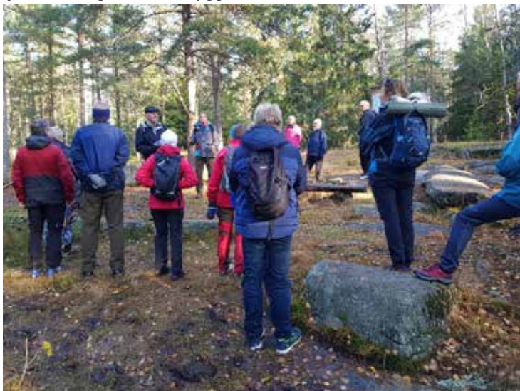
Turgruppen ved Kongebordet.

Langs veien nordover fikk vi info ved Kongebordet. Ved krysset med veien østover mot Myhrer kunne vi se det som trolig er tufter etter en plass eller lignende. Også stiskillene ved Tårnåsen, som markerer antatt midlertidig trase for Kongeveien på 16-1700-tallet. Mye tyder på at veitraseen syd for Grønliåsen ble utbedret til kjøring med hjul, før Kongeveien ble bygget senere.