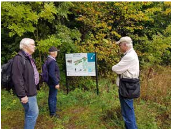
Informasjonstavle på Heer skanse. En kommer lettest til stedet ved å gå fra Heer skole.

Omviseren var på plass på Heer skole, som var utgangspunkt for turen, så vi besluttet å gjennomføre turen uansett fremmøte. Det blir jo selvfølgelig veldig bra for de få deltakerne når vi får omviseren så tett på oss. Det gir jo en god anledning til å stille spørsmål og få en god dialog.