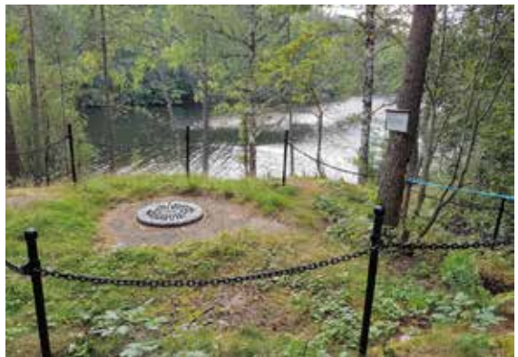
Skytestillingen ved Gjersjø bru.

Krigsminnet har ligget der, ubeskyttet i alle de ca. 70 årene som er gått etter krigen. Så vidt vitnes har det ikke vært uhell/ulykker på stedet. For et par-tre år siden klaget imidlertid noen foreldre, som var på badetur med barna i strandsonen rett nedenfor stillingen, på risikoen for ufrivillig fall ned i den åpne kummen. Kommunen svarte med å sveise fast et kumlokk på toppen av Skytestillingen, og dermed hindre uhell.