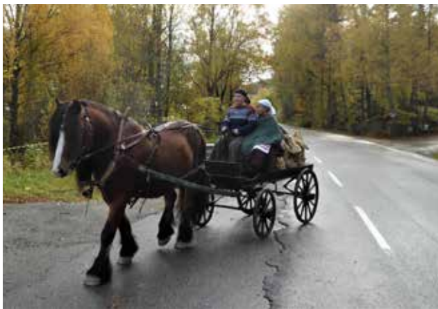
Hestetransporten ankommer Tyrigrava.

Tilstelningen ved avdukingen, var – som nevnt - initiert av entusiastene vedrørende