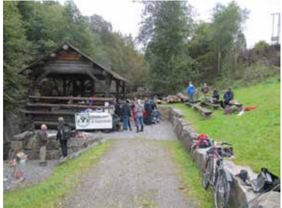
Oppegård Jeger- og Fiskeforening har arrangement ved oppgangssaga.