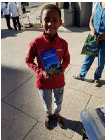
Vinneren av historielagets quiz

Premien var en Løvland familiens bøker om Follomarka, og den falt i smak. Det ble en fin kveld ute i skogen, været var fint og det var god temperatur. Selv om det er mye som blir likt fra år til år på dette arrangementet, ser det ut som om det faller i smak blant kommunens innbyggere. Det kommer flere familier fra nabo kommunene også så her er det noe som fenger.