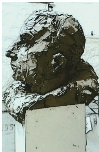
Bysten ferdig modellert

Prosjektet retter derfor en STOR takk til alle sine Sponsorer for støtten. Det var deres positive respons som muliggjorde dette "hårete" OHL-prosjektet.