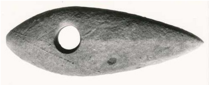
Skaftulløks av stein, sannsynligvis en stridsøks fra yngre steinalder. Funnet på Sætre.

Navnet Sætre er et svært gammelt navn, og kan oversettes med å sette bo. Sætre-gården lå gunstig til ved sydenden av Gjersjøen, og rett ved oldtidsveien som gikk nord/syd; mot Oslo i nord og mot sør Østfold. Denne veien er flere tusen år gammel, og kan godt omtales som vår første Europavei. Sætre-gården lå gunstig til i forhold til trafikken på denne veien, og med skrånende, vestvendt terreng var jordene selvdrenerende, lett-dreven mark for kornbonden der.