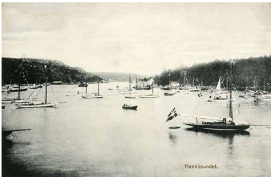
Hankøsundet i 1906.

Disse opplysninger hadde ikke vi passasjerer den gang, men kapteinen ombord visste nok noe, eller var det sjømannen som ante noe etter at bølgene begynte å tilta ute ved Drøbak. Han kalte inn Tidemand-Fossum og de øvrige i ledelsen av turen til sin lugar, og foreslo av hensyn til passasjerene at ture sydover burde legges "innenskjærs" (slik som i annon-sen) og ikke som planlagt midtfjords til regattabanen og seilasene og deretter inn til Hankø fra syd. Takket være denne avgjørelse fikk vi noen "fredelige perioder" innimellom sling-ring og stamping mot de ganske store bølger som hadde bygget seg opp gjennom flere døgn blåst.