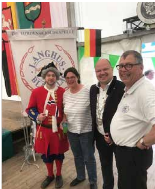
Tordenskjoldmaskott 2022 Bennett