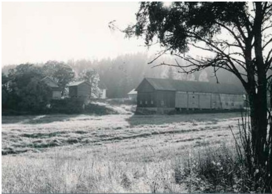
Kurud gård på 1960-tallet.

Gården Kurud er i dag et golfbaneanlegg. Rud-endelsen i navnet gir oss en pekepinn om at gården ble ryddet i middelalderen, trolig på omtrent samme tid som Gerdarud fikk sin første stavkirke, på 11-12-hundretallet, og altså i det katolske Norge. I forbindelse med etableringen av dette kirkestedet på Svartskog ble også den såkalte Kirkeveien ryddet. Den gikk via Sætre-gården og vestover, forbi Kurud og opp på Svartskogplataet hvor de eldste gårdene lå som en krans rundt den nye stavkirken. Det er denne enkle stavkirken vi møter hos Sigrid Undset i bøkene om Kristin Lavransdatter.