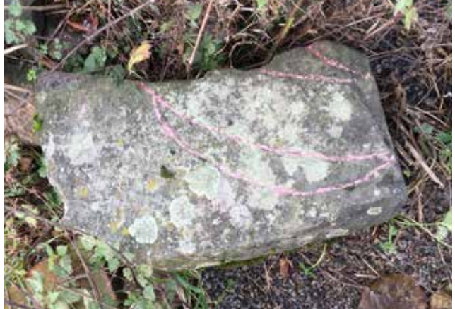
Strekene merket av med kritt på steinen