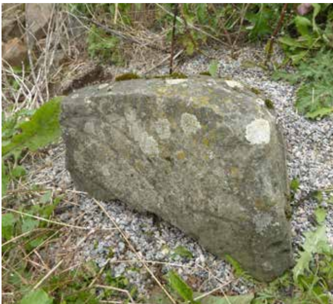
Er dette virkelig en skipshelleristning?

Begrepet skip er litt forvirrende, for det vi ser på de mange såkalte skipshelleristningene som er funnet, tilsier at begrepet båt nok er en mer dekkende betegnelse. Uansett; disse farkostene finnes i mange ulike former og fasonger, og er risset inn i bergflater eller på steiner for rundt 3000 år siden, i tiden vi kaller bronsealder. Riktignok finnes det helleristninger med båtliknende farkoster fra steinalderen, og mange av disse kan være skinntrukne kanoer.