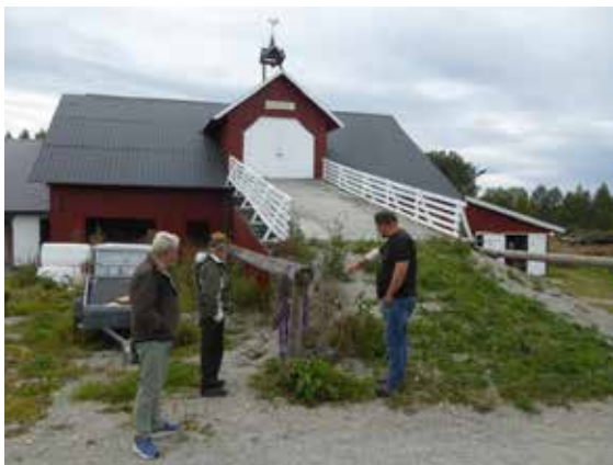
Befaring på Sjødal

Det har lenge vært kjent at en bruddstein ved låvebrua på Sjødal gård har et innriss som åpenbart er gjort av mennesker. Tidligere har det vært omtalt som en rune, men dette stemmer ikke. Når man tegner av risset med kritt ser man noe som i form ligner en banan. Ovenfor har det åpenbart vært en til, men steinen er brukket løs slik at bare øverste del av denne “bananen” er igjen.