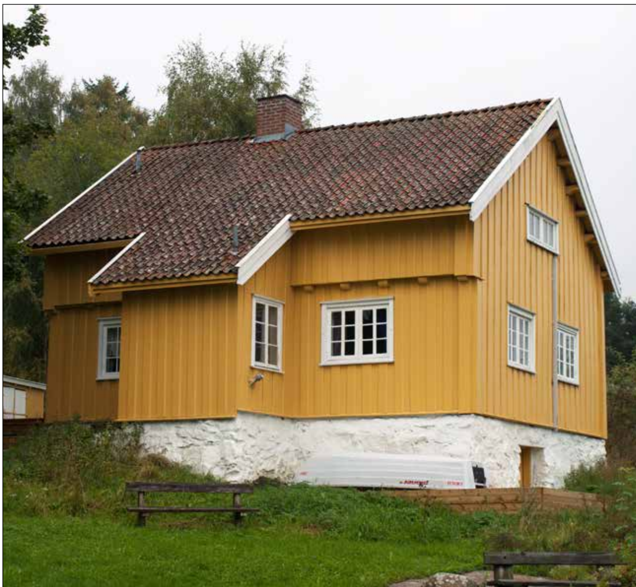
Bekkensten var Jørgen Stubberuds barndomshjem. Fra 2022 av er dette en DNT-hytte.