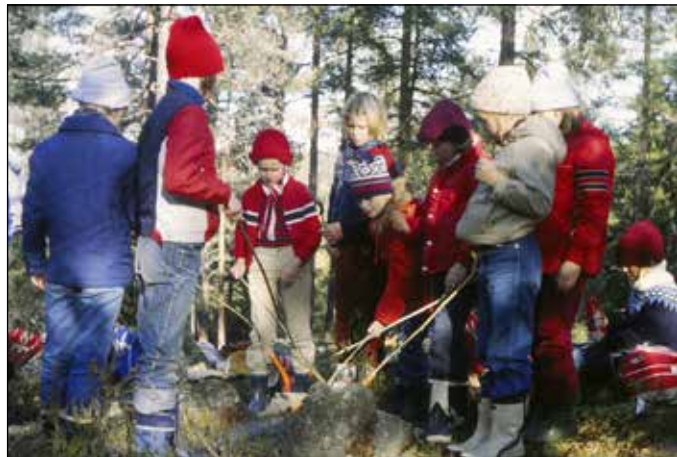
Speidere griller pølser.