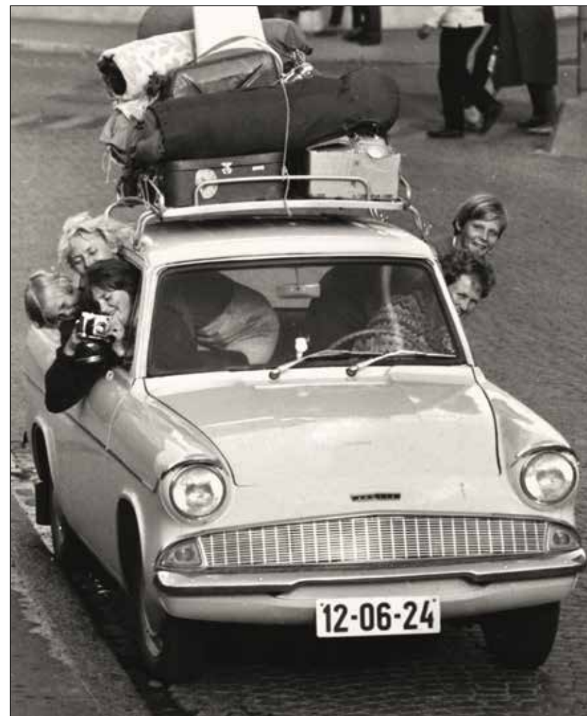
Da importrestriksjonene for privatbiler til Norge ble opphevet 1. oktober 1960, åpnet et stort marked for å kjøpe bil. Godt for Ford Motor, som da reklamerte med at «Bil betyr frihet til å leve»! Kilde: Fords jubileumsbok: 50 år med Ford i Norge 2010.