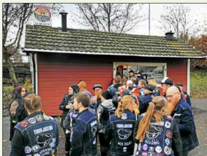
Sultne fans ventet tålmodig i køen foran Pamparius pizza.