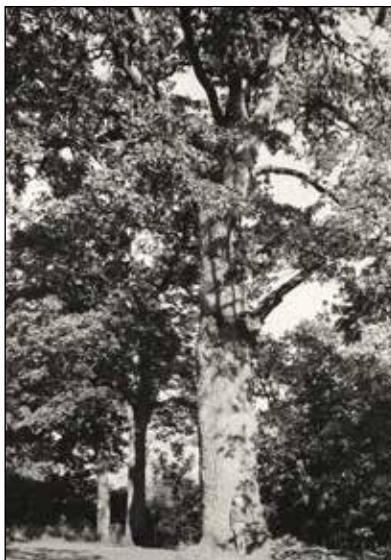
Den gamle eika ved Bålerud.