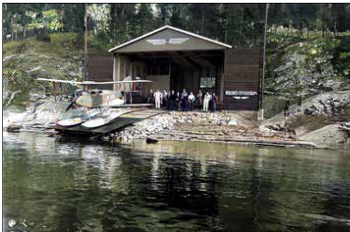
Ingierstrand sjøflyhavn. Ett fly, De Havilland DH.60 Moth, LN-ABU. Her var starten på Widerøes flyveselskap sin rutedrift. Kilde: Digitaltmuseum.no/Norsk luftfartmuseum og fargelagt av Terje Ilje.