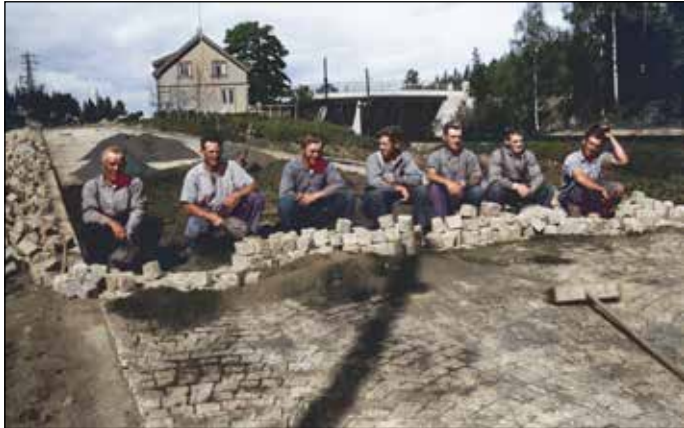
Brosteinlegging i Skiveien ved Myrvoll. Nødsarbeid på slutten av 1930-tallet. Foto: Museene i Akershus og fargelagt av Terje Ilje.