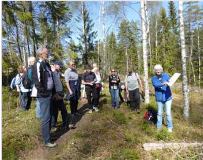
Kulturminnekurs med Oppedgård historielag.