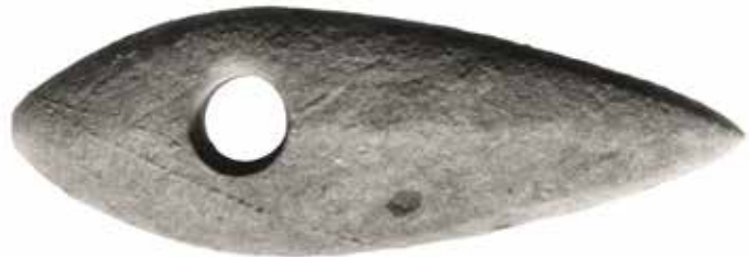
Stridsøks fra Sætre, yngre steinalder.