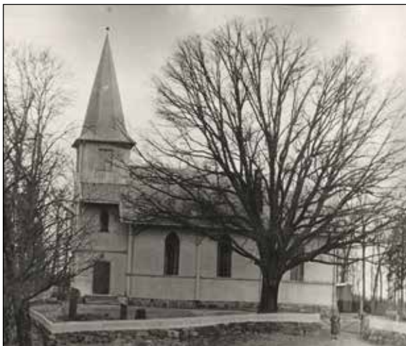
Oppegård kirke.

Arkeologiske funn og gravrøyser i området viser at folk har levet her i tusenvis av år før vår Kristin Lavransdatter, og lenge før noen overhode kjente den kristne kultur og kirke. Men fortsatt rasler det i løvet fra de varmekjære tresortene, som eik, lind og lønn, som allerede sto der da de første rydningsmennene kom.