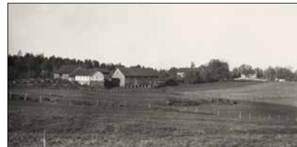
Søndre Oppegård.