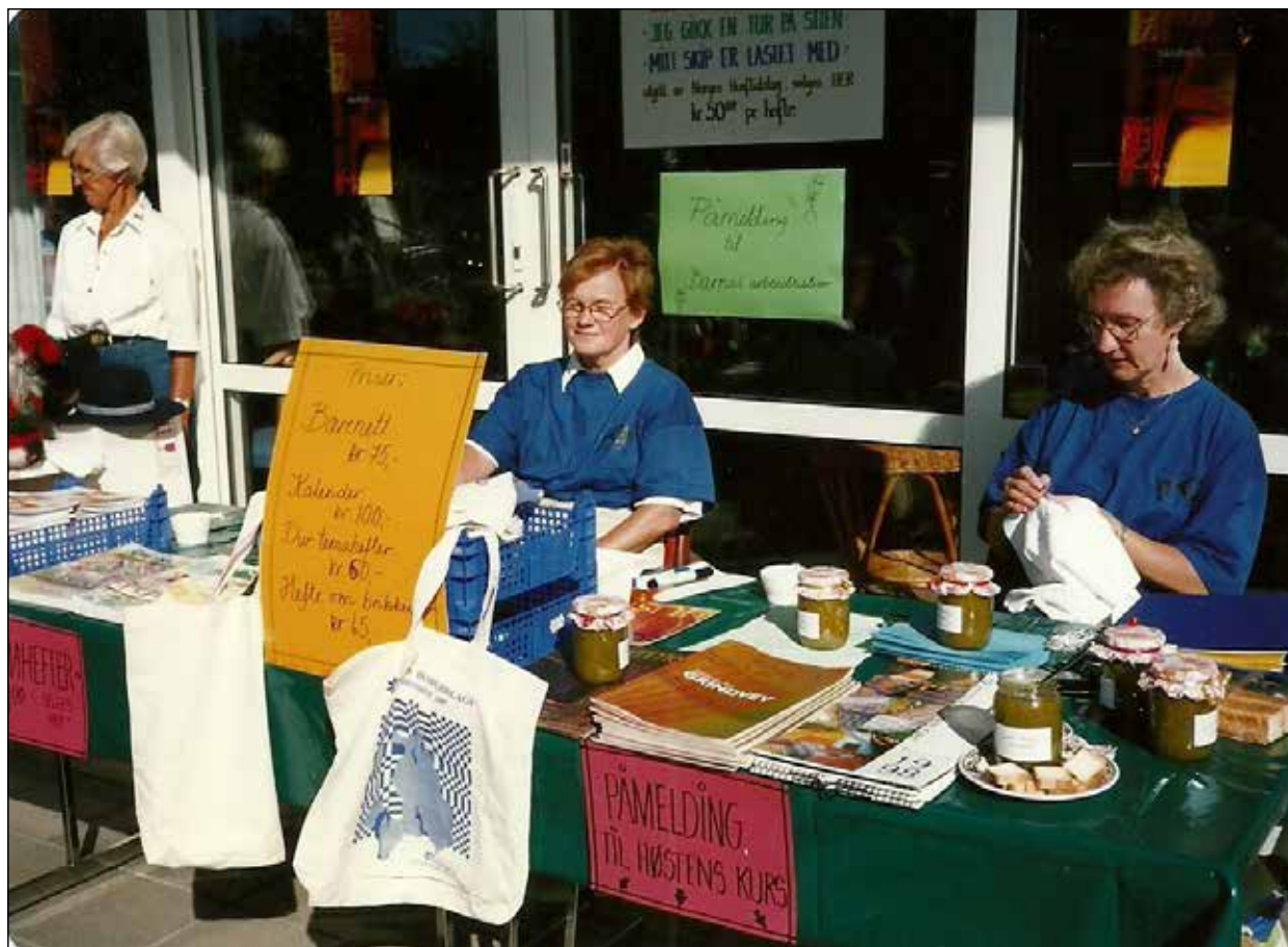
Oppegård husflidslag med utstilling og kurstilbud, 1997.

Nordre Follo kommune ønsker at frivilligheten og lokalsamfunnene skal samarbeide om å skape det gode livskvalitetssamfunnet. Ved å fortelle og synliggjøre vår rike historie skal Oppegård historielag bidra til dette.