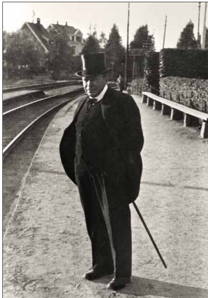
Faddereren: Forfatteren Oskar Braaten var den som sto fadder for biblioteket i Oppegård. Han kom med forslaget og han var leder for Bibliotekkomiteen. 15. desember 1922 startet utlånet fra Greverud skole, men da hadde Braaten allerede flyttet fra Oppegård.

Heller ikke Oskar Braaten, men han ville garantert vært enig.