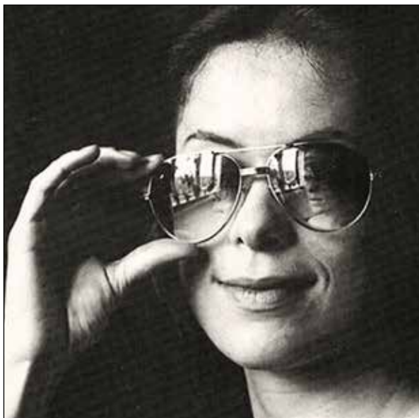
Radka Toneff døde bare 30 år gammel, men var en stor stjerne på den norske jazzhimmelen.

Jazzsangerinnen Radka Toneff (døde 30 år gammel i 1982) har satt spor etter seg i lokalmiljøet. Da hun var 12 år flyttet familien til Hellerasten. Som ungdom sang hun med flere lokale band i Samfunnshuset, som ligger der hvor Kolbotn torg er i dag. Hun sang blant andre med Kolbotn-bandet Sect, senere på Club 7 og fikk etter hvert