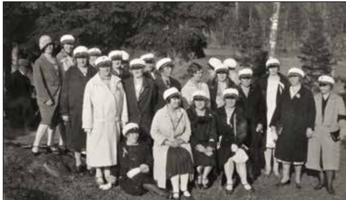
Kolbotn damekor - 1928.

Den store musikkinteressen blant barn i Oppegård kommune har hatt en blomstrende utvikling mest takket være den kommunale Oppegård Kulturskole (som kom i 1974).