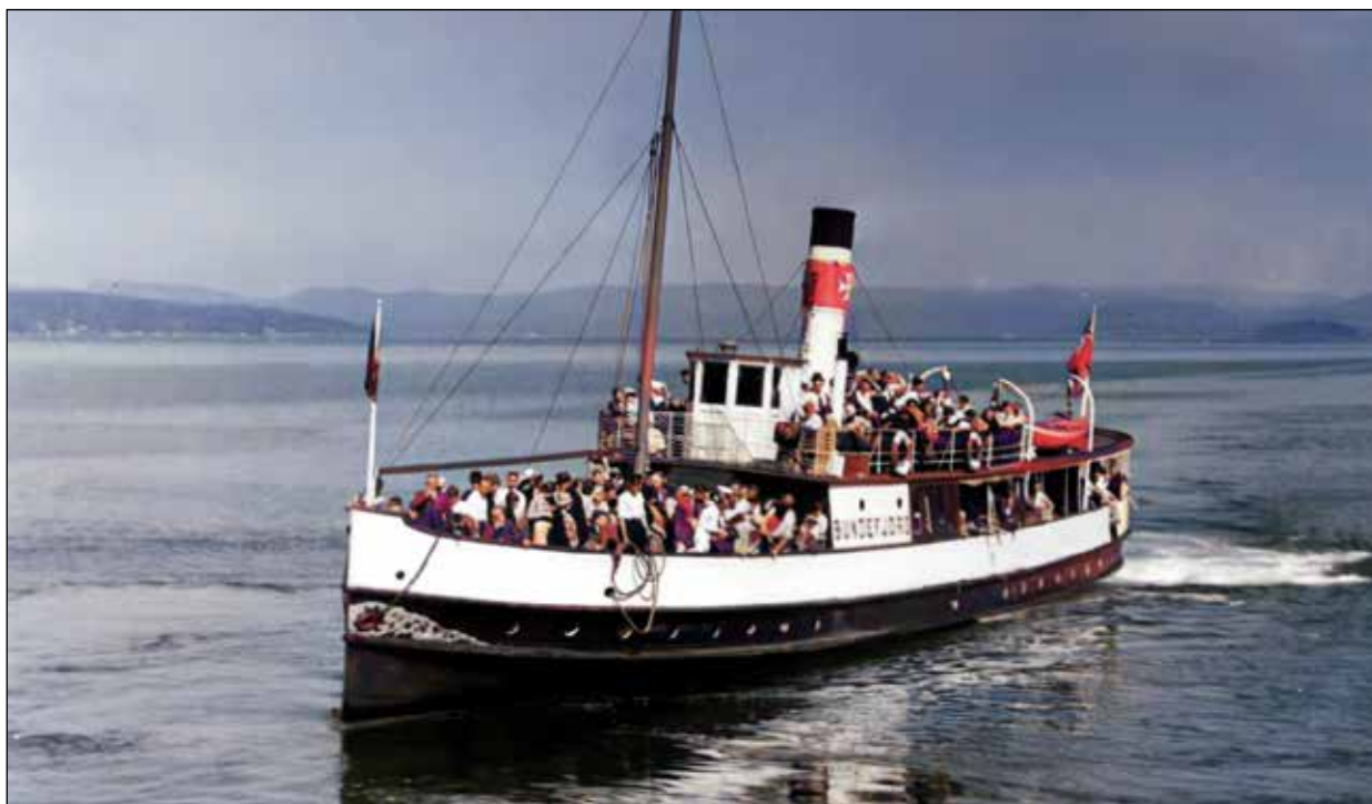
DS Bundefjord i rute på Bunnefjorden. Trafikken startet i 1857 og pågikk i nær 100 år.