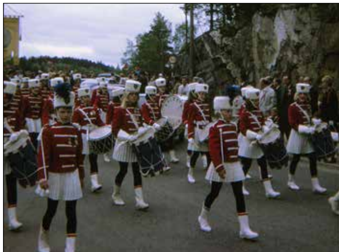
Kolbotngarden anno 1965.