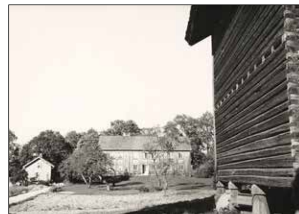
Søndre Oppegård, sørsiden av hovedhuset.