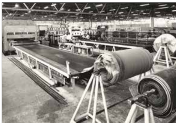
Produksjonshall på Den Norske Remfabrikk.

fikk hver arbeidsmaskin sin egen motor, og da svant det markedet hen. Remfabrikken var innovativ og fant nye produktbehov i flere 10 år, bl.a. ved å produsere Balata driv- og transportremmer. De kjøpte opp konkurrenten Viking Remfabrikk i 1969 og drev fra Kongeveien 49 frem til 1977. Men så var det hele over for 140 ansatte i Oppegård. Avdelinger i Kongsvinger og i Hallingdal overtok og utpå 80-tallet ble Remfabrikken en del av det internasjonale gummikonsernet Trelleborg Atlas. I dag er det Sofiemyr kjøpesenter som bruker dette fabrikkbygget.