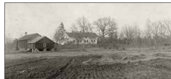
Bålerud gård - 1891.