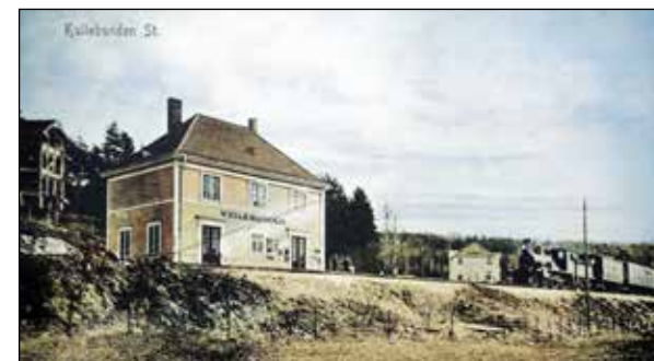
Kullebunden stoppested ble stasjon i 1910. Fra Willy Østbergs postkortsamling og fargelagt av Terje Ilje.

Flyforbindelse: Widerøes Flyveselskap AS startet i 1934 fra en sjøflyhavn på Ingierstrand og de bygget egen landbasert hangar ved sjøkanten for sine fly og trafikkerte ruter til Kristiansand, Stavanger og Haugesund.