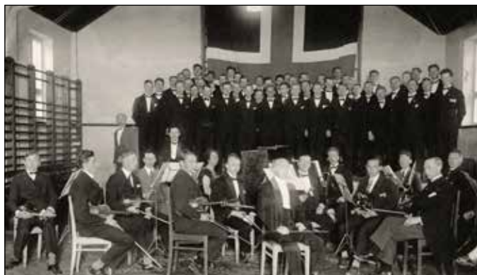
Konsert med Kolbotn orkesterforening - 1938.