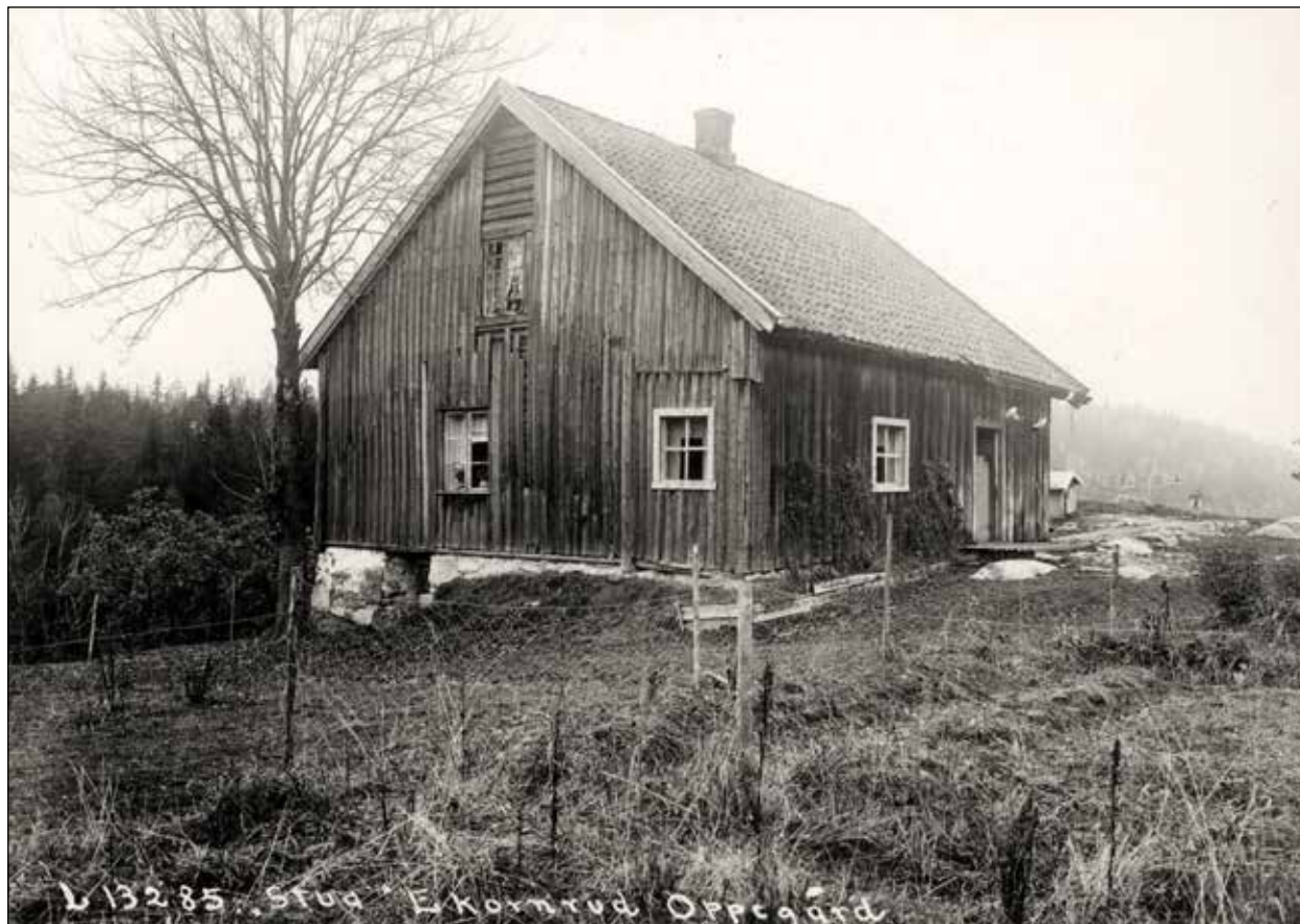
Nedre Ekornrud, Oppegård, "Stua".

Ormerud er knyttet til mannsnavnet Orm, Det samme gjelder navnet Bjørnsrud, og det er derfor gode grunner til å anta at Ekornrud-navnet derfor er et resultat av en omskrivning av et navn vi ikke lenger kjenner. Riktig nok finnes eksempler på kvinnenavn med -rud -endelser, men stort sett er de fleste knyttet til et mannsnavn, som Bålerud (Bårds rydning) og Torbjørnsrud, som vi finner i Oppegård.