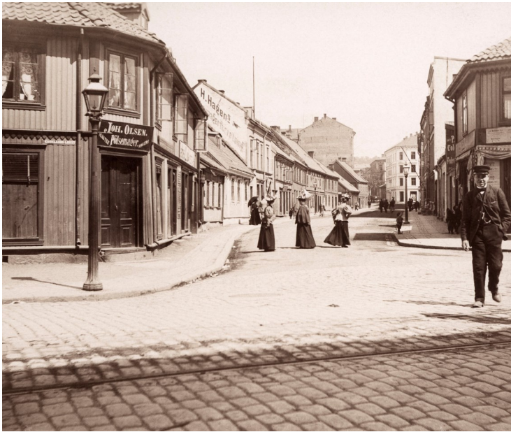
Aker kommune søkte tidlig om at Grønland skulle ligge under Christianias fattigdistrikt ettersom mange av byens arbeidere bodde her. I tillegg utgjorde håndverkere og handelsfolk i forstaden tøff konkurranse for byens borgerskap. Foto av Tøyengata sett fra Grønlandsleiret 1896.

Av fire store byutvidelser er tre – 1839, 1859 og 1878 – knyttet til den store byveksten på 1800-tallet; byen fikk det arealet den trengte for å vokse til en storby frem til 1900. Kristiania (byens navn til 1925) ble landets eneste murby etter kontinentale forbilder, med et rutenett av gater, plasser og fire etasjer høye murgårder i lukkede kvartaler, dagens indre by.