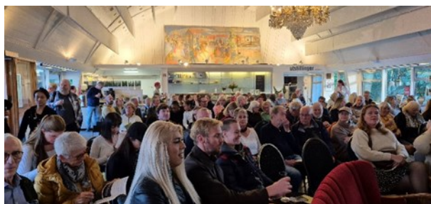
Fra åpningen av utstillingen OSLOOVE på Oslo Bymuseum 26/9 2024.

Mandag 25. november ble 400 videointervjuer med samendrag, samtykkeskjema og transkripsjon overlevert Oslo Byarkiv. 1 års intenst arbeide var brakt vel i mål. 400 Oslo-folk ble intervjuet av andre Oslo-folk. Vi i EGT historielag har deltatt i prosjektet og kan være stolte av at vi leverte 31 intervjuer inn i prosjektet og er med det trolig en av de største bidragsyterne. De aller fleste intervjuene er med folk som velvillig stilte opp og som har, eller har hatt, en eller annen tilhørighet til vårt område. Intervjuene har vært på 30 til 60 minutter og folk har snakket fritt om barndom, ungdom, voksenliv, hvordan området er i dag og hva man tror om fremtiden.