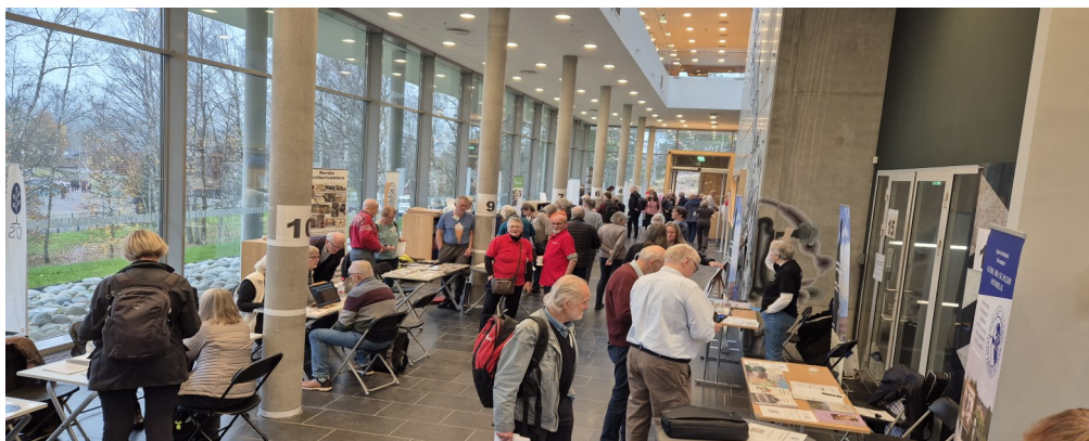
Slektsforskerdag på Riksarkivet, Sognavn. Ankomstområdet.