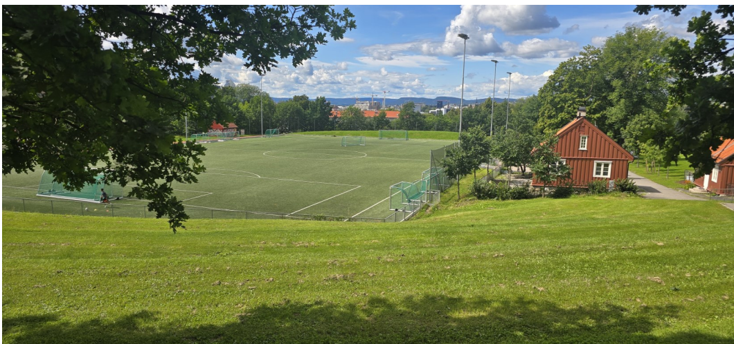
Dagens fredelige Caltex-løkke som for 80-år siden var skueplass for slåsskamper mellom gutter fra Kampen og Tøyen. Til høyre, nederst i bildet lå området «Junger'n» hvor mange «lysskye» aktiviteter foregikk.

Kilder: Gamle avisartikler og egne minner.