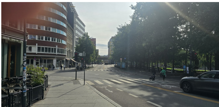
Brugata med overgang til Grønland i dag med Vaterlandsparken til høyre.

presentant for Ringnes Bryggeri kunne fortelle at «Brogaarden» hadde mottatt 6 millioner halvlitere fra bryggeriet siden 1945. Thorstensen tok med seg mange av de ansatte til Sinsen Restaurant, som han drev ved siden av Wessels Kro og Sagene Lunsjbar.