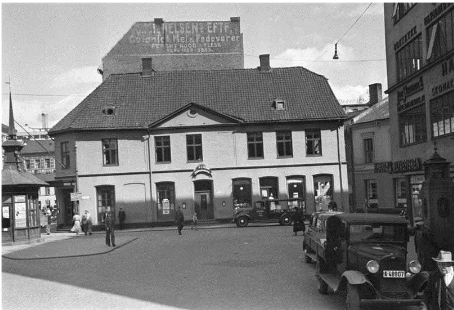
Brogaarden i 1938.

1971 restauranten stengte 30.april, og bygningen ble revet i juni.