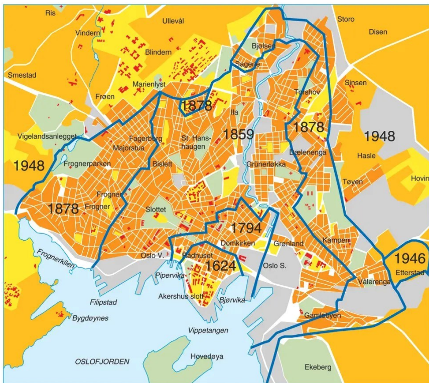
Kart over byutvidelser. Oslo Byleksikon

Utenom byen lå ikke bare de fattige strøkene med folk som omtrent ikke kunne betale skatt. Der lå også de store brukene oppover langs Akerselva, og hvis byen kunne få dem med, kunne det vel lønne seg å ta fattigstrøkene med på kjøpet. Det var en slags nødvendig fremtid i det å gjøre byen til en industriby, selv om det skulde koste en del å få en ny, fattig befolkning også inn i byen.