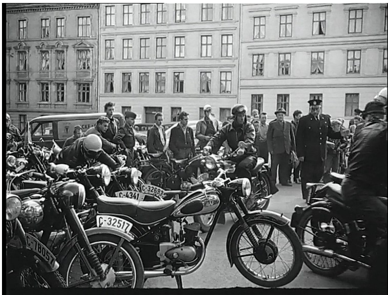
Fra filmen «Fartsfeber» laget av Oslo Kinematografer og Trafikkmyndighetene 1958. Pallas film, Finn Carlsby. Oslo Byarkiv

Med klesdrakt gjerne inspirert fra amerikanske filmer, med svarte skinnjakker og jeans, samlet gjenger med motorsykler seg på «stripa» på Karl Johan mellom Egertorget og Universitetsgata. De var nok de «tøffeste» på den tiden - i slutten av 50-åra. De var fra ulike kanter av byen, men slåss ikke åpenlyst med hverandre, der de kjørte fram og til-