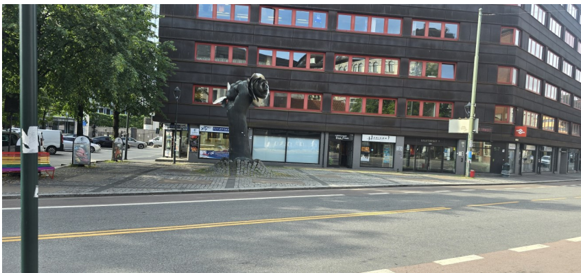
Dagens Lilletorget med statuen «Neve med rose». Fellesforbundet eier skulpturen.