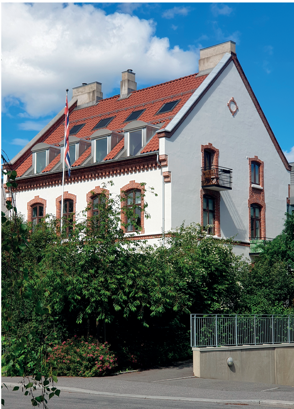
Guttehjemmet i Geitmyrsveien 35.

I mellomkrigstiden var det flere barnehjem, både for gutter og jenter, i området rundt St. Hanshaugen. De hadde mye kontakt med hverandre og samarbeidet med skolene i området. Her får dere et innblikk i livet ved