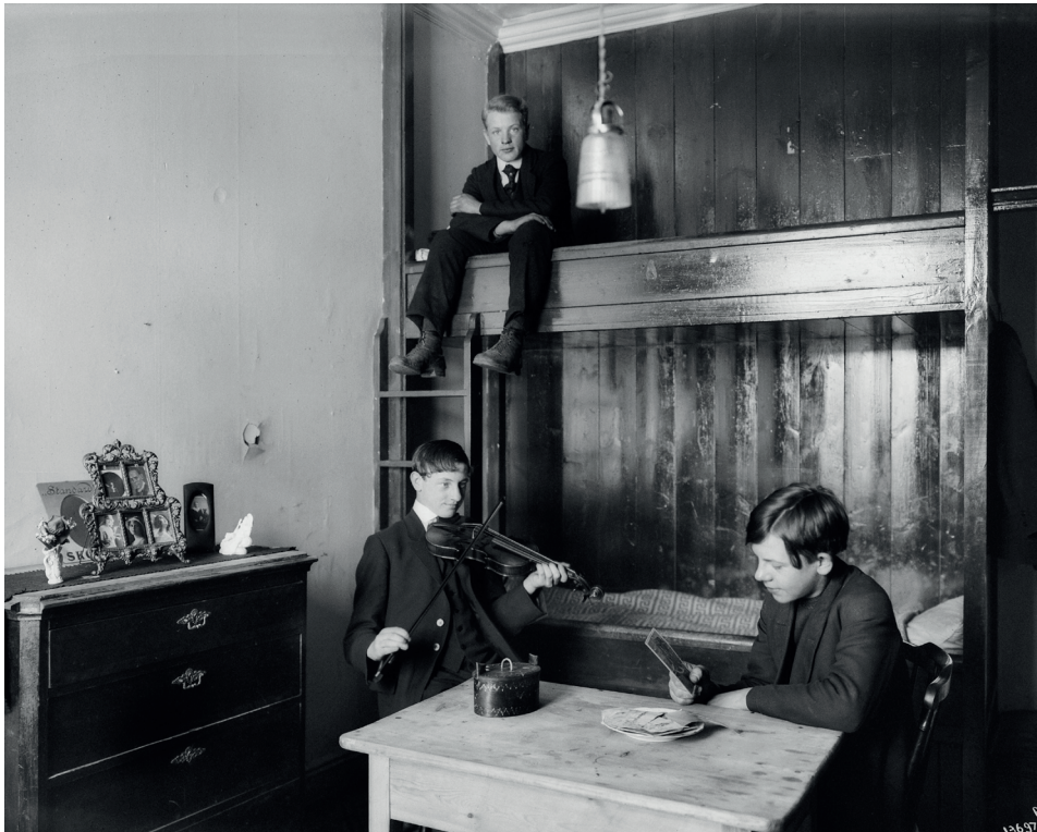
Sovesal i Guttehjemmet. Foto Anders Beer Wilse ca 1920/Oslo Museum

der, økonomien var jo alltid trang og hver stein måtte vendes skulle det gå rundt. Men en dag tok hun Johan med seg til byen, han skulle kles opp. Sage- ne Ring til Storgata, inn på Follestad, gensere, bukse, sko og strømper og en staselig matrosdress med hvit snor og fløyte. Deretter bar det til Promenade- cafeen på Egertorget og med utsikt til slottet og munnen full av is utbrøt Jo- han: