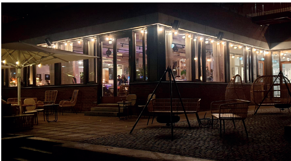
Restauranten Jubel.

redusere utenforskap med de gevinstene det vil ha både for kommunen og den enkeltes helse. Fram til 2030 vil det jobbes med reguleringsplanen før de store byggearbeidene tar til. Samtidig åpnes eksisterende bygg for midlertidig bruk.