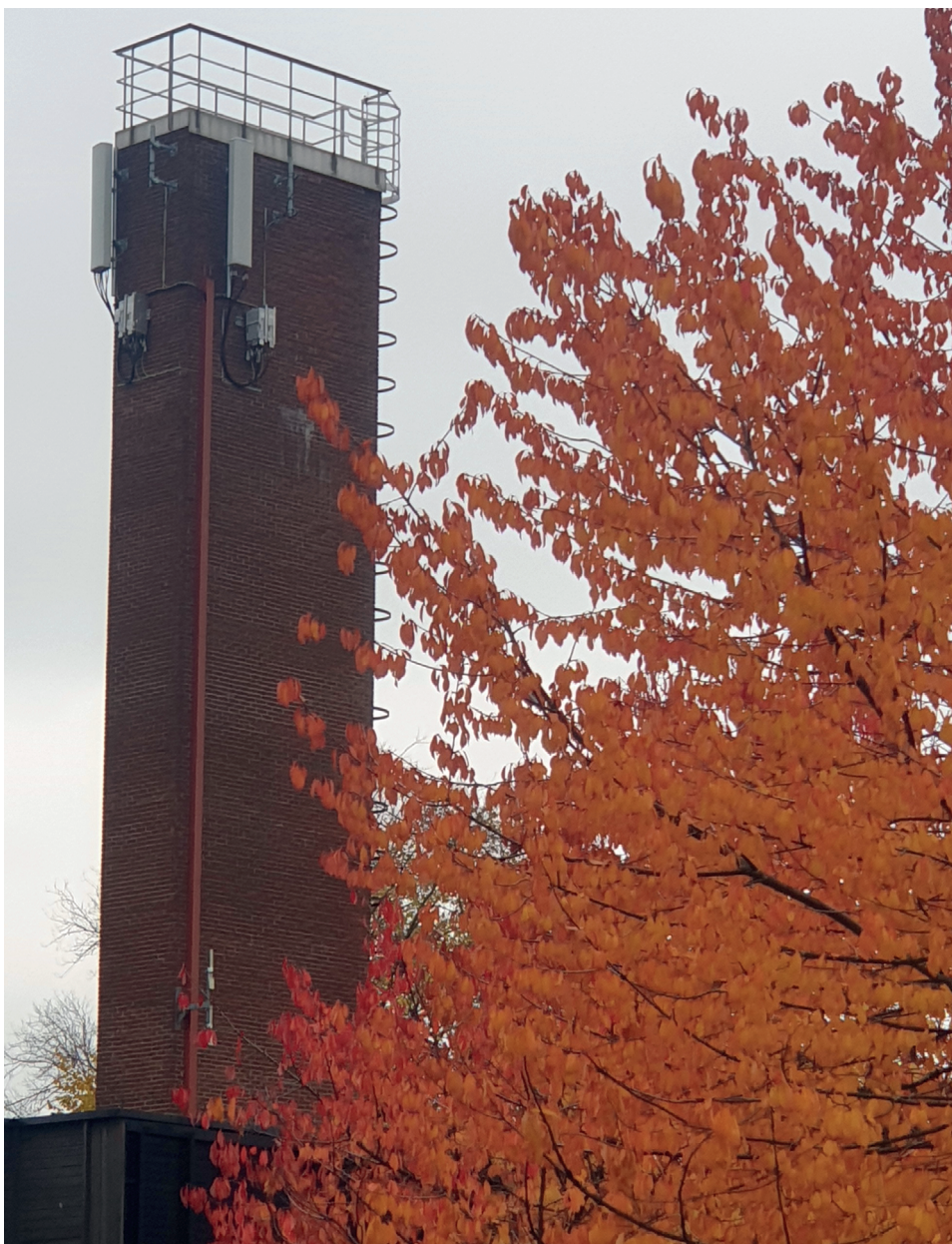
Tårnet på Veterinærhøyskolen.

Mange lurer vel på hva som skjer med den gamle Veterinærhøyskolen? Her gir vi en kortfattet informasjon om hva som har skjedd så langt, og litt om de videre planene for dette unike området.