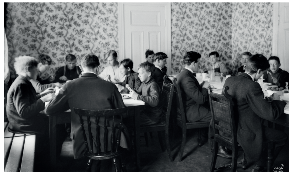
Spisesal i guttehemmet.

Selve bygget er i pusset tegl over to etasjer med høy kjeller og et bratt saltak som ga rom for flere værelser på