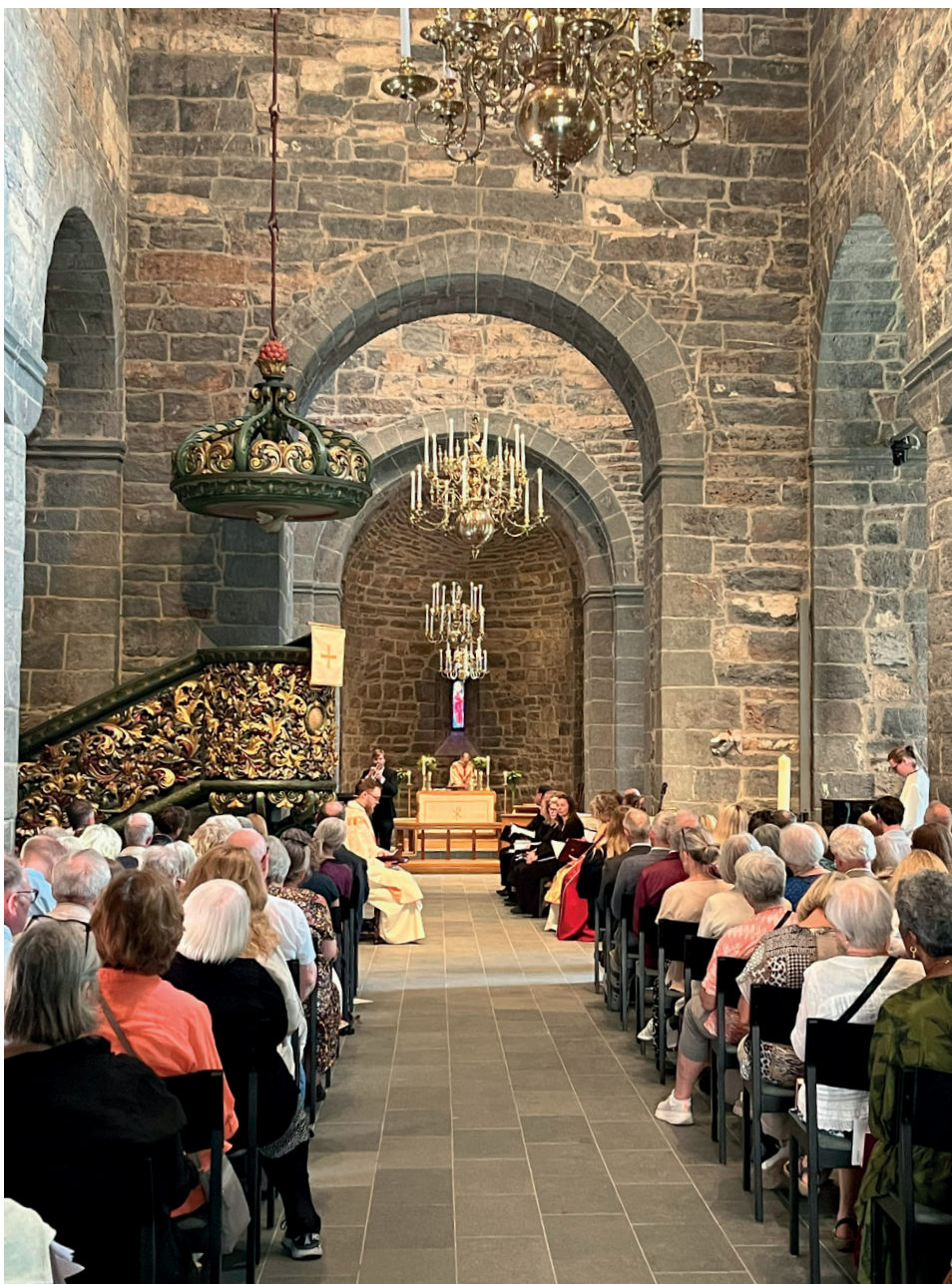
Gjenåpning av Gamle Aker kirke 26. mai 2024.

Gamle Aker kirke, Oslos eldste bygning, troner sentralt i vår bydel. 16. oktober vandret 50 medlemmer fra historielaget rundt på kirkegården, og fikk en omvisning inne i kirken, under ledelse av sogneprest Roger Jensen. Han fortalte spennende og svært levende om kirkens historie, og ga oss innblikk i den nylig gjennomførte restaureringen.