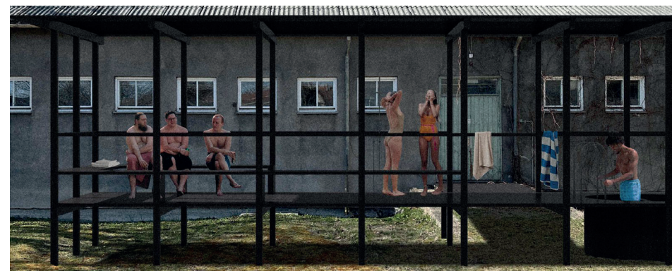
Badstuillustrasjon – forslag fra Arkitektfirmaet Transborder som del av mulighetsstudien for Veterinærskoleområdet.

Uansett hvor veien går videre er det viktig at nabolaget fortsetter å engasjere seg og komme med innspill, eierne legger stor vekt på dette. Adresser enten til postmottak@obf.oslo.kommune.no eller post@linstow.no , evt til historielaget. Vi kommer til å oppdatere oss så godt vi kan på våre hjemmesider.