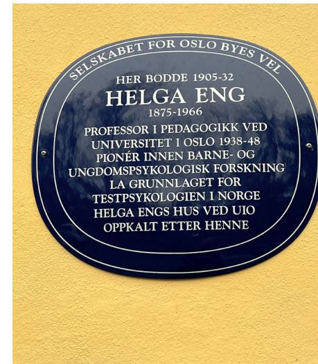
Blått skilt for Helga Eng

Hennes faglige interessespekter var bredt. Det første hun tok fatt på, var å skrive om ulike nåtidige retninger innenfor pedagogikkfaget. Dette resulterte i boka Kunstpedagogik i 1918. Andre produkter hun fullførte i løpet av årene hun bodde ved St. Hanshaugen var først Barns følelsesliv i sammenligning med de voksnes fra 1921, basert på en eksperimentell undersøkelse. To år etter ga hun ut Begynnernes forestillingskrets og sprog ved optagelsen i skolen. Da en av hennes søstre fikk en datter i 1918, inspirerte det-