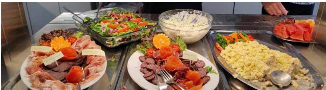
Maten var et kapittel for seg. Den var helt fantastisk!