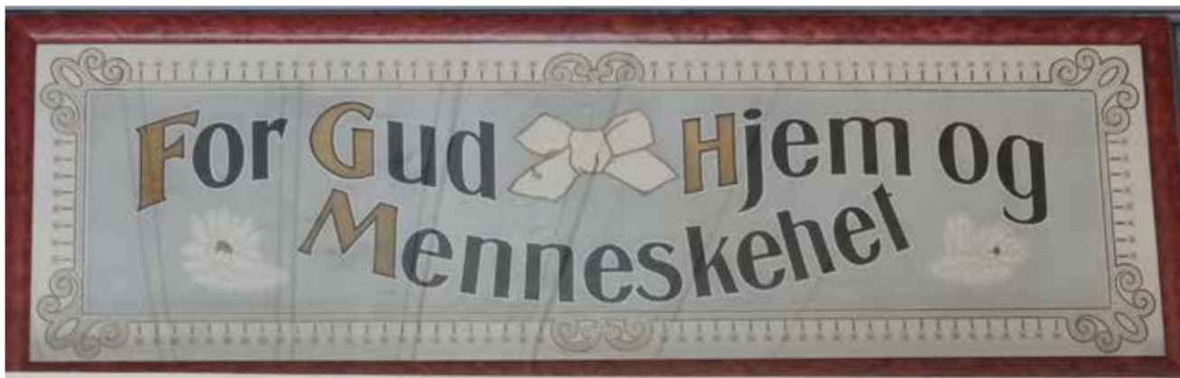
Mottoet for DHB hadde fått en fin plass på Stabbursloftet.