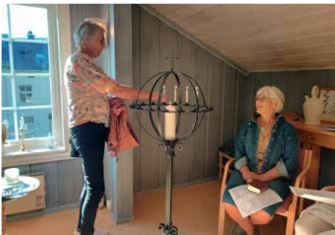
På andaktssamlinga på Stabbursloftet var det også anledning til å tenne lys.