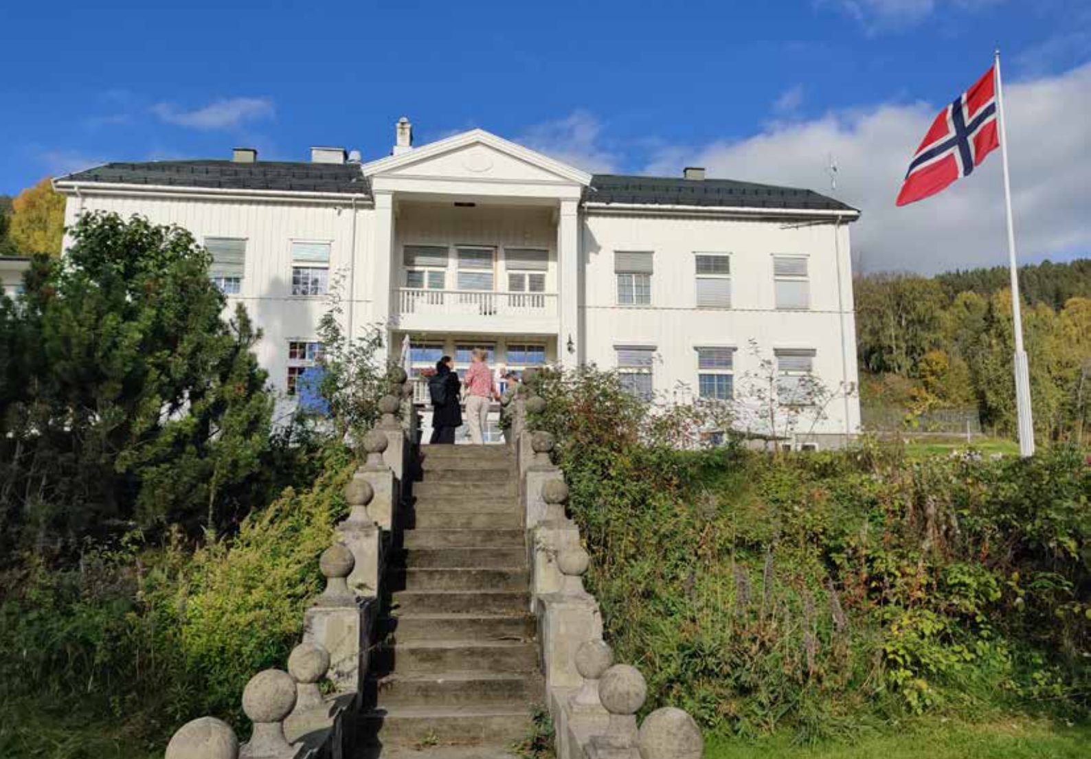
Hovedhuset på Riisby er fra 1925 og var gårdshuset på en storgård i bygda