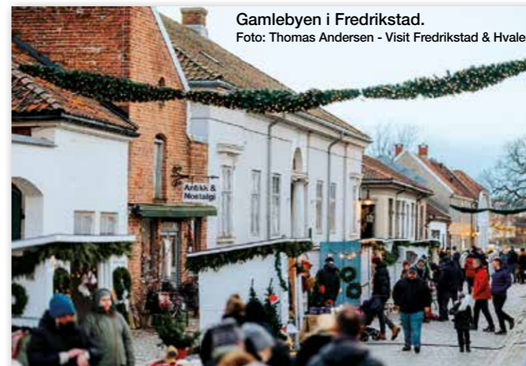
Gamlebyen i Fredrikstad.