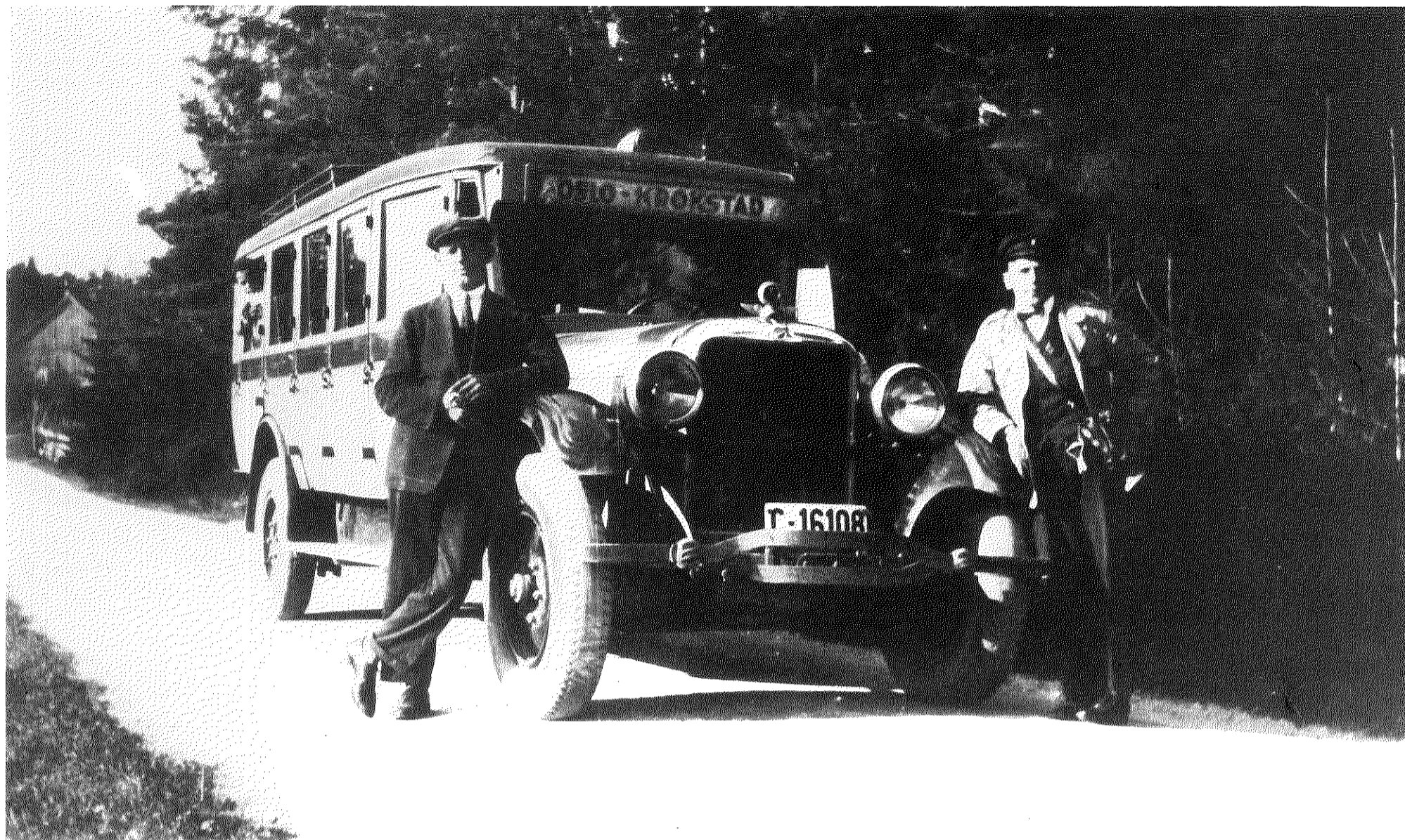
Automobilruten Kraakstad—Oppegaard—Oslo 1923.