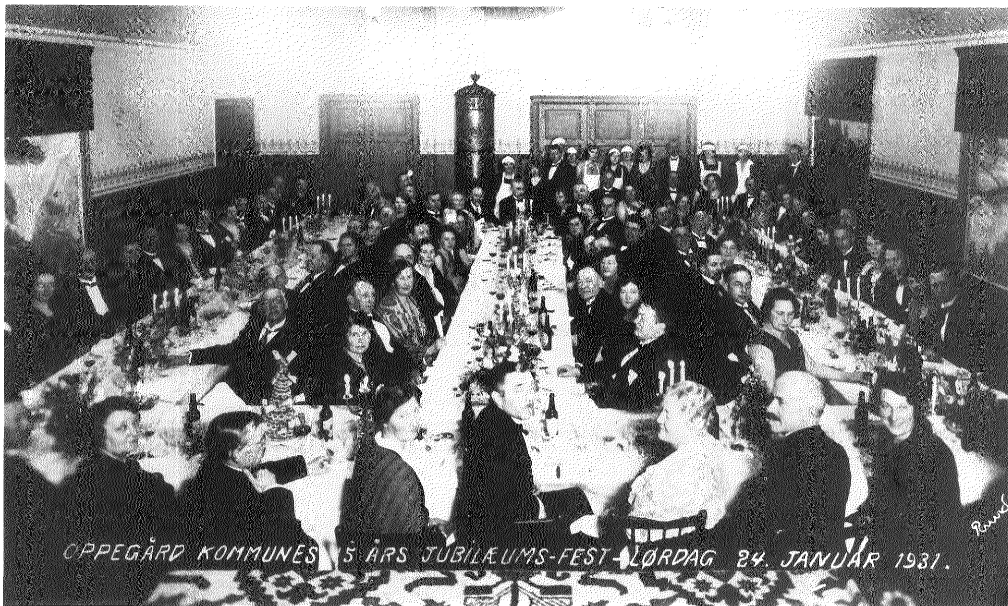
Oppegård kommunes 15-års jubileumsfest i 1931.