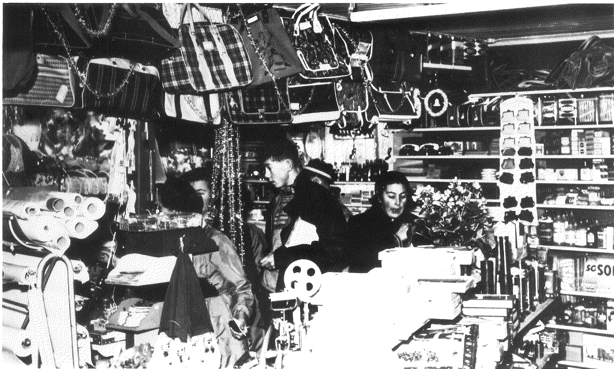
Julehandel Kolbotn Jernvare og Farve (ca. 1960).