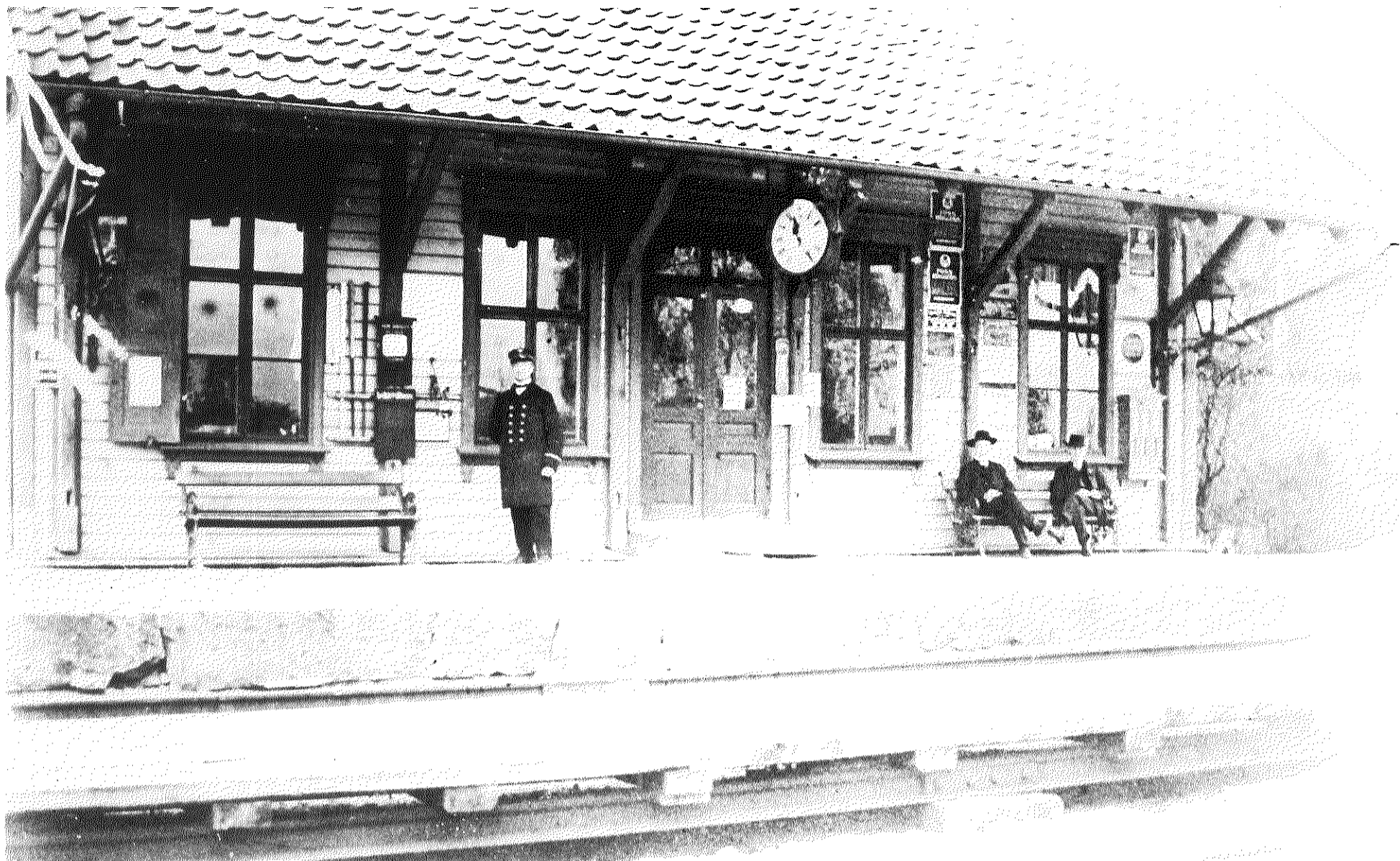
Oppegård Station 1908.