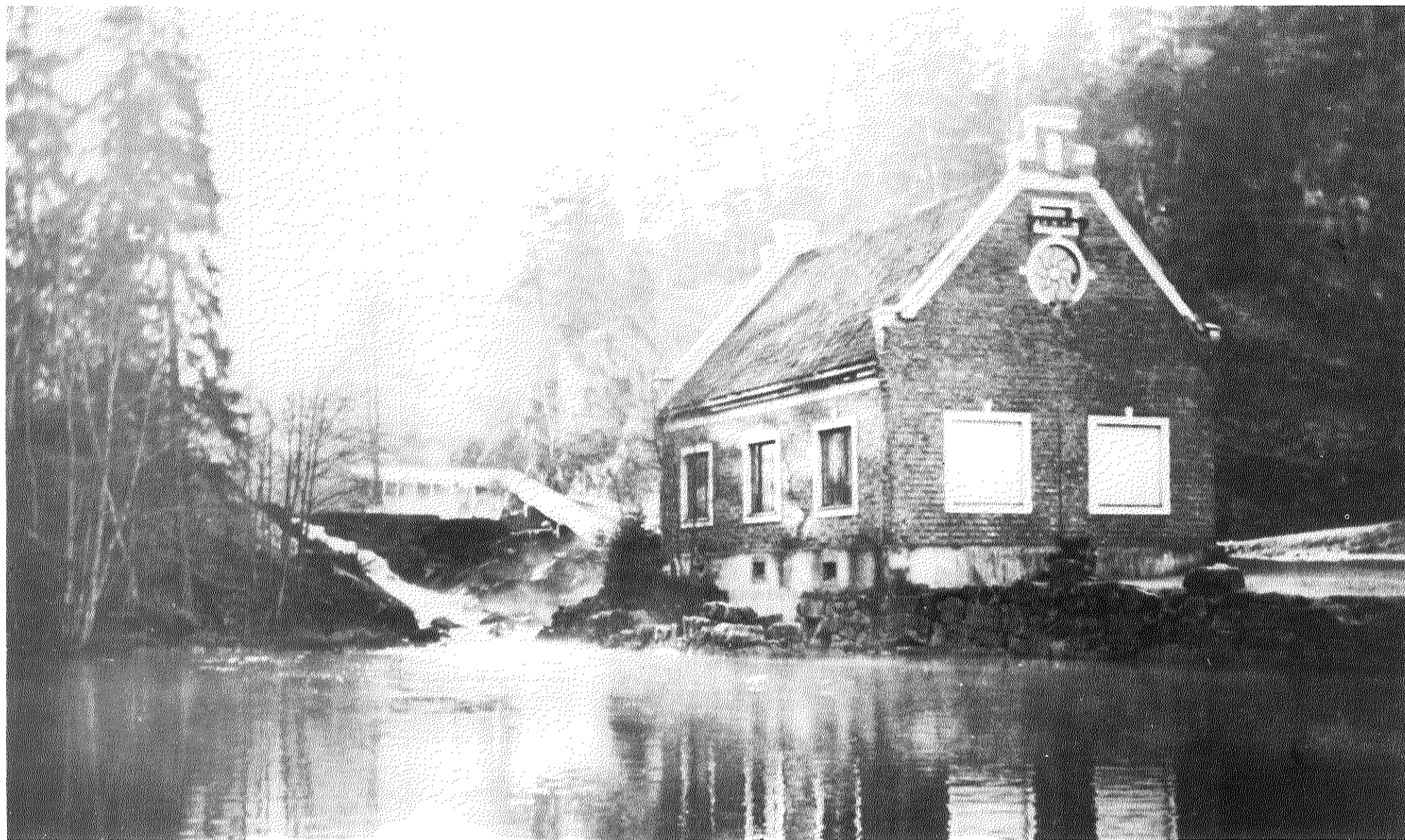
Ljansbrukets elektrisitetsverk i Gjersjøelva.