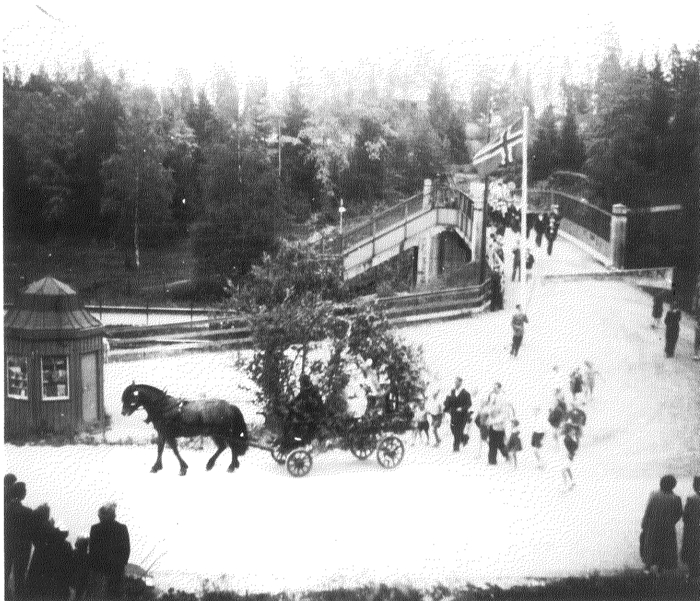
Myrvollbroa 1952. 0217-098:0005