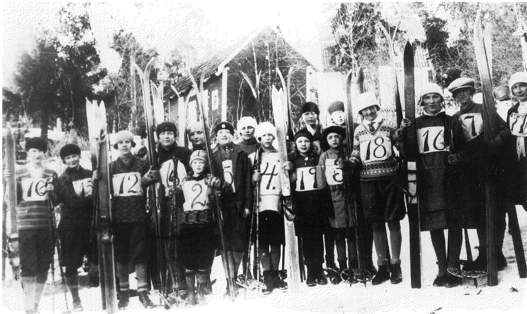
Dameskirenn på Oppegård 1928.