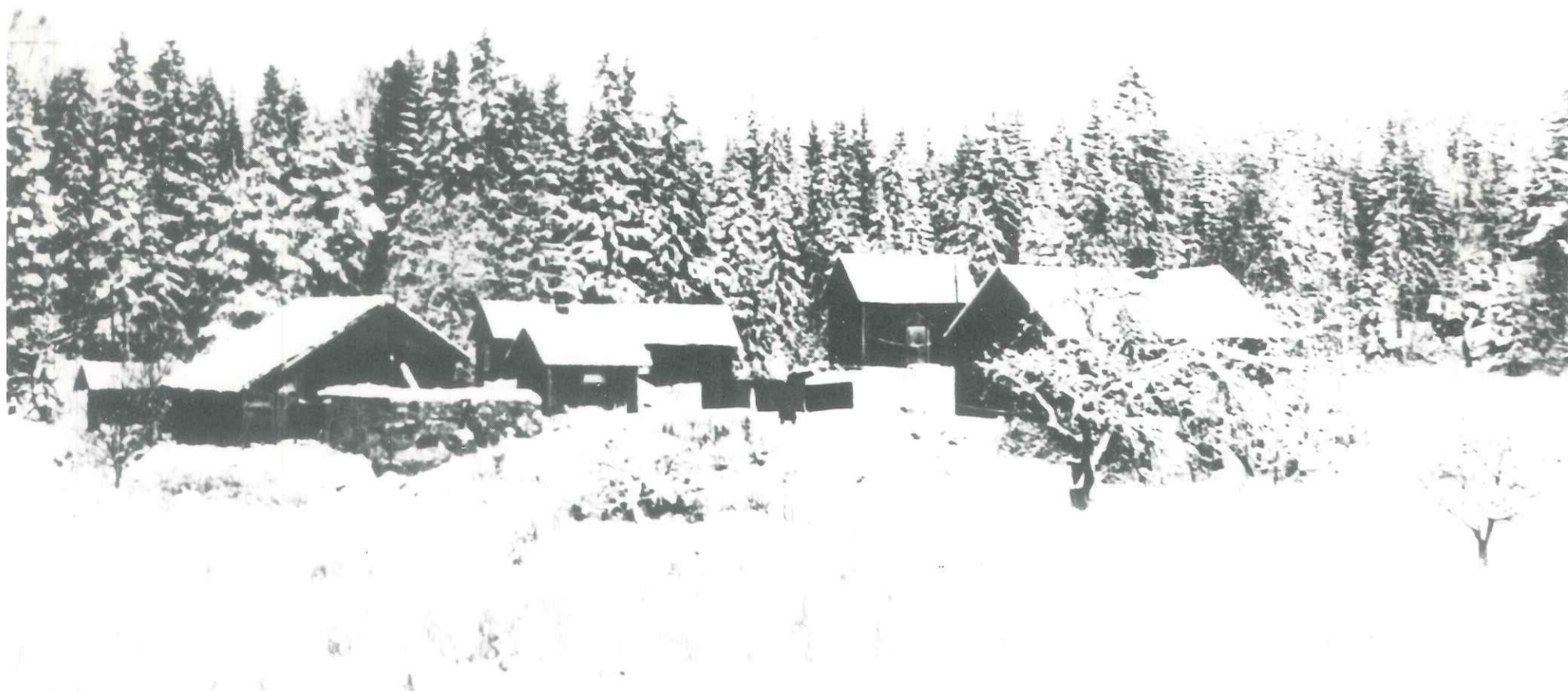
Fotografert ca. 1950 Eier: Familien Dillevig