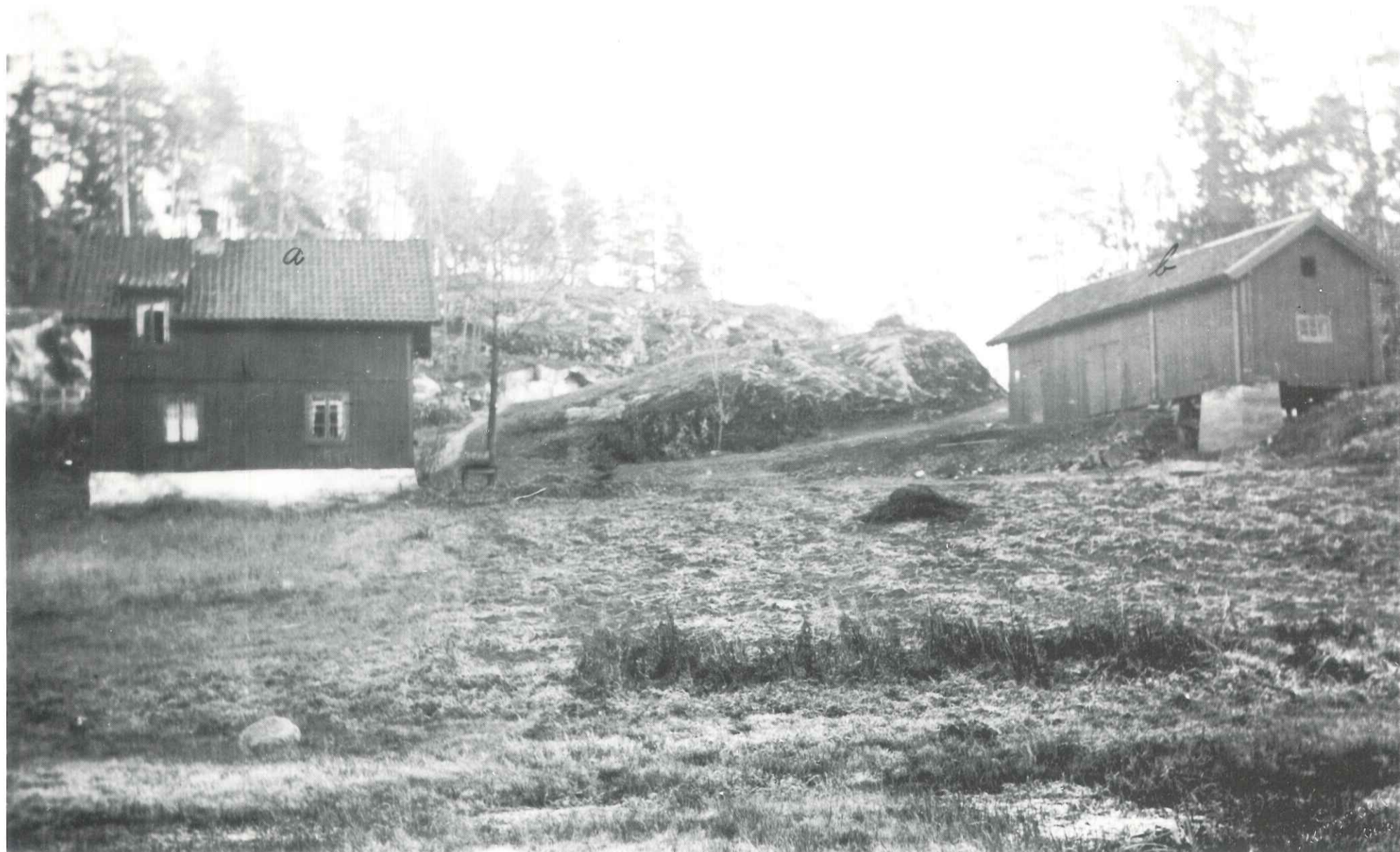
Fotografert ca. 1930