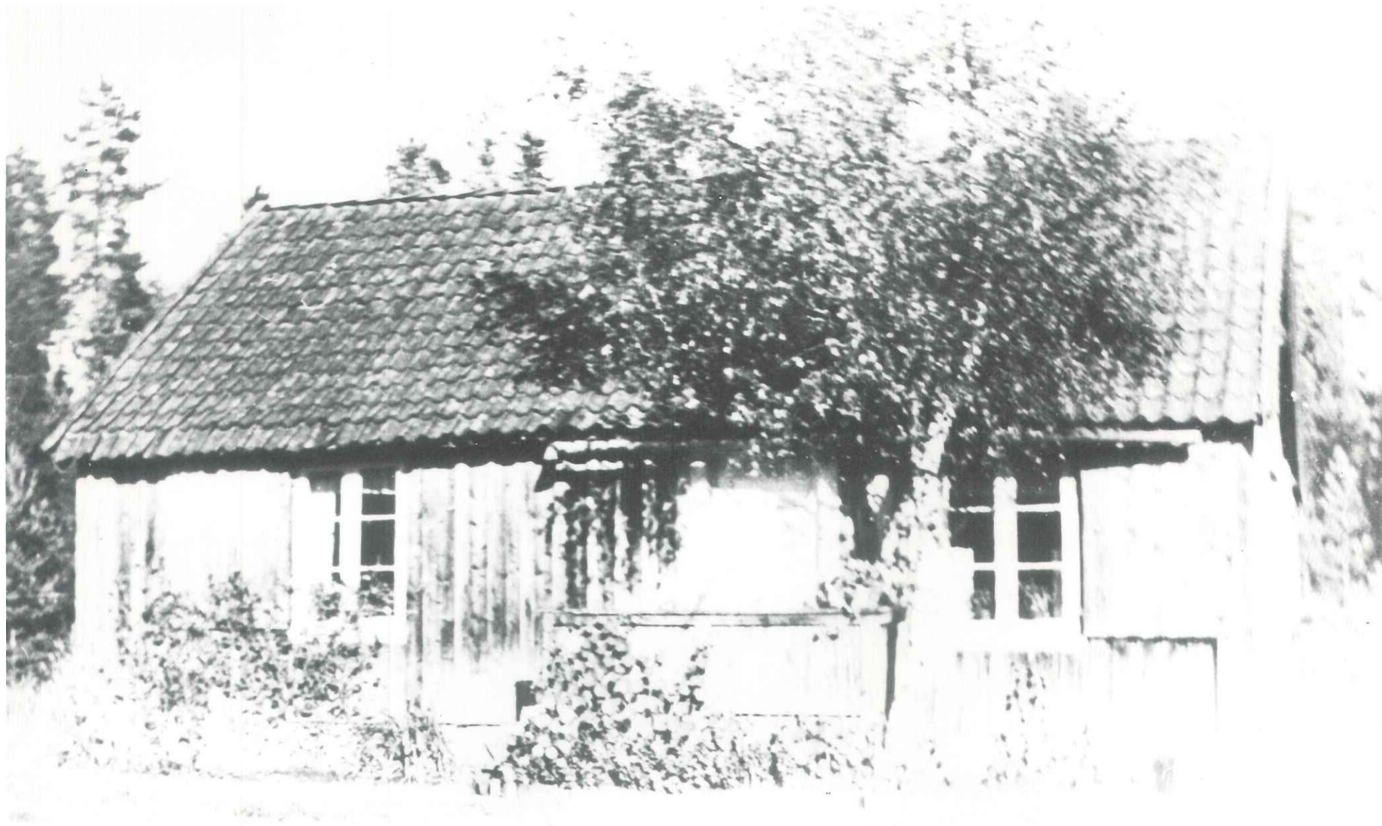
Fotografert 1959