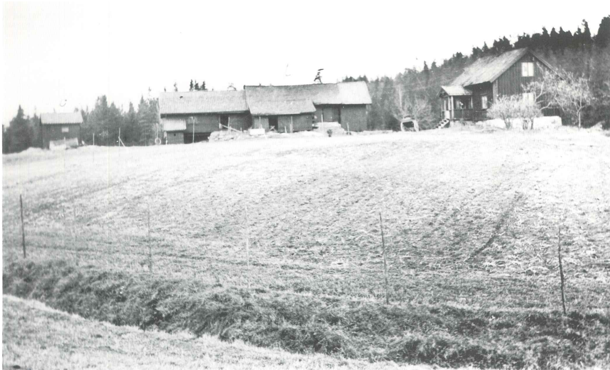
Fotografert ca. 1930