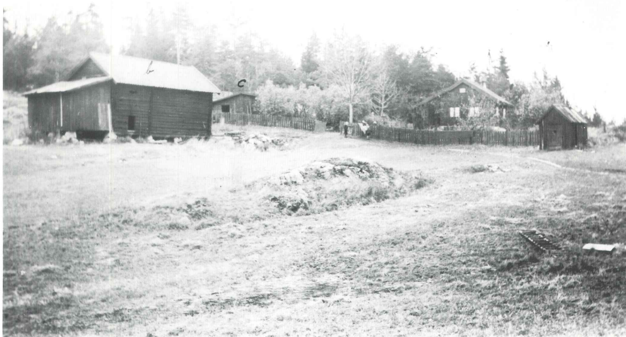
Fotografert ca. 1930