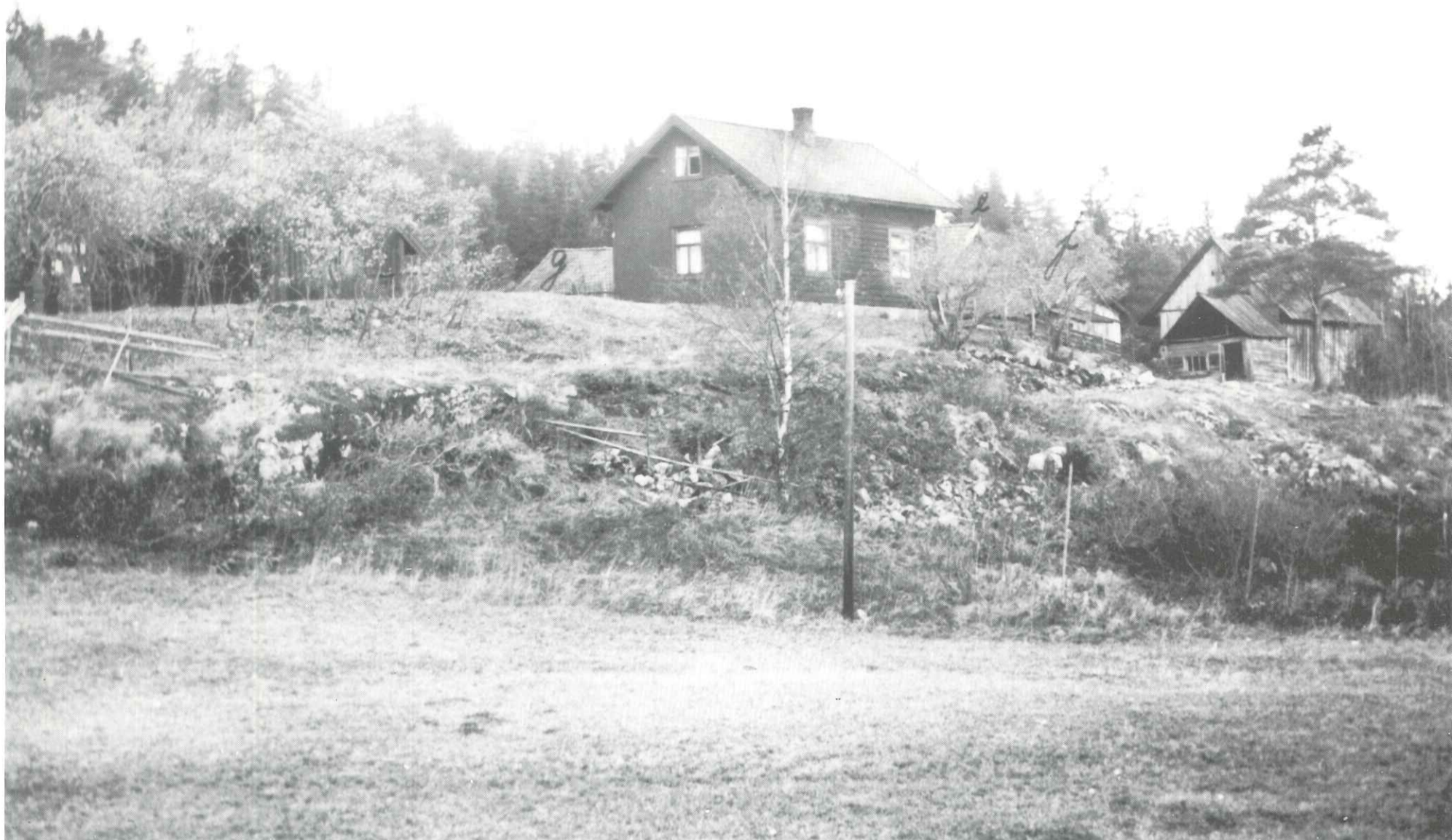
Fotografert ca. 1930