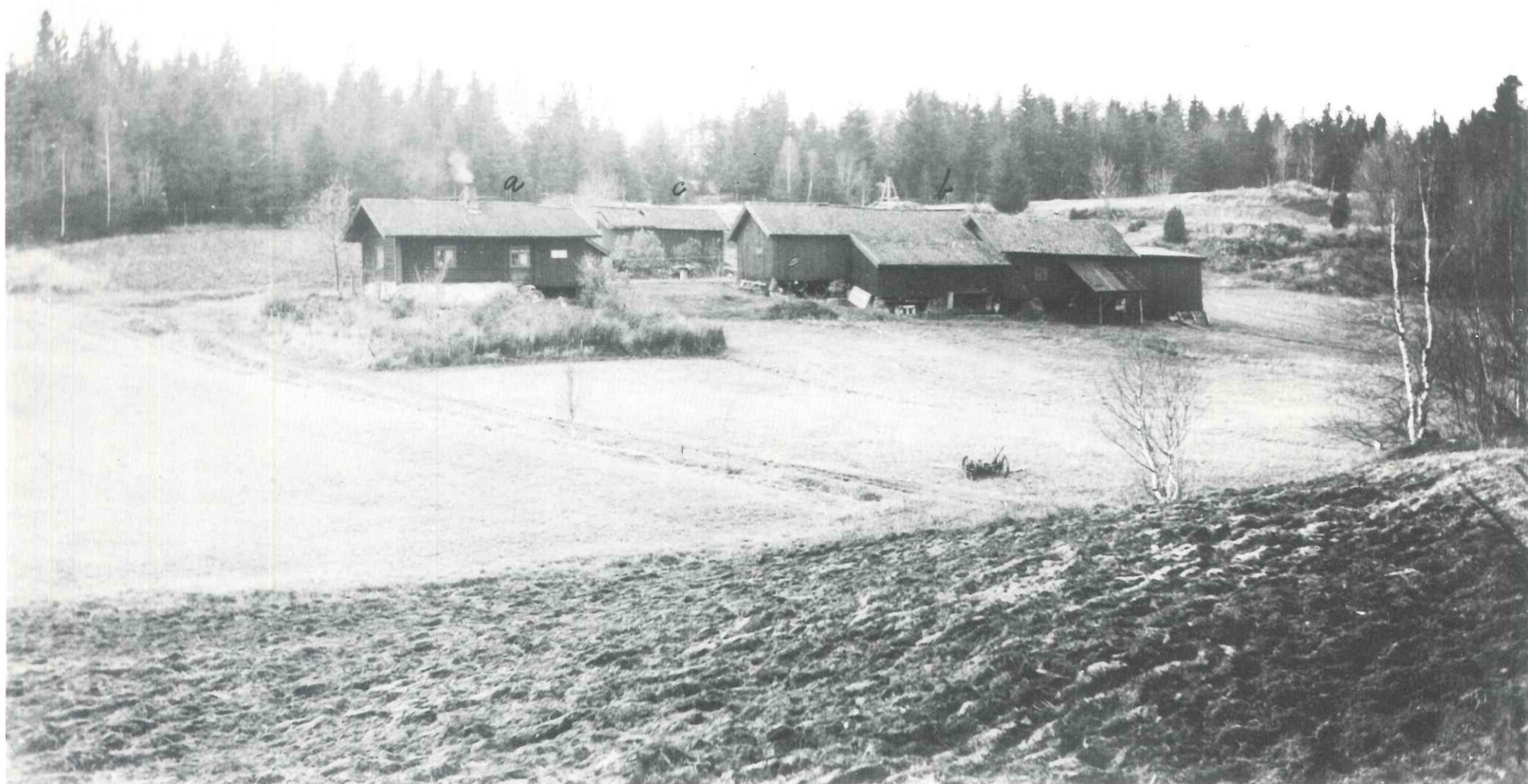
Fotografert ca. 1930