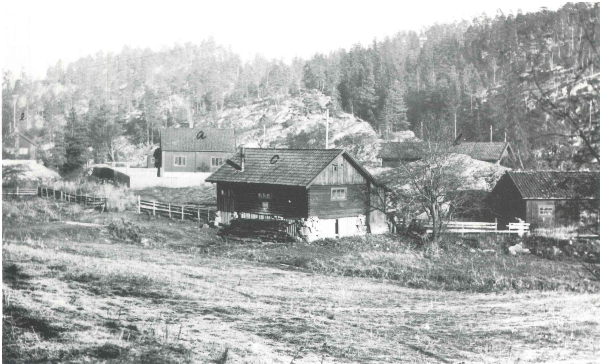
Fotografert ca. 1930 Eier: Eivind Sundt