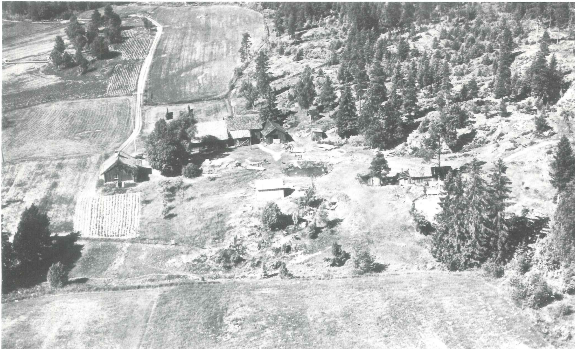
Fotografert 18/3-1957