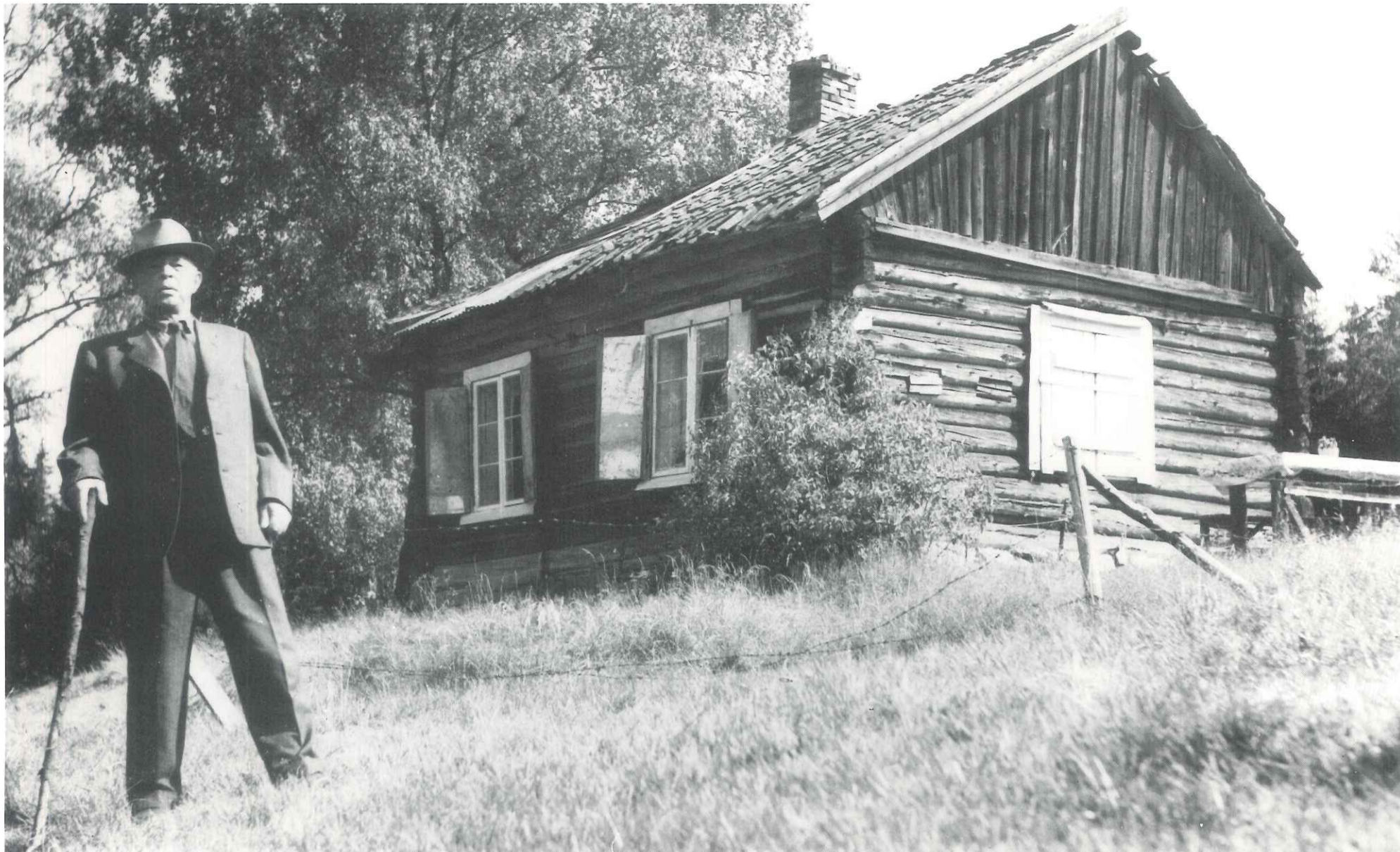
Fotografert 1959