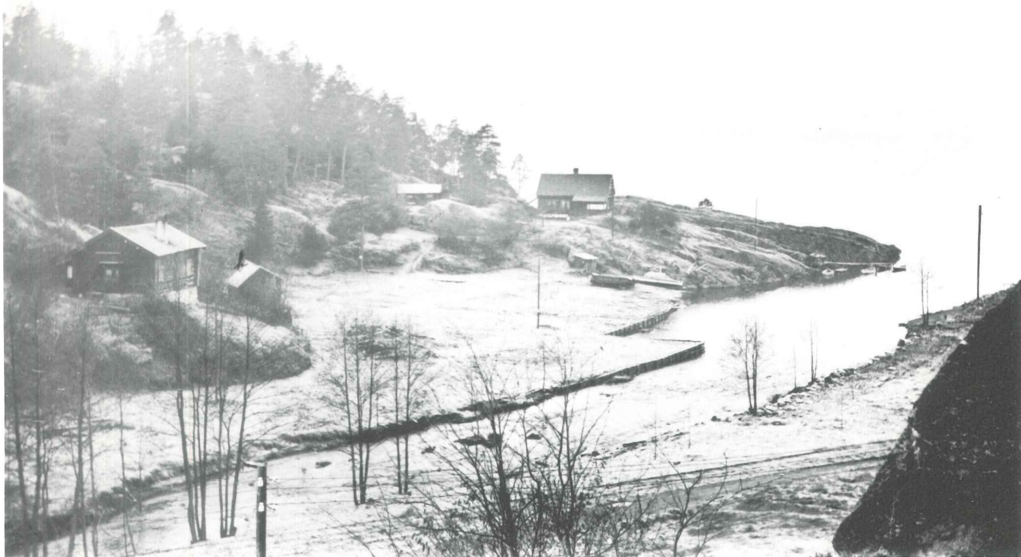
Fotografert ca. 1930