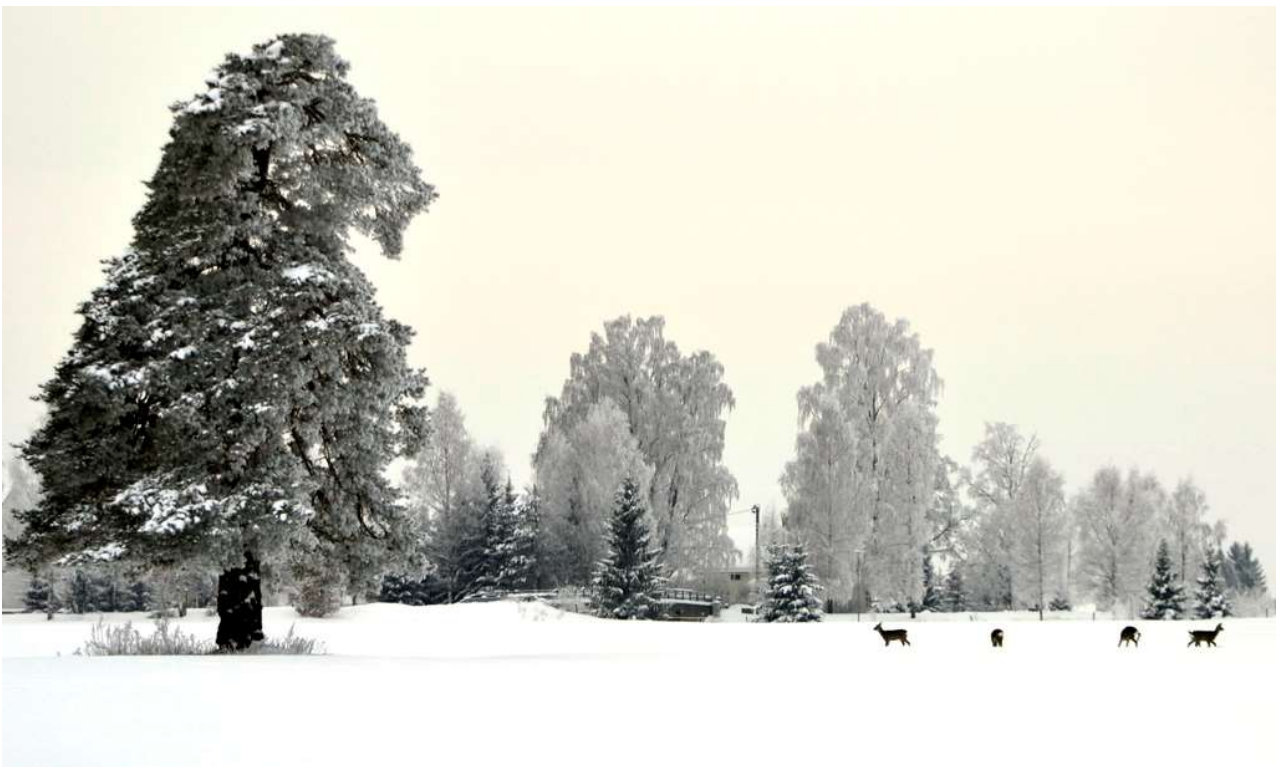
Vinter ved Knepefeltet