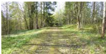
Kollen i mai 2018.