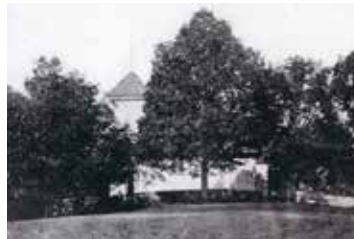
Gamle Oppegård kirke.