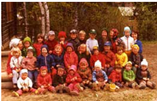
Kollen barnepark 1969.

Her var det også juletreffester. Willy Østberg husker godt at vi hadde et speider jubileum på Ingieråsen skole,