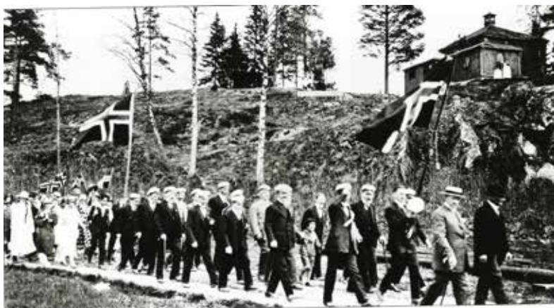
17. mai-tog 1928 med Kollen i bakgrunnen