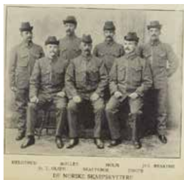
De Norske skarpskyttere som i Athen OL 1906

Dette er den tragiske historien til en kjent og berømt idrettsmann som vant olympisk gull så tidlig som i 1908 og som bodde på Kullebund, mens ennå Oppegård var en del av Nesodden herred. Man kan vel karakterisere han som Kolbotns første idrettsstjerne. Legg også merke til at Kullebund Idrettsforening la ned krans på båren. Dette var forløperen til Kullebund Idrettsklubb som ble stiftet i 1915.