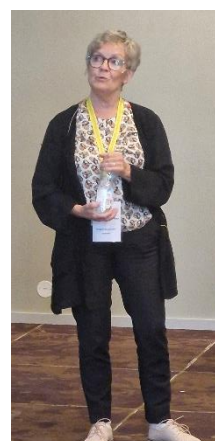
Ringve Museums venner. ved Anne Piro