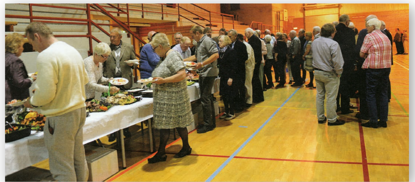
2015: Landsmøte på Bildøy. Her ser vi matkøen til et fantastisk koldtbord.