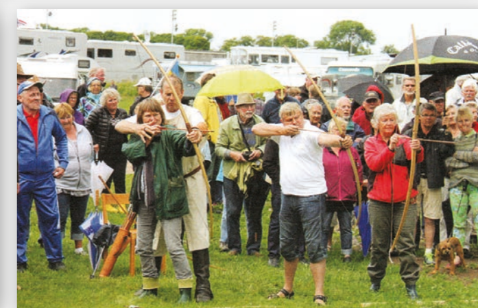
2013: Nordisk treff i Sverige.