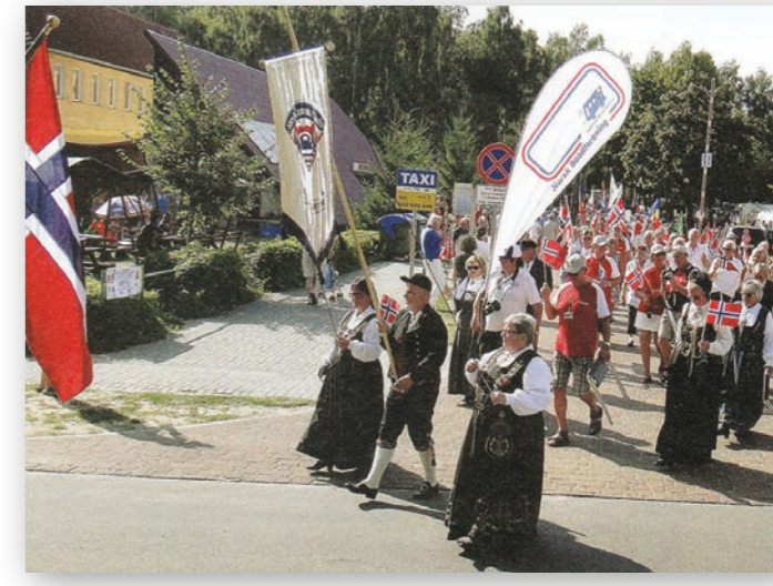
FICC Polen i 2013.

2014 – Jubileumsår igjen. Nå var vi blitt 30 år, og dette måtte