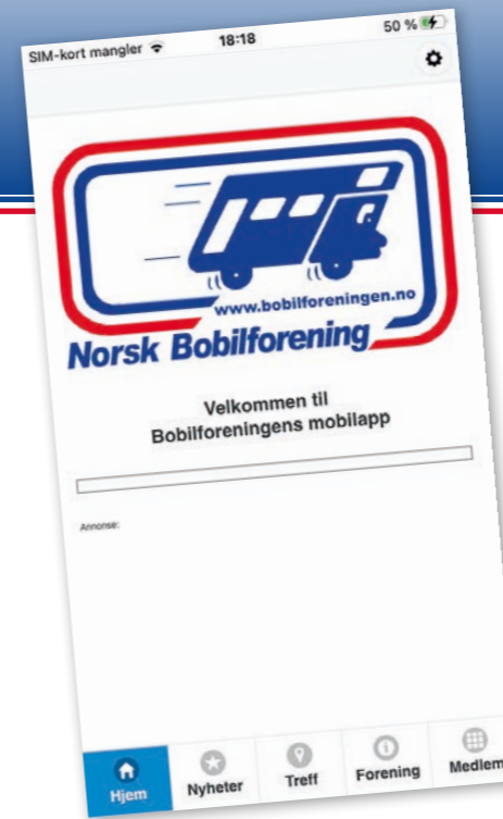
App som kom i 2014.

Landstreff imellom. Digitaliseringen går rasende fort. Nå har vi fått en egen side for å melde oss på treff - bobiltreff.no. Dette medførte