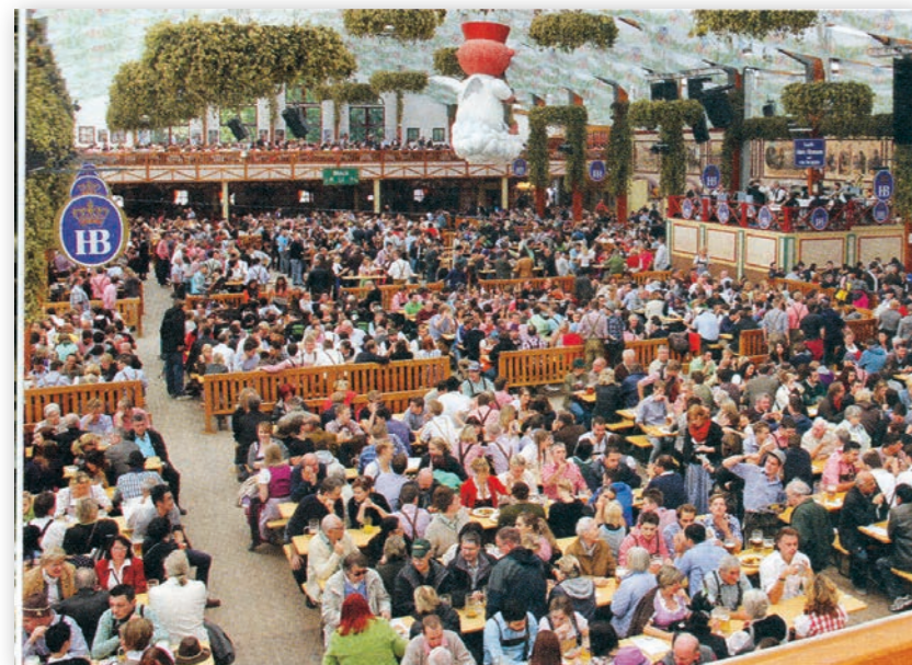
2014: Oktoberfestival i München. Det store ølteltet er i ferd med å fylles opp. Og der var det plass til ca 3000 mennesker.

behørig feires. Derfor inviterte vi våre nordiske venner til å feire sammen med oss, slik at vi fikk både Landsmøte og Nordisk treff samtidig i Fredrikstad. Men vi fikk ikke noe napp i pokalen, det var det Finland som fikk.