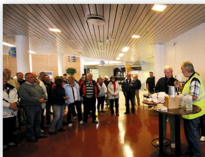
2012: Nordisk i Finland. Pokalen overleveres Finland.