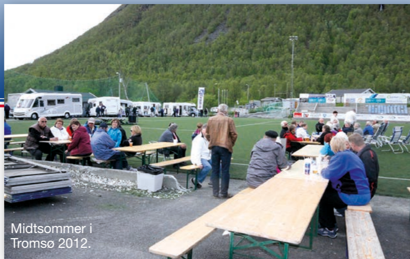
Midtsommer i Tromsø 2012.