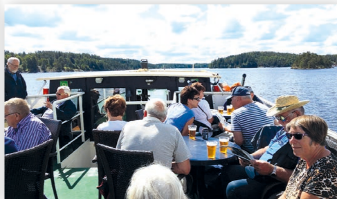
2014: På tur i Haldenvassdraget.

Landsmøtet i 2015 var på Bildøy utenfor Bergen. Av 10948 medlemmer var det bare 93 biler som fant veien til Vestlandet den gangen. Enda en gang kom spørsmålet om delegater opp, men ble heller ikke denne gangen vedtatt. Nå ble det bestemt at Landsmøte bare skulle avholdes hvert 2. år, men med et