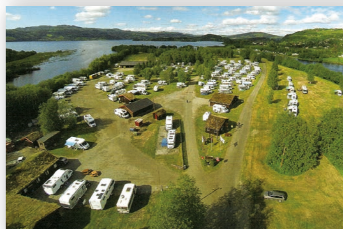
2013: Landsmøte på Årsøya.