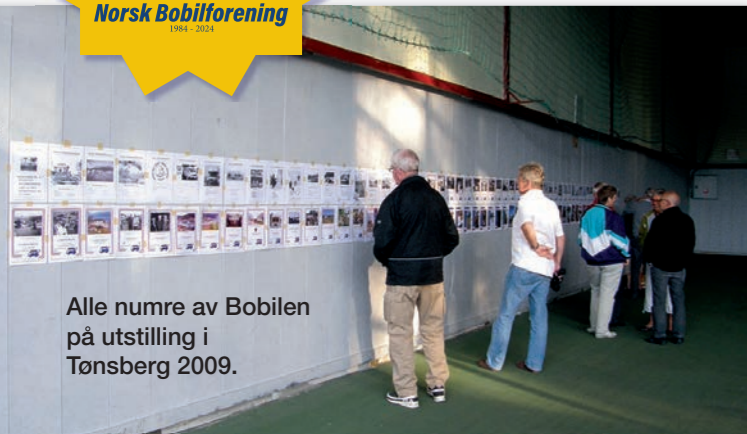
Alle numre av Mobilen på utstilling i Tønsberg 2009.