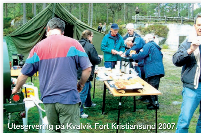
Uteservering på Kvalvik Fort Kristiansund 2007.