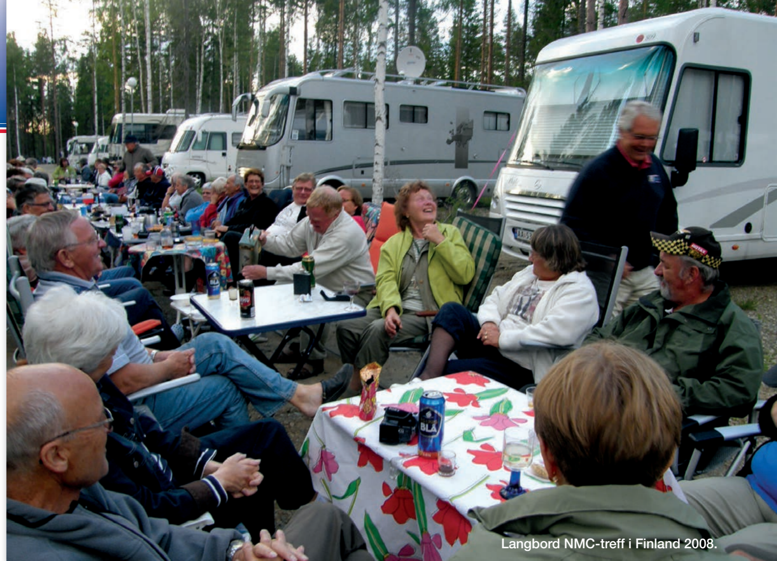
Langbord NMC-treff i Finland 2008.

Vi vil komme med historien for alle de 40 årene, i bladene i hele 2024. Ved 20-årsjubileet i 2004, ble det laget et jubileumshefte som dekket de første 20 årene. Dette er mer omfattende enn det vi kommer med nå for disse første årene. Det bladet kan du finne i bladoversikten i Gnist under 2004. Du vil også finne henvisninger til forskjellige numre av bladet vårt i teksten, disse vil du også finne i de respektive bladene. Kos deg med vår digitale samling av medlemsbladet.