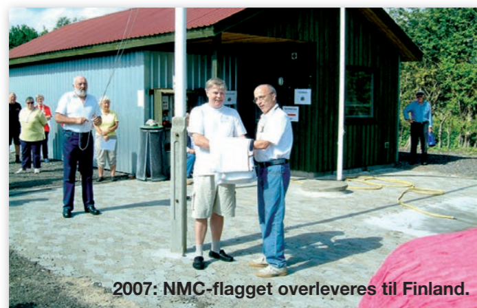
2007: NMC-flagget overleveres til Finland.