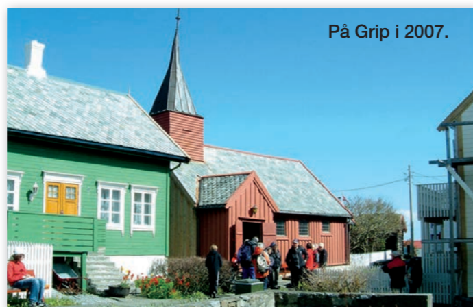
På Grip i 2007.