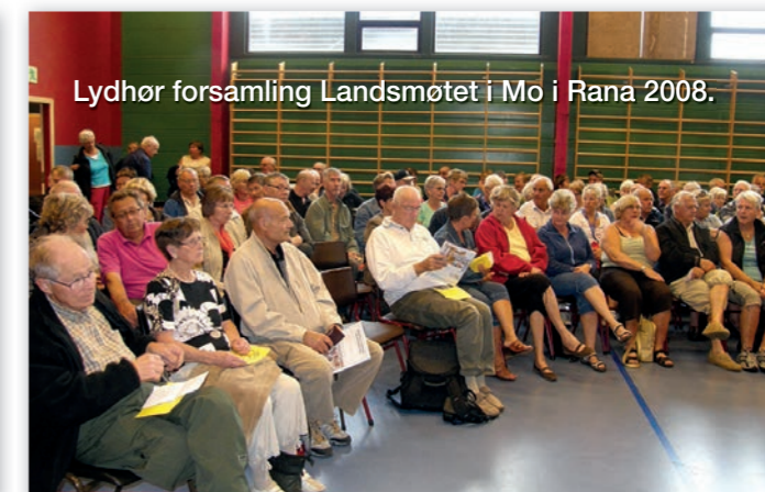
Lydhør forsamling Landsmøtet i Mo i Rana 2008.