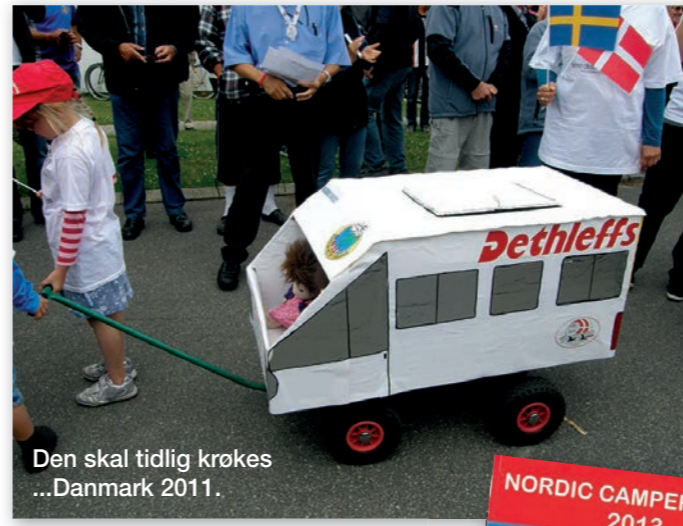
Den skal tidlig krøkes ...Danmark 2011.

Fredrikstad. Her var det mulig for medlemmene å besøke Servicekontoret og også overnatte hvis man ønsket det.