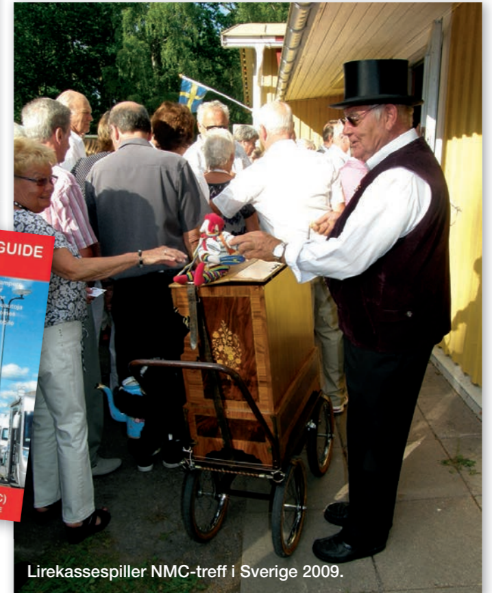
Lirekassespiller NMC-treff i Sverige 2009.