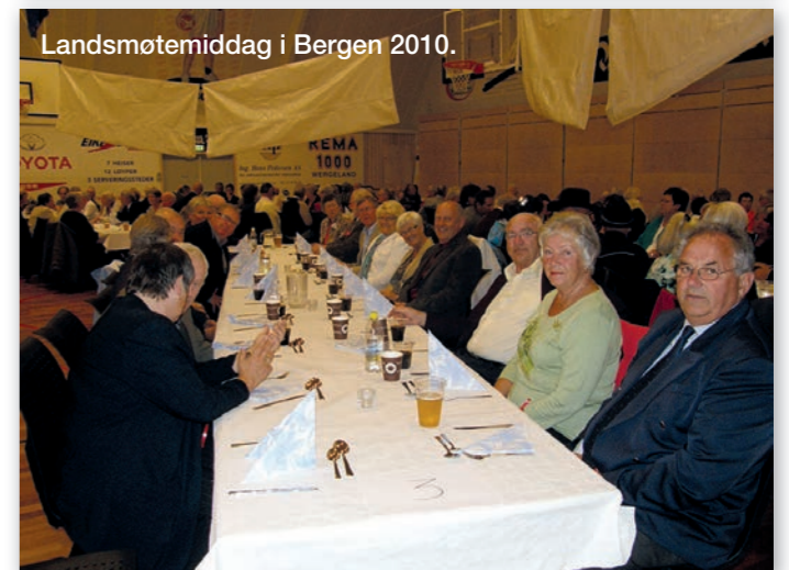
Landsmøtemiddag i Bergen 2010.