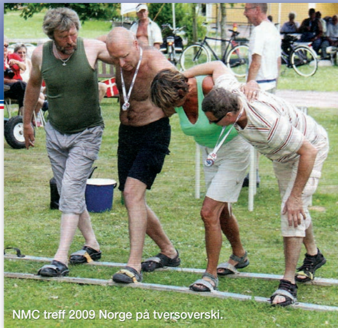
NMC treff 2009 Norge på tversoverski.