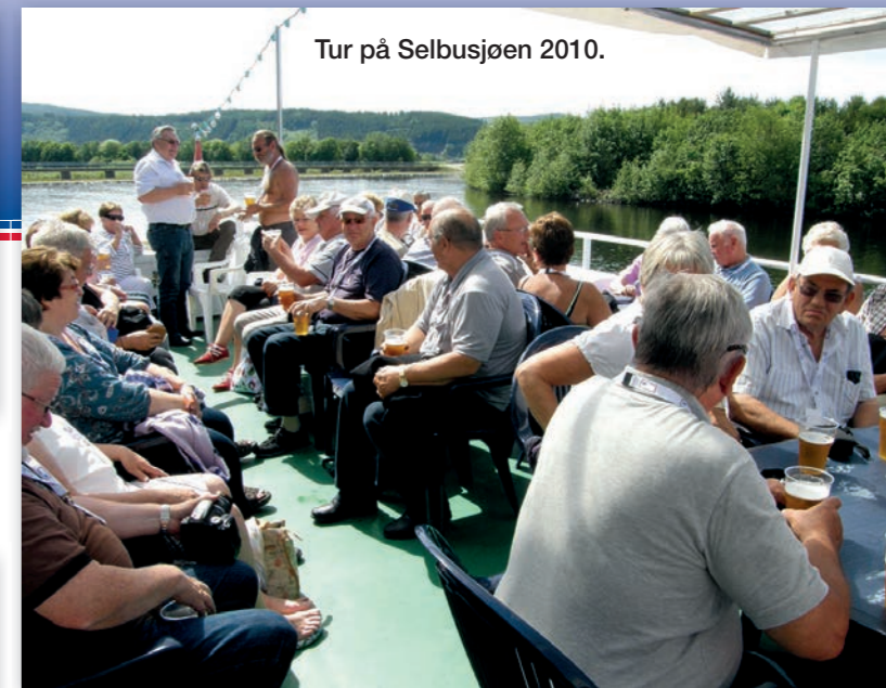
Tur på Selbusjøen 2010.