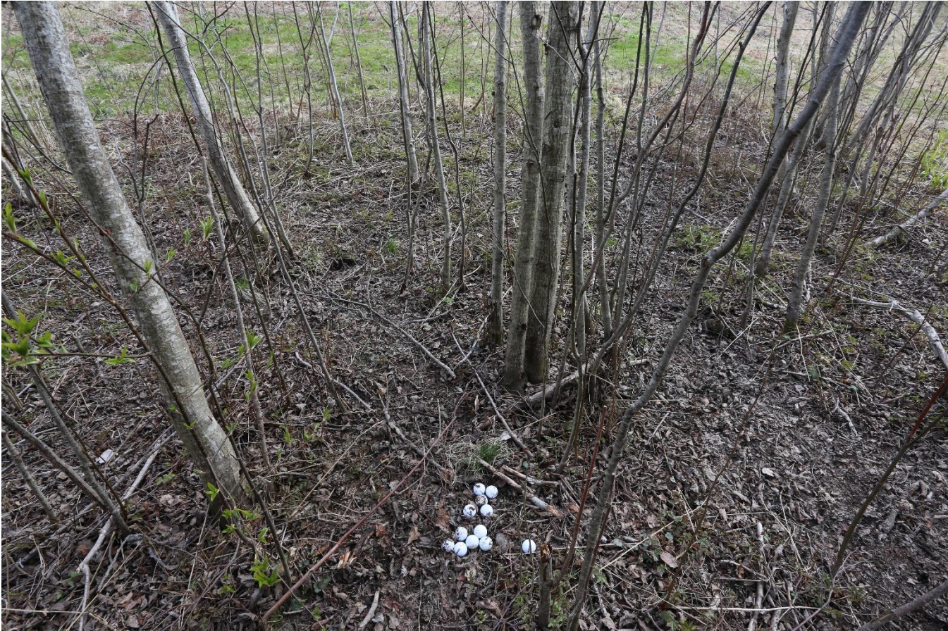
FOTO 23.04.2024 – «DRIVING RANGE»