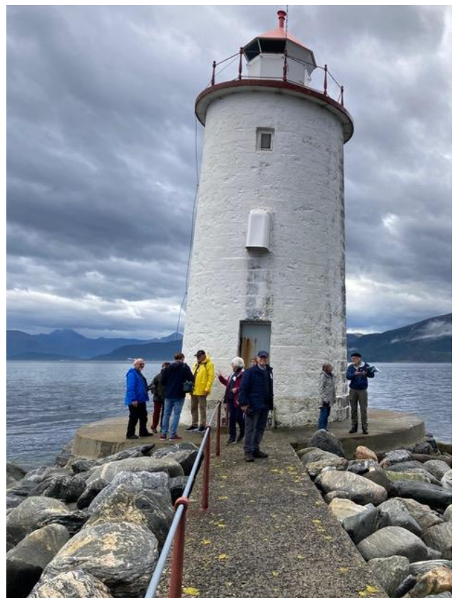
Høgstein fyr

Den første turen gjekk til Godøya 3. sept. (sjå referat) og den andre til Alnes 1. september.