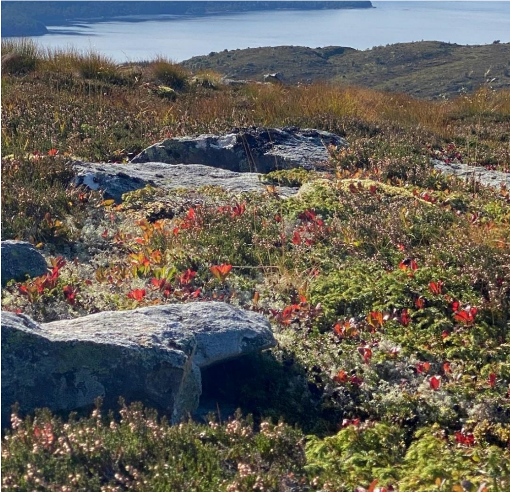
Månedens bilde fra ÅSU Digital foto Høst på Skulstadhornet