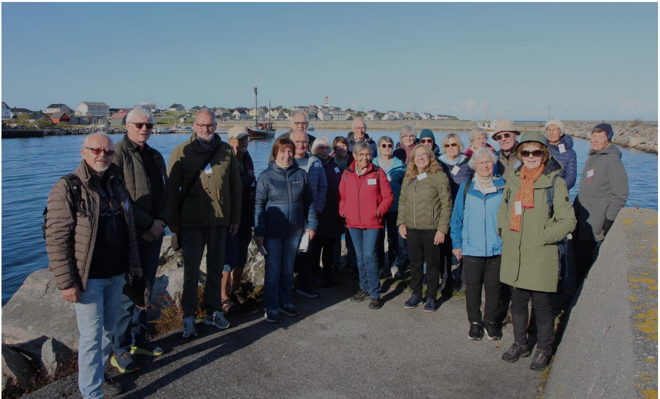
Gjengen som var på tur til Alnes i strålende ver.