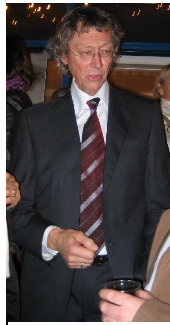
Knut Erik Jensen kjem på besøk tirsdag 15. oktober

Dette er eit flott høve for alle til å få møte denne unike filmregissøren og få delta i tankane bak den nye filmen.