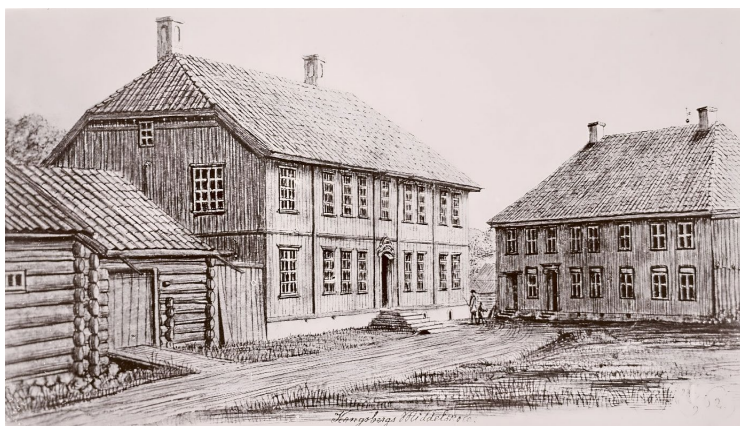
Gnr. 774, bnr. 391 Kongsberg middelskole. Tegnet av Prahm 1852