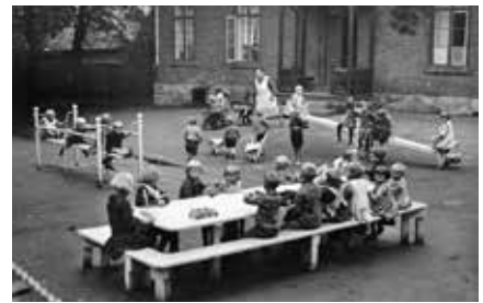
Dette bildet er fra Barneasylet på Enerhaugen i 1930.

I 1859 blir Grønland, Enerhaugen og Lakkegata en del av Kristiania og i 1878 er det Tøyen sin tur. Historien forteller at Kristiania ikke var så begeistret for å overta Grønland og det var forslag om å gjøre området til en «fristat». Men slik ble det ikke. Nå kommer folkevæksten for alvor. Kristiania går fra å være en småby til å ha rundt 200 000 innbyggere i 1880. Kommunen lager en stortilt plan for skoleutbygging. Først ut er Møllergata skole i 1861. Så kommer den nye og