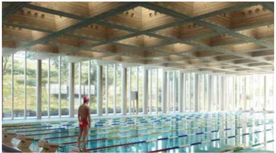
Slik ser det nye Tøyenbadet ut innvendig.

hele året. Flerbrukshallen, som skal bygges i tilknytning til badeanlegget, er tilrettelagt for innendørs ballidrett og får en spilleflate tilsvarende en håndballbane på 20 x 40 meter.