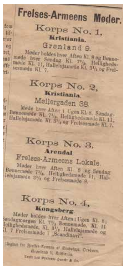
Frelsesarmeen vokste fort i Kristiania og flere korps ble opprettet.

selsarbeid (1920). Hun trakk seg tilbake fra aktiv tjeneste i Frelsesarmeen i 1904 og levde de siste 20 år av sitt liv i Sverige.