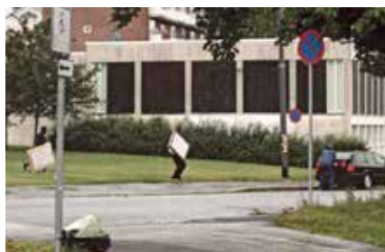
I august 2004 stormet to maskerte menn inn og stjal «Skrik» og «Madonna».

berteten» stjålet en onsdag formiddag fra en av utstillingssalene. Platen som hadde en verdi av om lag 50.000 kroner kom aldri til rette.. I 1998 kom det første store innbruddet. Tyvene tok seg inn gjennom et vindu og stjal bildet «Vampyr». Og i 2004 stormet to maskerte menn inn og stjal «Skrik» og «Madonna». Som resultat av dette ble vinduer murt igjen og sluser montert. Langaards idé om det åpne museumsbygget fikk en knekk.