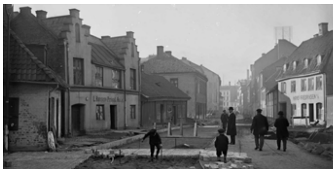
Hansens Privathotel i Vognmangsgaden.