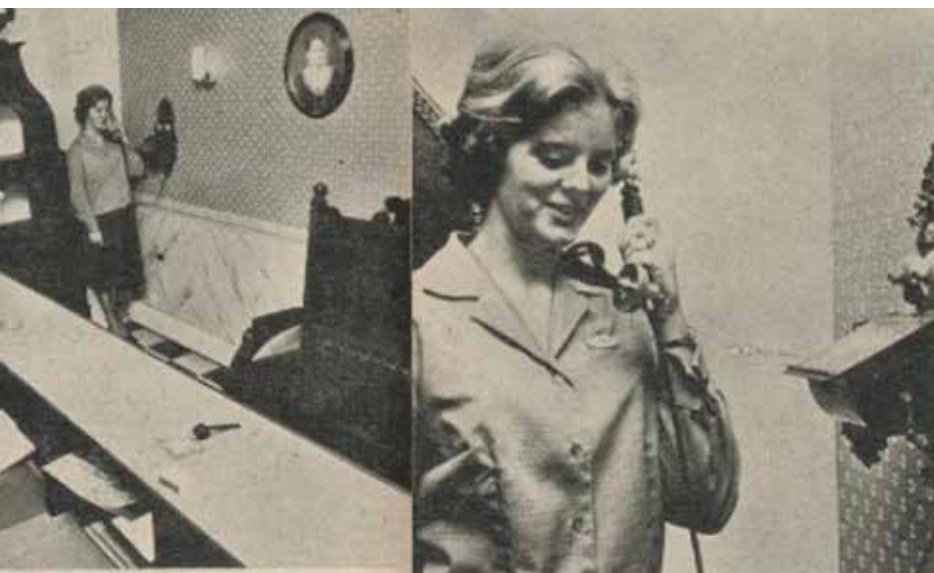
Danks nye filial på Enerbyens minste og mest ordisjonslokale. Hele interiøret er holdt i gammel stil. I bakgrunnen er fra 1783.

I Sørligata lå også butikken «Sørligatens Tobakk». Den hadde hyppige besøk av barn i området – og særlig av elever fra Tøyen skole som benyttet anledningen til å kjøpe seg en sjokolade, en is, sukkertøy eller kanskje et eple - eller en banan.