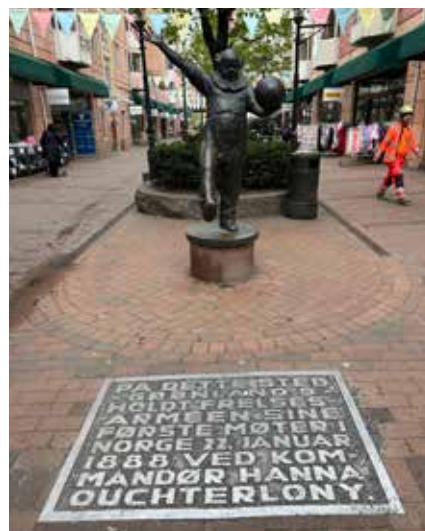
En minneplakett i bakken forteller om Frelsesarmeens etablering i Norge - 1888.