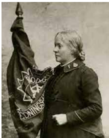
Ouchterlony hadde rang av kommandør.

Kristiania. Deretter fulgte en serie møter i andre byer på Østlandet, og allerede det første året ble det etablert 10 frelsesar-mékorps i Norge.