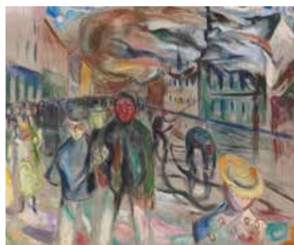
Brann på Grønland - 1919-1920 - heter dette bildet av Munch. Det er "tatt" nettopp fra vårt distrikt.

Men ikke alt gikk like bra. I 1968 innrømmet en betrodd medarbeider at han hadde stjålet 40 grafiske blad. Han tok ganske enkelt med et bilde i veska når han gikk hjem fra jobb. Det ble også avdekket at museet hadde lånt ut en rekke trykk til offentlige kontorer, skoler, mm. som man rett og slett hadde mistet oversikten over. Hvor mye kunst som forsvant på denne måten, er aldri blitt oppklart. Det var kort og godt en elendig kontroll. I 1972 ble originaltrykkplaten til litografiet «Pu-