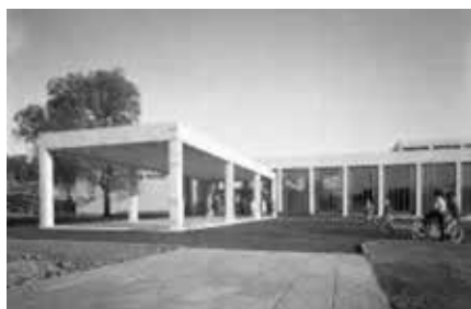
Museet var en flott og moderne bygning i hvitt som lyste opp i Tøyen-området.