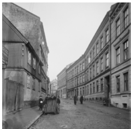
4. mars 1925 rykket to politibiler og en motorsykklet ut til Smedgaten 8 for å pågripe "Galmann"

en kvestet tollekniv. Sandsynligheten taler for, at morderen baade har brukt kniven og det mordredskap, han selv hadde laget sig, formodentlig i løpet av natten. Gulbrandsen var tilføiet et mængde saar og maa være død meget hurtig av det voldsomme blodtap. Hans lik blev nu baaret ned og bragt til lægevakten for obduktion.