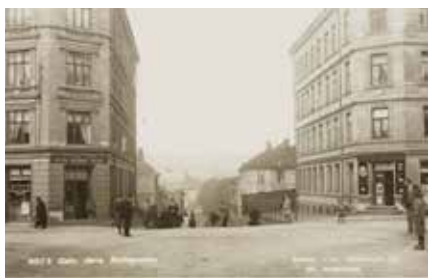
Dette er et gammelt bilde, et prospekt-kort fra Sørli plass med motiv mot Sørlibakken ned til krysset Tøyengaten/Jens Bjelkes gate.