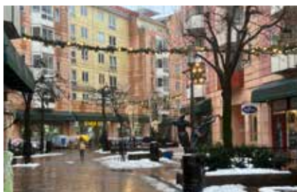
I dette området i Smalgangen på Grønland holdt Frelsesarmeen sine første møter.

Med Hanna Ouchterlony hadde den norske Frelsesarmeen fått en sjelden leder, som stod på natt og dag. Spesielt var hun opptatt av det sosiale arbeidet, og hun vek ikke et øyeblikk tilbake for den saken hun trodde på og arbeidet for: forkomne menneskers sosiale velferd og deres tro på en makt som var høyere enn dem selv – Gud. Ouchterlony var et levende eksempel på Bibelens ord om at "Kristi kjærlighet tvinger meg"; til tross for angrep, misforståelser, bakvaskelser