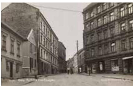
Her på enerhaugen foregikk det mangt og meget på første halvdel av 1900-tallet. Alt var ikke bare idyll, så langt der fra. Dette bildet er fra Enerhaugs plass.