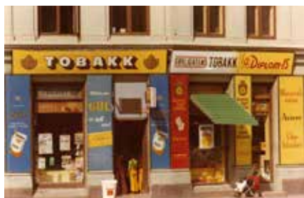
Sørligatens Tobakk for et yndet sted for områdets barn. Her vanket det is, sjokolade og kanskje et eple eller en banan.