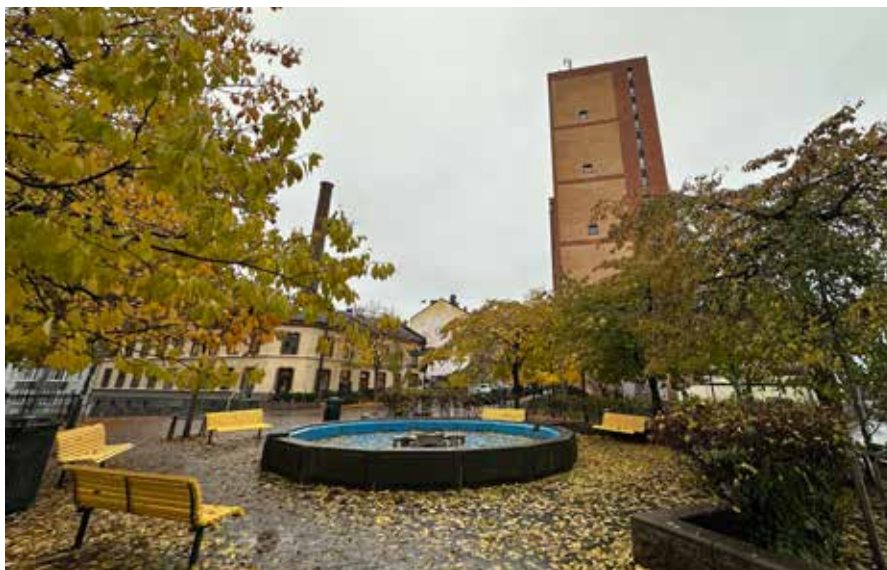
Fontenen på Sørli plass stod tidligere på Arne Garborgs plass.

Sørli plass er en plass i grenseområdet mellom Tøyen og Enerhaugen i bydel Gamle Oslo. Den ligger der Sørligata krysser Jens Bjelkes gate.