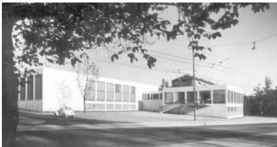
Slik så Munch-museet ut da det var ferdig bygget.

Tanken om et eget museum for Edvard Munchs kunst hadde vært diskutert flere ganger før krigen. Direktøren på Nasjonalgalleriet, Jens Thiis, ivret for et eget bygg på Tullinløkka. Han korresponderte med Munch om dette. Det er en noe ambivalent kunstner som i et brev skriver at - skal det bygges et museum for min kunst, så må det være et stort museum. I andre brev sier at han har mistet troen på at det kommer et museum og at han vil ha fred til å konsentrere seg om sitt kunstneriske arbeid. Direktør Thiis var imidlertid en handlekraftig mann, og hadde ikke krigen kommet, kan det godt hende at museet på Tullinløkka hadde blitt en realitet. I 1946 mener mange at et museum bør komme i tilknytning til