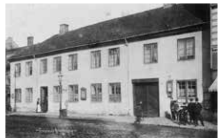
Dette er Asylet i Grønland 28. Bygningen har vært brukt til tinghus, arrest, barneasyl, forbedringsanstalt, skole, diakonisesykehus, aldershjem, bank og herberge. Grønland 28 er et av Grønlands viktigste kulturminner. Bildet er tatt ca. 1910.

flotte Grønland skole i 1868. I dag er den kjent som FAFO-bygget i Borggata. Tøyen skole blir bygd i 1882, Vahlsgadens skole i 1897 og Lakkegata skole i 1902. Noen år seinere, rundt 1920 har Tøyen skole alene omkring 2000 elever. Men det er en annen historie.