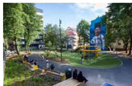
Sørli lekepark - midt på Tøyen.