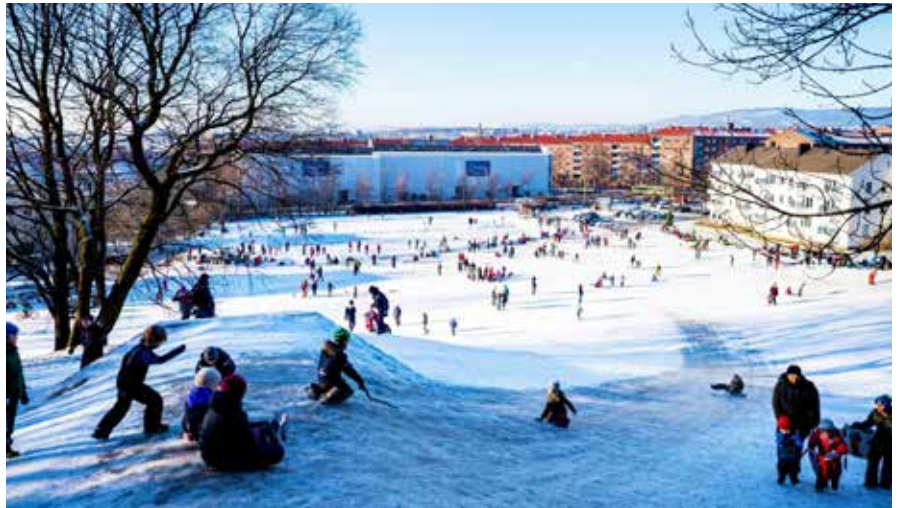
Vinter på Ola Narr.

Utebadet vil ligge i parken mot sør, og deler av familiebassenget inne forlenes i et utebasseng som vil være åpent