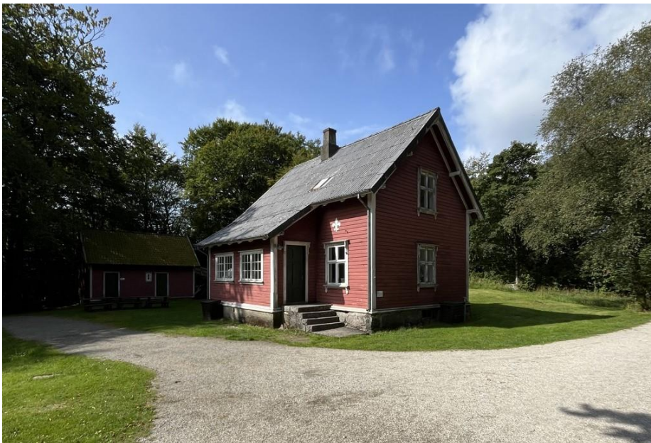
Maurholen stasjon

Bli med på tur til Maurholen ved Egersund torsdag 5.september