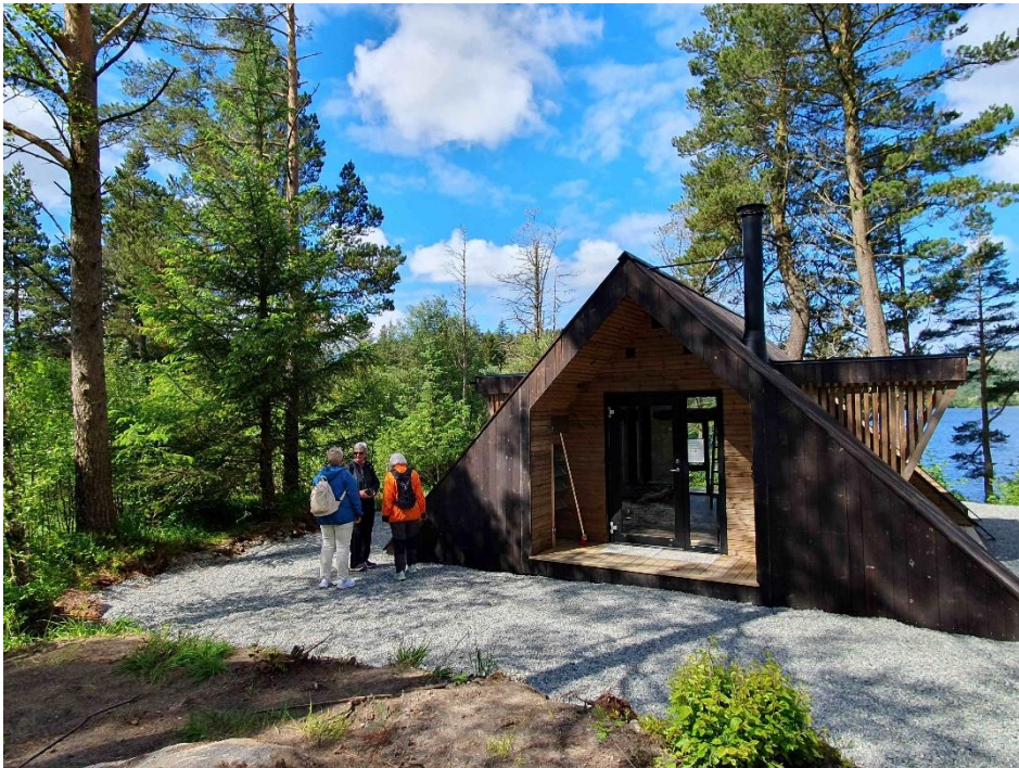
Nyoppført dagsturhytte

Lunsj ble spist ute, sittende i ly på benker i den nyoppførte dagsturhytten. Medbrakt niste smakte godt etter turen.