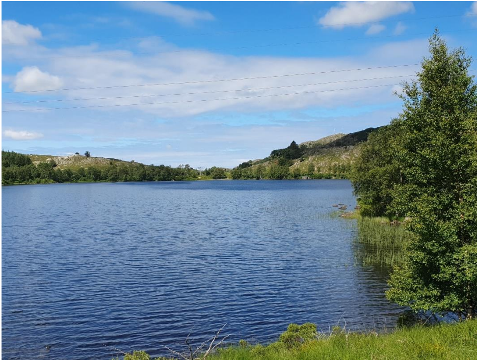
Melsvatnet i blåtoner