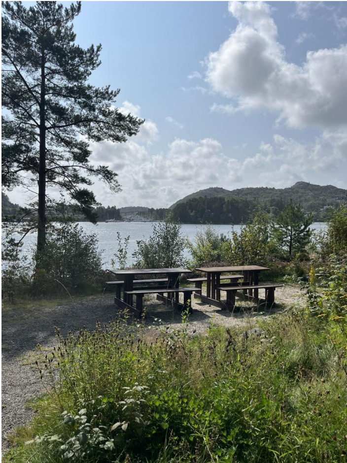
trivelige rasteplasser på veien

Velkommen til en lett tur langs deler av kystpilegrimsleia med utgangspunkt i gamle Maurholen jernbanestasjon. Det er den gamle Jærbanen som er gjort om til tur og sykkelvei og er veldig fin å gå. Turstien går gjennom de gamle skjæringene i fjellet, gjennom skogen og stedvis flott utsikt til fjorden. Det er litt stigning de siste 500m hvor turstien krysser den nye jernbanelinjen 2 ganger. Vi går ca 2,5 kilometer til en av rasteplassene med best utsikt og nyter medbrakt mat og drikke.