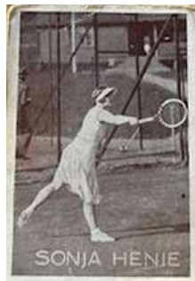
Sonja Henie «Som hennes anden idrett nevnes tennis» I 1929 3dje best i NM