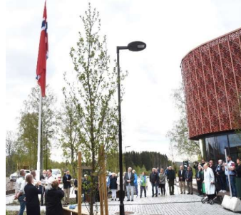
Flaggheising ved kommunehuset