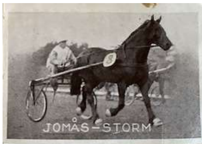
Jomås-Storm, debuterte i 1930

Dette er antagelig bilder som fulgte med tobakkseskene for en del år siden, og lenge før tobakksreklame ble ulovlig.