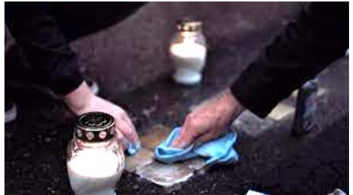
Pushing av snublesteiner.

de. Kampen klarer seg selv, men hele Tøyen og Grønland er mitt nedslagsfelt.