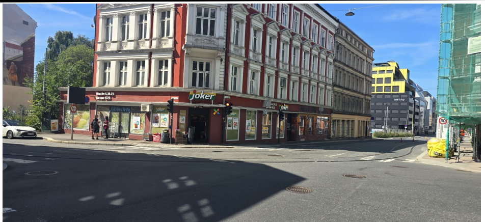
Krysset Schweigaards gate/Grønlandsleiret/Oslo gate.

Vi skriver om Hovinbekken i dette Historiebrevet. Hovinbekken har definert Gamlebyens nordgrense mot Grønland. Den har hatt en rekke sidebekker som idag er lagt i rør. Fram til nedre del ble lagt i rør og ført over til Akerselvas utløp, hadde den utløp i fjorden der hvor dagens kryss Schweigaards gate/Grønlandsleiret/Oslo gate er.