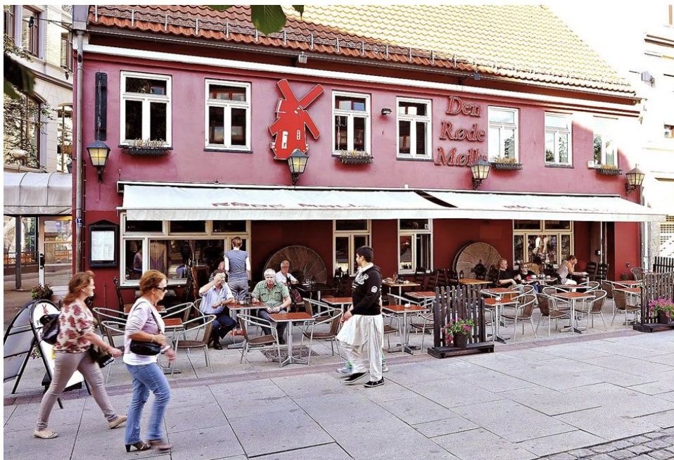
Den Røde Mølle i Brugata 9 i 2012.

kriminelle og livets lyssky damer og ville fugler. Alkohol, sex og «surring» var en stor del av repertoaret, særlig på Lilletorvet, i de sene kveldstimer. «Å bli surret» betydde at den stakkars fulle bondetampen ble surret rundt igjen og igjen i sirkelen av en