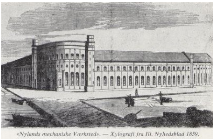
«Nylands mekaniske Værksted» - xylografi fra Ill. Nyhedsblad 1859.