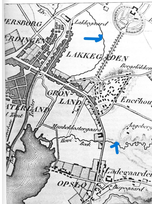
Grønland med omgivelser 1827. Kart av Hagelstam. UBO.

Bekken ble i tidligere kjent som Lortbekken da den tok med seg mye kloakk nedover. Det skapte utrivel-