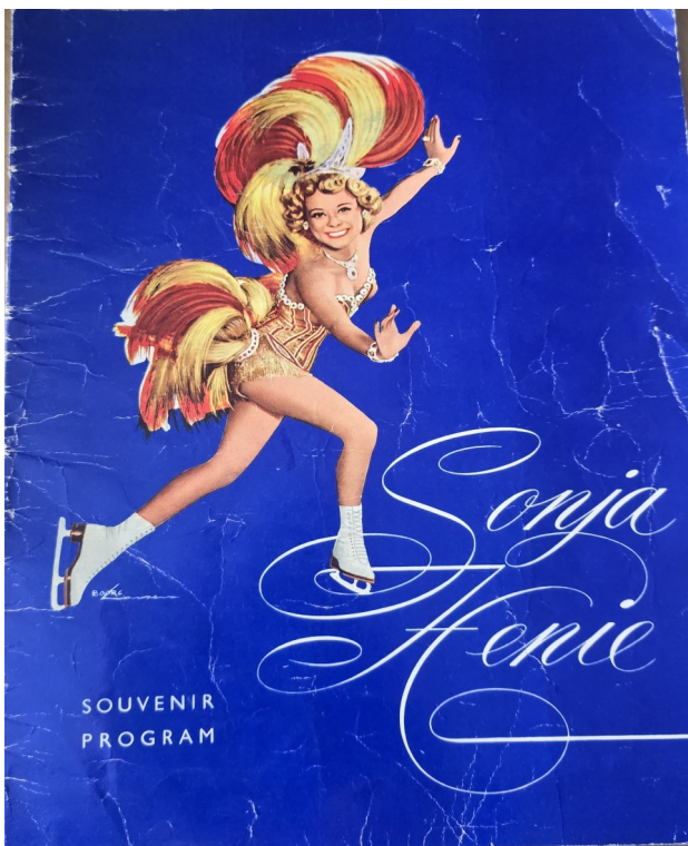
Det omfattende programmet fra Showet—over 20 sider. Forestillingen var delt i 1. og 2. akt—totalt 19 innslag.

Det brakte fram minner om lek på skøyter på isbaner på Tøyen. De kommunalt anlagte skøytebanene om vinteren, og på den som nå kalles «Sirkustomta», var populære for både lek og spill for gutter og jenter. Guttene med ishockey- eller bandykøller og jentene med danseskøyter. Det var nok slik at gutta drev sitt spill på størstedelen av banen, mens jentene måtte nøye seg med en ganske liten del. Slik var gjerne forholdet den gang.