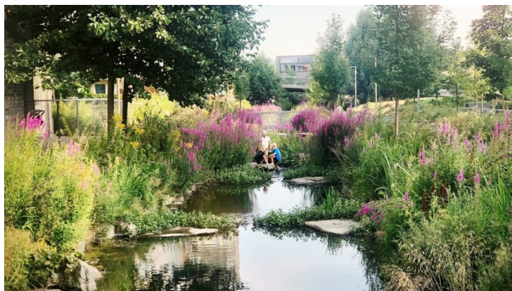
Gjenåpningen av Hovinbekken fra Hasle T til Ensjø T hedres med Oslo bys arkitekturpris for ny og god arkitektur. Fra Aftenposten.

elva og ut til området der benediktinernonnene holdt hus. I den historiske romanen Kristin Lavransdatter av Sigrid Undset omtales elva. I romanen skriver Undset utførlig om Kristins første stevнемøte en kveld/natt i Urtehagen i Klosterenga. (kap.III).