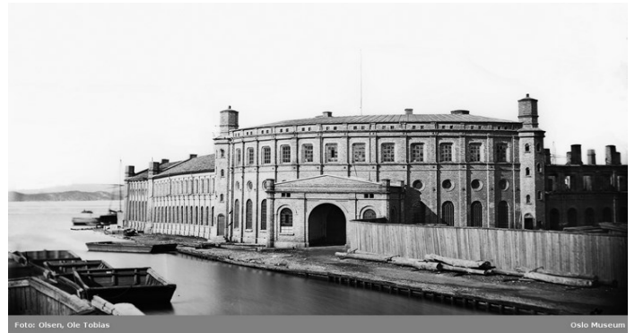
Nylands Verksted

1860, og i 1861 kunne byggenummer 1, D/S «Engebret Soot» leveres. Samme år leverte verftet også taubåten D/S «Gan». Verdens første spesialbygde hvalbåt, D/S «Spes & Fides», ble levert til Svend Foyn i 1863. Plasseringen av verkstedet var meget gunstig der det lå ved utløpet av Akerselva, der den nye Operaen ligger. Den enorme ekspansjonen i handelsflåten etter 1850, og omleggingen til stål og damp gjorde Nyland til et ledende skipsverft. Bl.a. ble de første dampskipene til skipsreder Fred. Olsen bygd her (Bayard, Bonheur, Balduin). Foruten skip laget man maskiner til treforedlingsindustrien, mudderapparater, jernbanevogner m.m., senere også reservedeler til dieselmotorer.