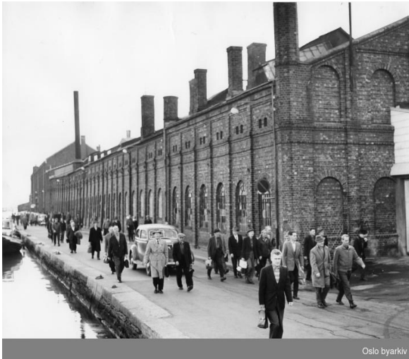
Nylands Verksted ved arbeidshagens slutt 1962