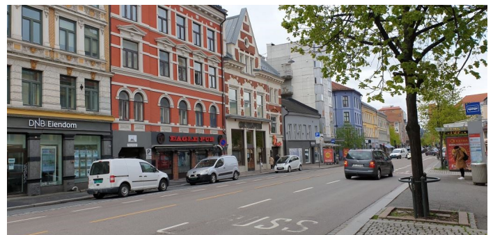
Grønland 2020.

Det er ca. 10 000 personer og ca. halvparten har innvandrerbakgrunn. Grønland-området har flest innvandrere i Bydel Gamle Oslo. Det er somalierne som flytter inn og pakistanerne flytter ut. Inn og utflytting skjer mest i årsklassene 25 år-40 år.