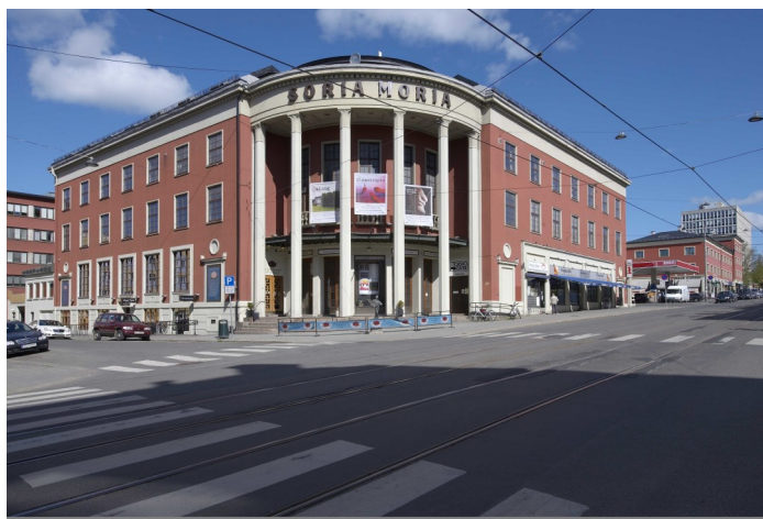
Soria Moria.

Alle tre var premierekinoer med repertoar som Tatt