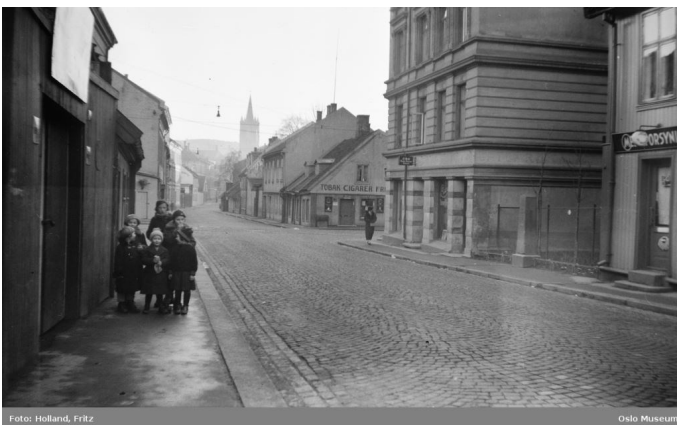
Norbygata ved Motzfeldts gate og bauta for Ole Gudmundsen. 1937. Foto: Fritz Holland. Oslo Museum. (Fri bruk).

Boligbyggingen hadde nærmest eksplodert, men det var en type boligbygging som hadde skapt trangboddhet og dårlige levekår. Om kommunale midler var knappe på 1800-tallet ble det enda vanskeligere etter unionsoppløsningen i 1905 og så kommer første verdenskrig, dyrtid og de harde 30-årene. Diskusjonen startet allerede på 1920-tallet om man skulle rehabilitere eller rive områder av Oslo. Og rivningen startet allerede på slutten av 30-tallet i området