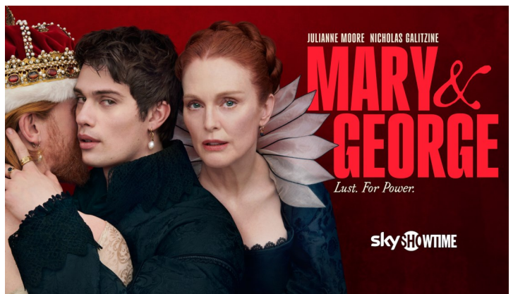
Serien Mary & James.

Reformasjonen i 1537 førte til dramatiske endringer på flere hold. Alle Norges biskoper ble avsatt og alt kirkegods inndratt av kongen. Nesten hele Oslos bispeborg ble revet, bare "tårnet og stehuset inntil" fikk stå. Disse ble senere brukt som grunnmur for borgermester Christen Mules renessansehus, som tok form omkring 1579. Vi vet ikke så mye om hvordan denne bygningen så ut, men den må ha vært ganske staselig.