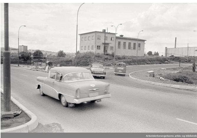
Laura /Lørenhallen) forsamlingshus og kino.

« Laura » (eller «Lauar'n») Lørenhallen kino var en privat eid kino. Vi kalte den «Laura». Andre i områder sa «Lauar'n». Kinoen hadde forestillinger hver