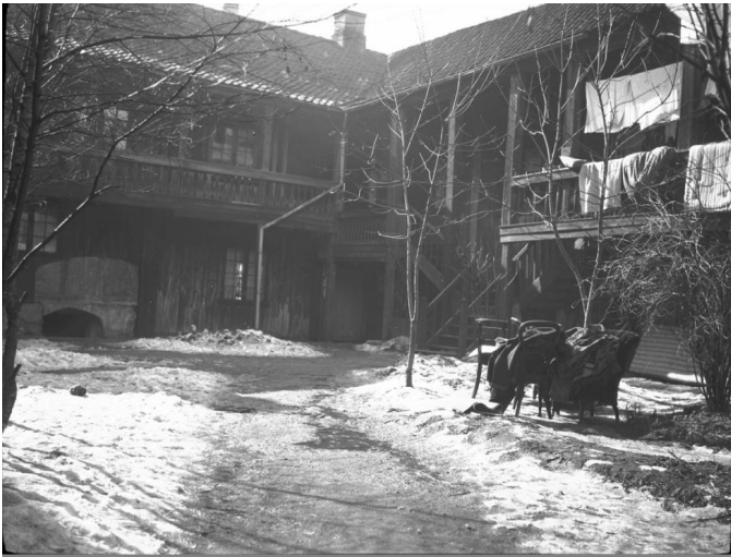
Grønland gamle hjem (nåværende Asylet) 1921. Foto Caroline Colditz. Oslo Museum. (Fri bruk)

Boligbyggingen hadde nærmest eksplodert, men det var en type boligbygging som hadde skapt trangboddhet og dårlige levekår. Om kommunale midler var knappe på 1800-tallet ble det enda vanskeligere etter unionsoppløsningen i 1905 og så kommer første verdenskrig, dyrtid og de harde 30-årene. Diskusjonen startet allerede på 1920-tallet om man skulle rehabilitere eller rive områder av Oslo. Og rivningen startet allerede på slutten av 30-tallet i området