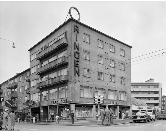
Ringen kino på Carl Berners plass.

På 1950-, 1960- og 1970-årene var det flere kinoer i vårt nærområde. Riktignok var det ingen innen det som vi nå omtaler som EGT-området, men det var kinoer rundt i randsonen. Det var populært å gå på disse kinoene i barne- og ungdomstiden. Flere kinoer lå i gangavstand eller kunne nås på sykkel. Det var forholdsvis kort vei til Jarlen kino, Ringen kino, Sinsen kino og «Laura», Litt lengre var det til Soria Moria, Parkteatret, og Sentrum kino. Du lurer kanskje på hva «Laura» var og lå? Det kommer om litt!