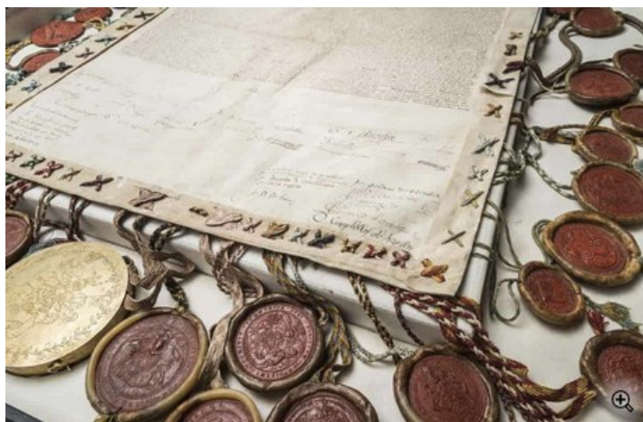
Ekteskapskontrakt mellom James 6. av Skottland og Anna av Danmark.

Beretningene forteller at kongen og hans selskap steg inn i den lille byen på østsiden av Bjørviken 19. november klokka 16.00, tiljublet av frammøtte Osloborgere. 23. november 1589 sto bryllupet i hallen i den gamle bispegården. Så langt det lot seg gjøre,