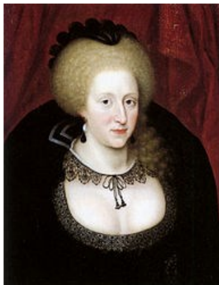
Anne av Danmark i sorg. Ca 1612.

Det var ikke småting de over lang tid hadde forhand-