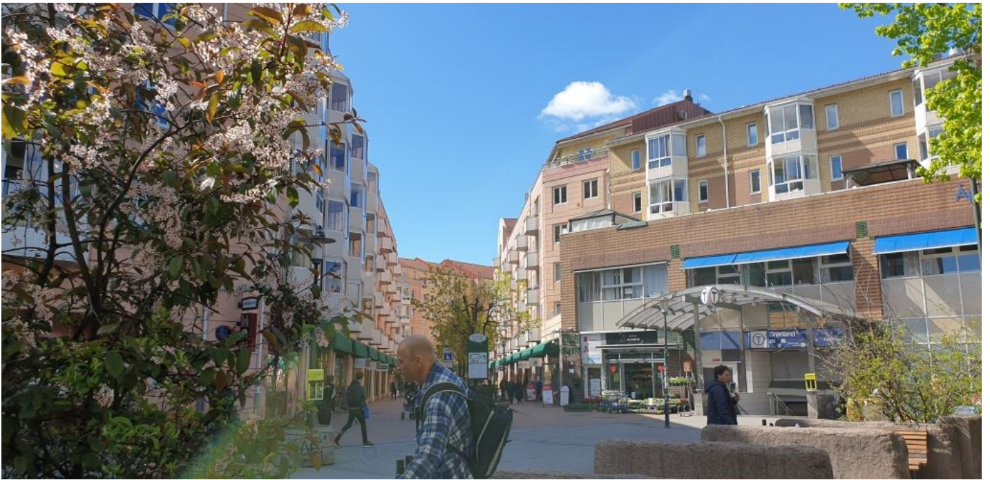
Grønland Torg, Smalgangen 2020.

dustri, handel- og håndverksbedrifter helt opp til den utenlandske innvandringen skjøtt fart for 50 år siden. Etter den tid har mangfoldet utviklet seg, og det er neppe noe annet sted i Norge at man på et såpass lite område kan møte så mange forskjellige folkeslag og kulturer. - Og det er alt dette jeg nå brenner for.