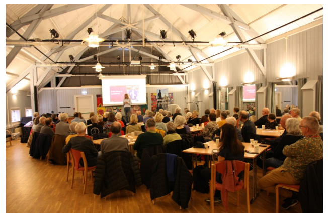
En lyttende forsamling til Aslak Sira Myhres foredrag.

mest profilerte foredragsholder vi har hatt i EGTs historie. Dette «scoopet» er vi veldig glade for – og ikke så lite stolte over, heller. 60 tilhørere lyttet intenst i 1 time. Takk til Sira Myhre.