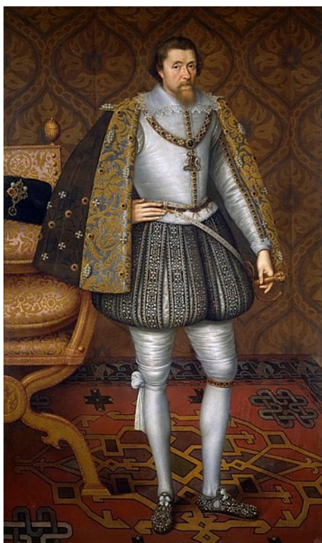
James 6 og 1 av England malt av John de Critz ca. 1605. Museo de Prado.