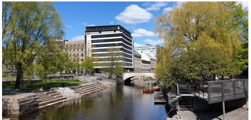
Vaterlands bru og Vaterlandsparken. 2020.

Og hva med det som dominerer i avisoverskriftene jeg startet med? Ja - det er narkohandel ved Nylandsbrua og i Olafiagangen. Ja - det vanker mange