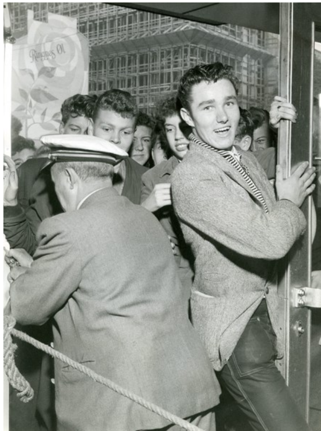
Kino-vakta hadde utfordringer i døra til Sentrum kino denne dagen.

kom til Norge. Etter filmen var det opptøyer på plassen utenfor. Ungdommen lagde bråk, en bil ble veltet og ruter knust. Politiet måtte til, ridende på hester for å roe gemyttene for en stund. Sammen med Ringen og Jarlen ble den nedlagt i 1988. Nå har stedet blitt renovert og oppstått som Sentrum scene, en rockeklubb og filmklubb.