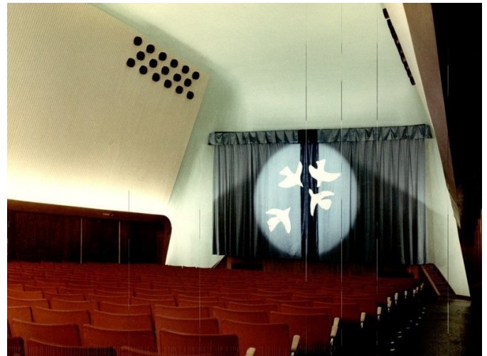
Jarlen kino – sal og scene etter ominnredning 1960.

De tre kinoene ble alle etablert som bydelskinoer. De