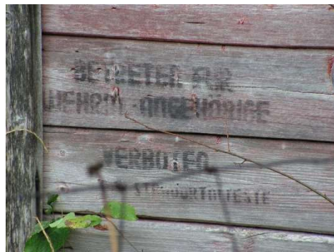
Krigsminne på en vegg i Stensgård.

Tyske soldater og befal ble innkvartert i flere av husene tross befolkningens protester. Selvsagt slapp de som hadde medlemsboka for N.S. både innrykk av tyskere og tyskertøser. Det hele er som en vond drøm som først ble slutt da freden kom. Enda er så vidt vites ingen av eiendommene frigitt. Befolkningen venter at det snart vil skje.