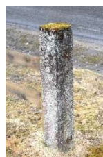
Fra venstre: Portstolpe fra Nannestad Cementvarefabrikk Hageheller og portstolpe fra Røtterud Betongindustri