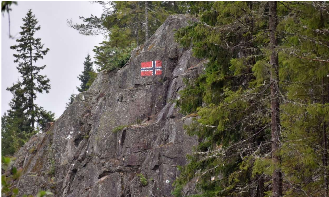
Flagget på Minneåsen.