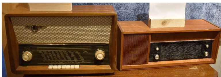
Til venstre: Radionette Duett, 1960-61, og Menuett, 1969