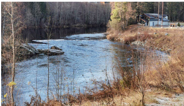
Kloppfoss, vannføringen skjuler fossen

Her vises Øya, evja og det som ble kalt Tislebekk på kart over Tislegårds eiendom i 1754, et navn som satte i gang livlige fantasier.