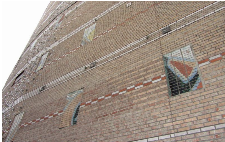
Oslo Spektrum, åpnet 1990.

drev brukene og som vekslet mellom teglverksarbeid om sommeren og skogsarbeid om vinteren.