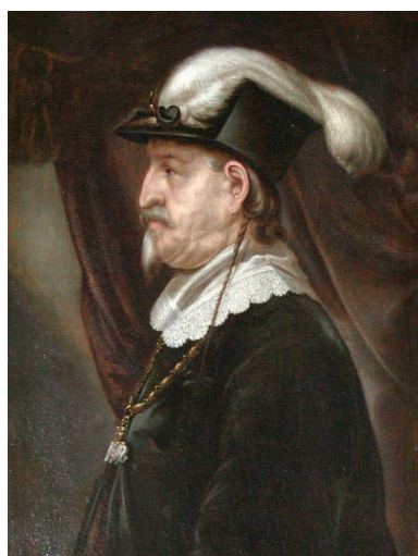
Christian 4. malt av Karel van Mander III.