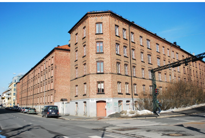
Gårdene i Jens Bjelkes gate 14, 16 og 18. Sars gate går opp til høyre

Et godt eksempel på bruk av tegl er Gråbeingårdene i Oslo (Urtegata 36, Tøyengata 36-40, Herslebs gate 32-34, Jens Bjelkes gate 14-18 og 37-39, Lakkegata 71-75, Siebkes gate 1-5 og 4-6 og Sars' gate 2). Disse byggene var upusset og uten noen form for dekorasjoner, i en tid da puss og stukkaturer var det normale for bygårder. Men fraværet av puss kan også oppfattes slik at gårdene ble oppført med teglstein av bedre kvalitet enn vanlig. OBS! Vi planlegger Gråbeinmøte til høsten.