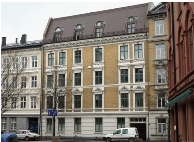
Jens Bjelkes gate 76.