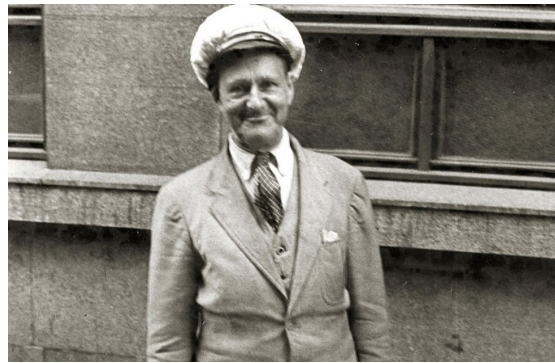
«Sving deg» i sitt rette miljø.