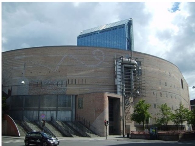
Oslo Spektrum.

Et eksempel på en flott kombinasjon av teglstein og