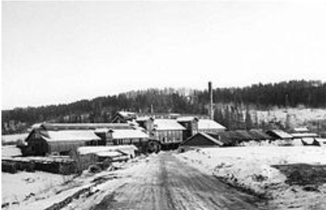
Alna teglverks fabrikkområde i Strømsveien i Oslo fotografert i 1966.

Temaet teglverk er ikke så aktuelt for vårt område som sådan, men teglverkens betydning for byggevirksomheten i området er stor. Ingen av de teglverkene som er nevnt i listen over teglverk i Oslo er i vårt område, men lå i en ring rundt EGT-området.