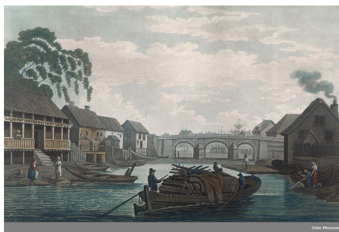
Vaterlands bru – Fra ca 1800. Litografi av John-William Edy. Oslo Museum. (Fri bruk).

Christiania skulle bygges og utvikles. Til det trengtes arbeidsfolk og de var heller ikke velkomne i den nye byen, men leide seg derfor inn i forstedene. Frem mot starten av 1800-tallet vokser det derfor frem også en forstad i Grønlandsområdet og rundt Vaterlands bru.