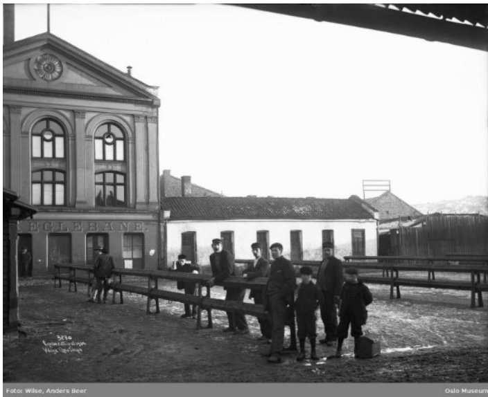
Fryshall: 1904.

Midten av 1800-tallet er også tiden for urolighet i Europa (1848 revolusjon). I Norge er det nå de første store landsomfattende folkebevegelsene oppstår. Haugianerne med Hans Nielsen Hauge startet opp på begynnelsen av århundret og deretter fulgte thra-nittene og Marcus Thranes arbeiderbevegelser. Det fortsetter med avholdsbevegelsen, flere religiøse folkebevegelser og kvinnebevegelsen. For dem alle er Grønland et sentralt område.