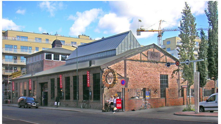
De tidligere lokalene til Oslo Elektriske Sveiseverksted, Tøyenbekken 34. På bildet «Det Åpne Teater». I dag Dramatikkens hus.

På et ellers svært forandret Grønland ligger et særpreget industrianlegg fra 1880-årene. Hovedanlegget ble reist i 1918. De sentrale bygningene er bevart og er nå gjenbrukt som teater og kulturhus. Den gamle verkstedbygningen i teglstein blir nå betegnet som Dramatikkens hus. I de samme lokalene holdt tidligere Det Åpne Teater til - som ble nedlagt i 2009.