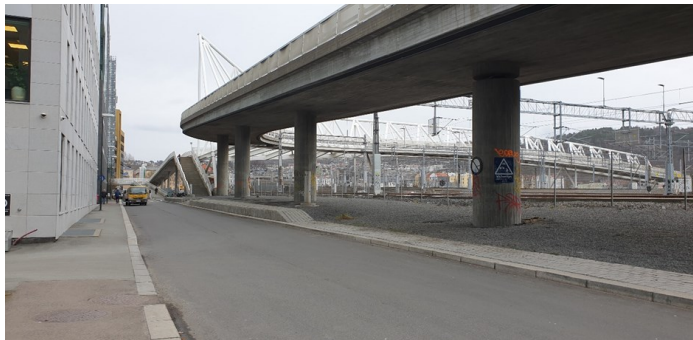
Gatestump—foreslått navnsatt «Tilla Valstads gate»..

Ja hvorfor sier vi i EGT nei takk til det? Hun var jo et strålende menneske som arbeidet for at barn og unge i Vaterland og Kristianias østkant skulle komme ut i sol, natur og landlige omgivelser. Hun fortjener en gate oppkalt etter seg.