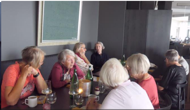
Lønsjing på Laholmen

Tordenskiold klarte ikke å holde fingrene unna Strømstad som var en hovedbase for angrep på Norge. De danske skipene gikk ut fra Fredrikshald og natten til den 8. juli ble de varpet inn mot Strømstads havn, der de ved 4-tiden om morgenen ankret opp og begynte å beskytte havnebefestningene. Linjeskipene konsentrerte seg om det kraftige Carolus-batteriet med dets 14 attenpundskanoner på Laholmen, og skytsprammene på de øvrige batteriene. Etter noen