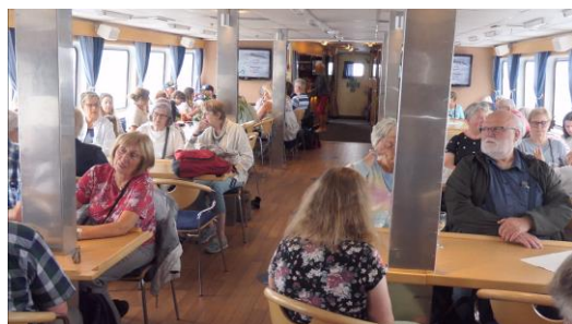
Ikke veldig tax-fritt mellom Strømstad og Skjærhalden.

timers beskytning ble seks galeier sendt inn for å la sine medbragte soldater gå i land på Laholmen. Forsvaret var imidlertid ikke nedkjempet og bare to galeier lyktes i å ta seg inn til stranden med robåter. Der ble utsatt for heftig beskytning av svensk infanteri. De tusen danske stormtropper som tok seg inn mot havnen, mislyktes. Danskene ble tvunget til å trekke seg tilbake med et tap på 350 mann. De svenske tapene var vesentlig mindre. Ingen svenske krigsskip var i kamp ved Strömstad. Danskene ble tvunget til å trekke seg tilbake med et tap av 350 mann.