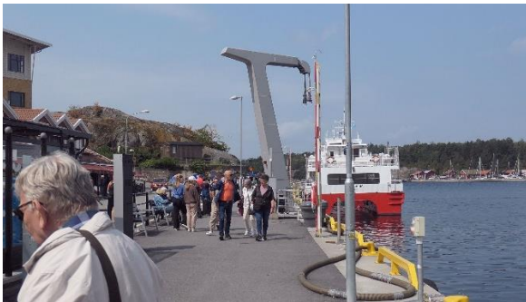
Strømstad. Brygga til kosterbåtene.

Man kan like det eller ikke like det, men det er vel ingen tvil om at det er Strømstad flest nordmenn tenker på når vi snakker om shopping og grensehandel og Sverige? Byens innbyggere tenker tydeligvis det samme. Det er nordmenn over alt, og gode «norske» tilbud finnes på nær sagt hvert gatehjørne..