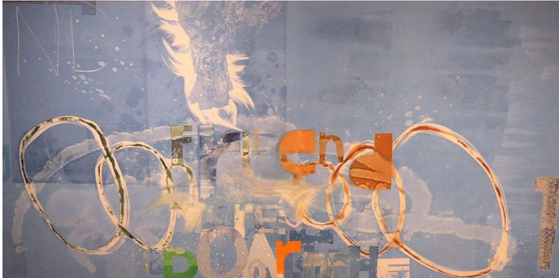
Et av hovedverkene til Furuholmen.