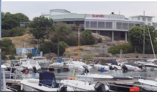
Laholmen hotell hvor vi skal ha lunsj.