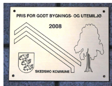
Sagelvas Venner mottok Byggeskikkprisen fra Skedsmo kommune 2008.