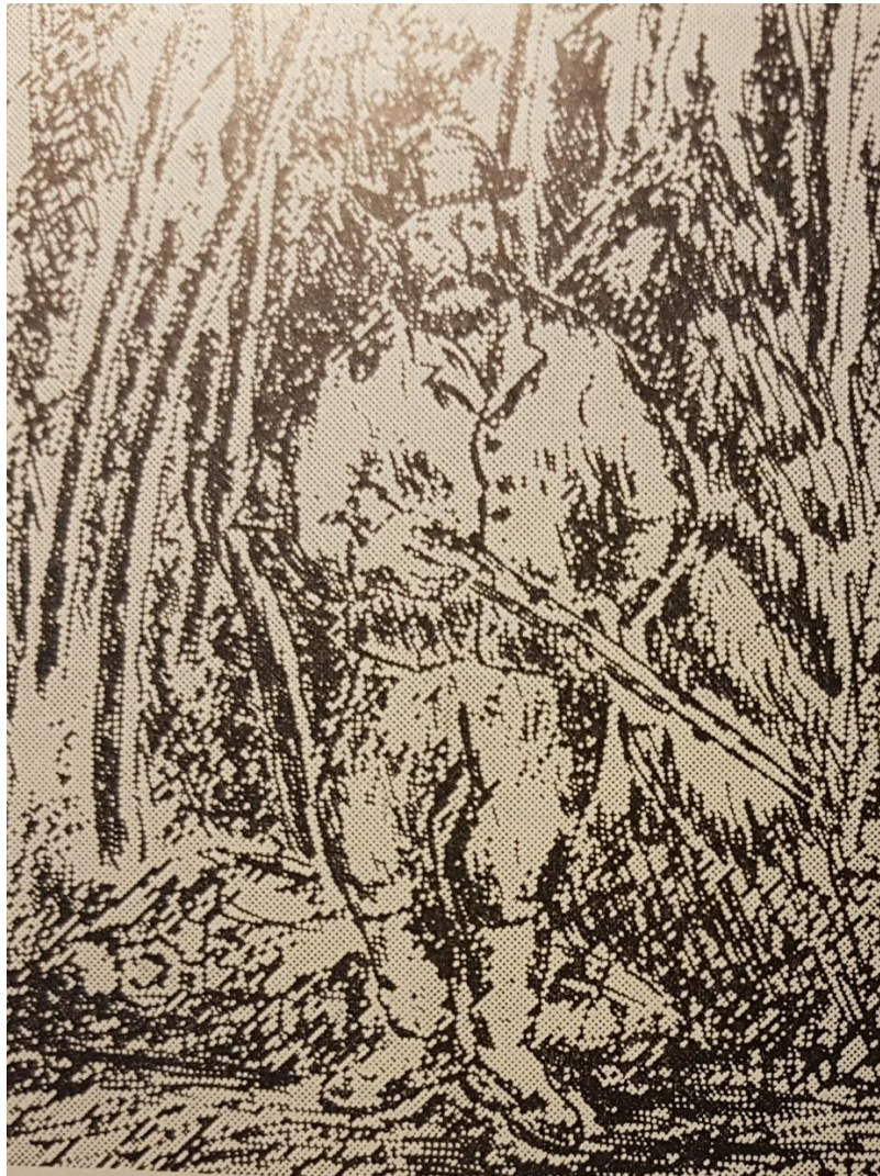
På ulvepost ved Bolfoss