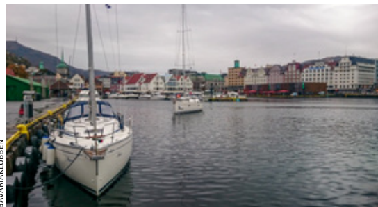
HØSTFEST VÅGEN: Mange ankommer høstfesten sjøveien.