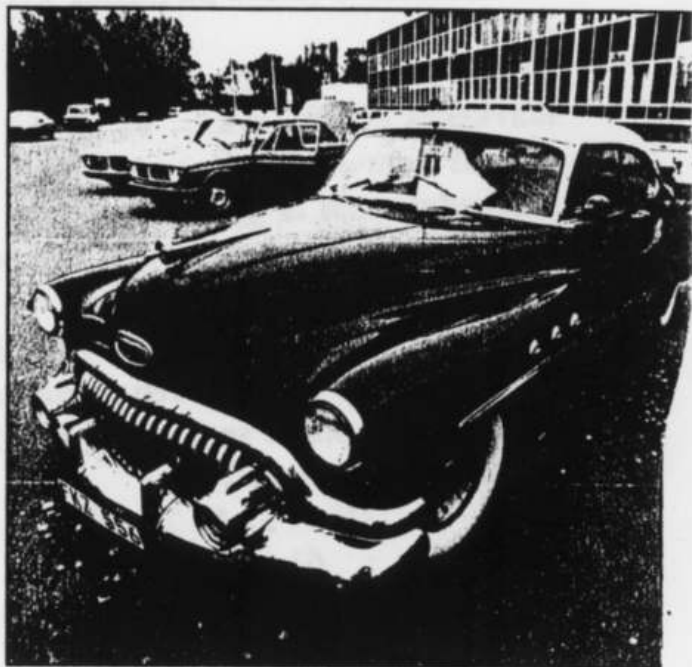
Denna Buick Super Riviera kastades det många längtansfulla blickar på.