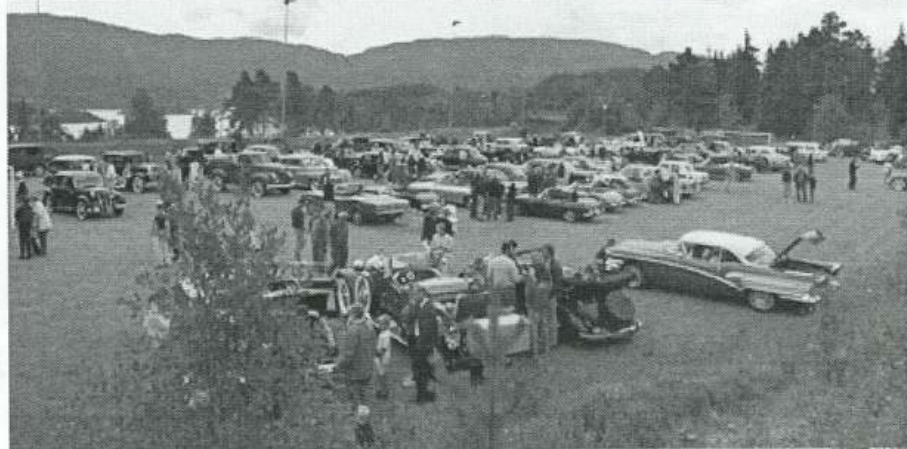
Volvo Bamse 475 1966 mod