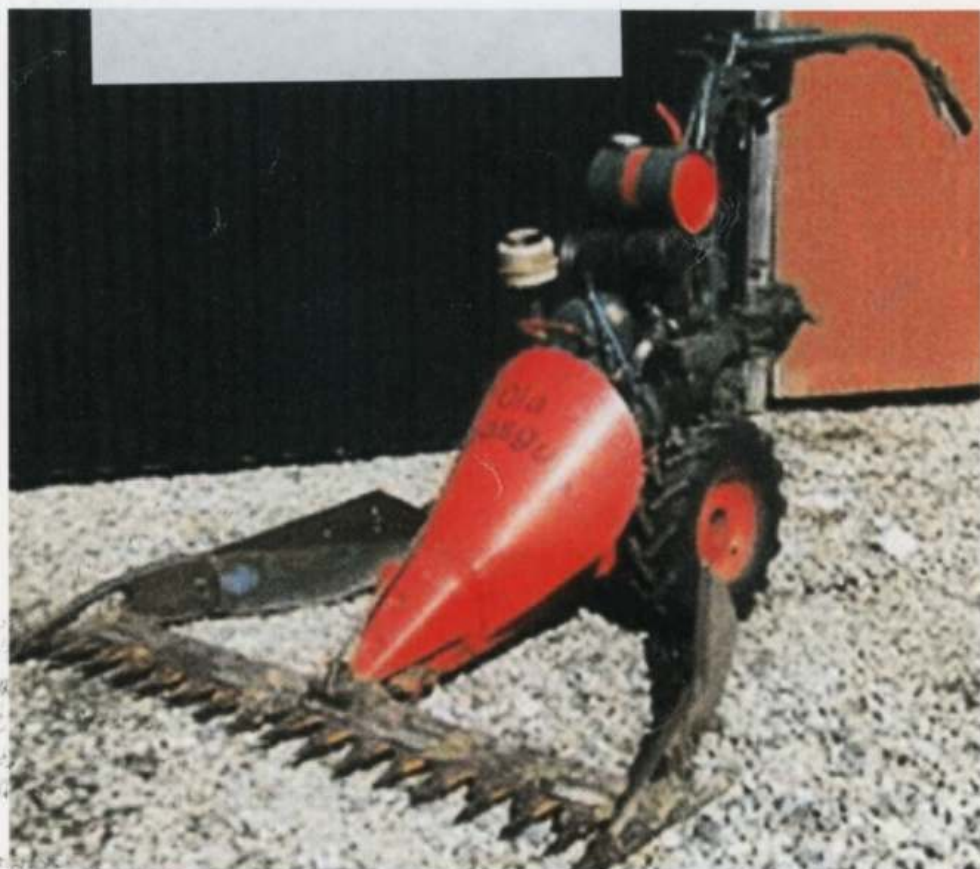
AGRIA UNIVERSAL som slåmaskin